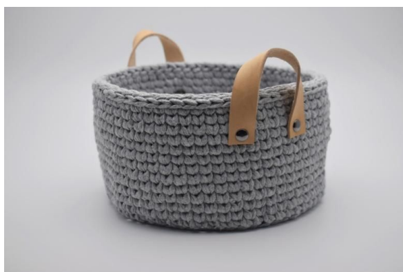
13. Sett på skinnremmen i hver side av kurven.