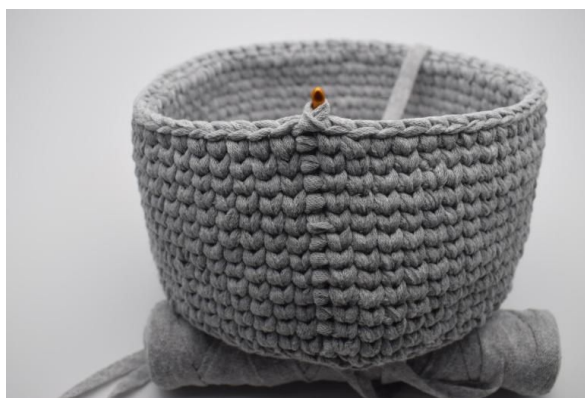
11. Slik gjentas omgangene til du har den ønskede høyden på kurven din.