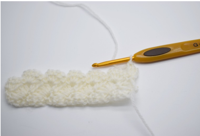
3.Hekle 2 stv i masken.