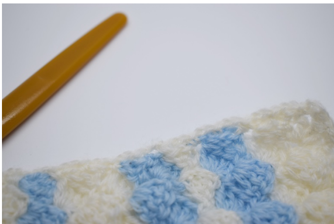
11. Gjenta hele veien rundt på teppet. Avslutt med 1 kjm.