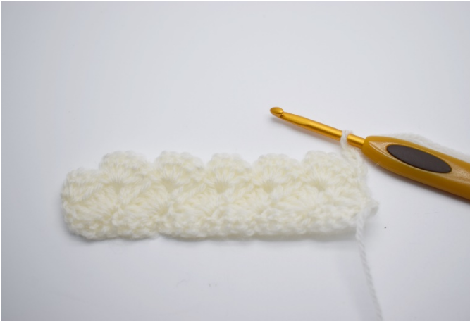
1.Snu rekke 83 som vanlig med 3 lm.