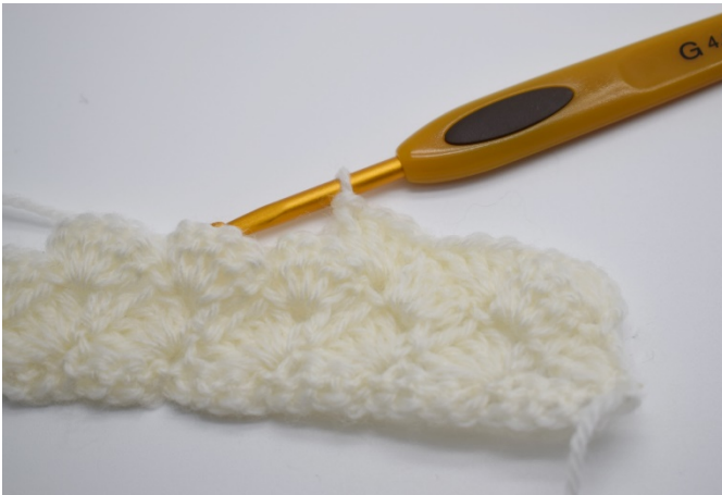
9. Hekle 3 stv i fastmasken fra den forrige rekken.