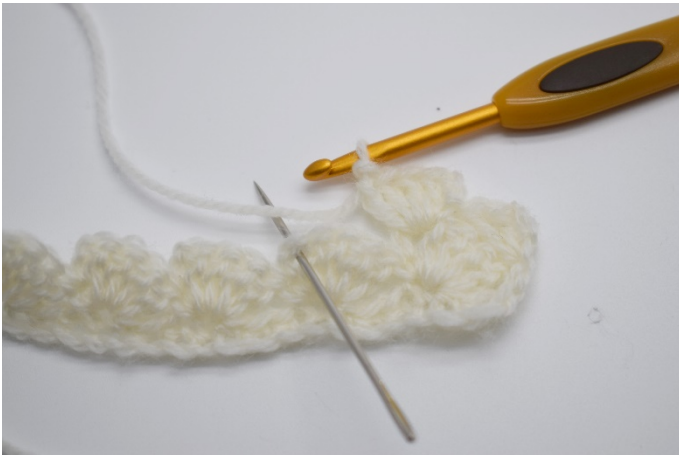
15. I den neste lm-bue fra den forrige rekken gjentas og det hekles "1fm, 2lm, 4 stv".