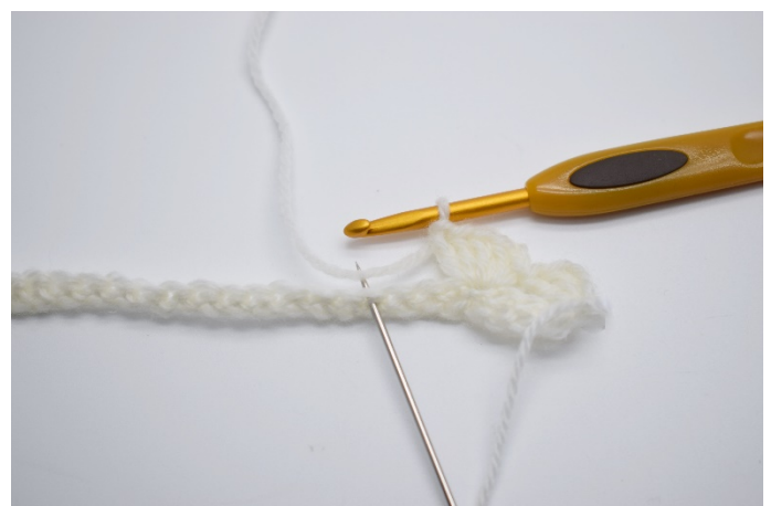
6. Spring over 3 masker.