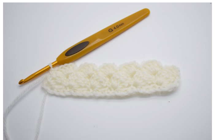
18. Slik ser arbeidet nå ut. Gjenta denne rekke til du har oppnådd det ønskede mål.