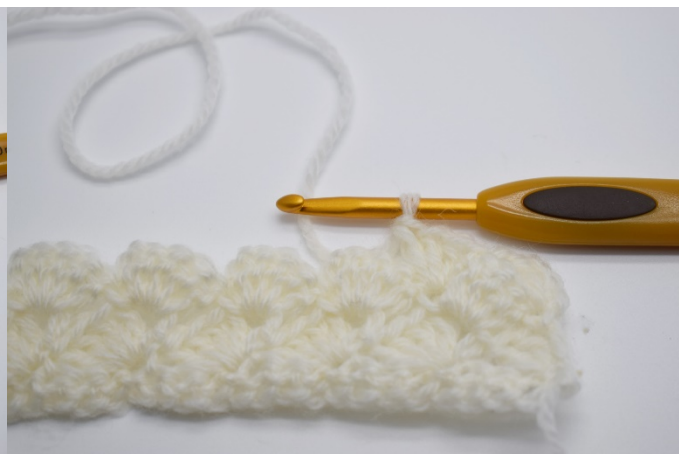
6.Hekle 3 stv i fm fra den forrige rekken.