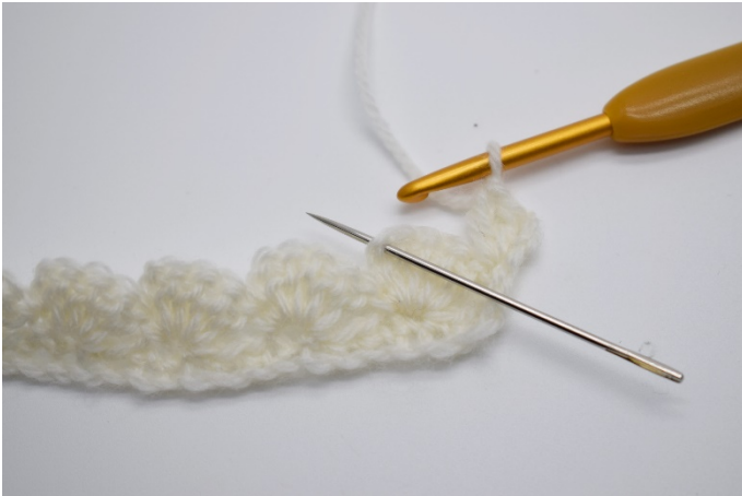
13. I lm-buen fra den forrige rekken hekles