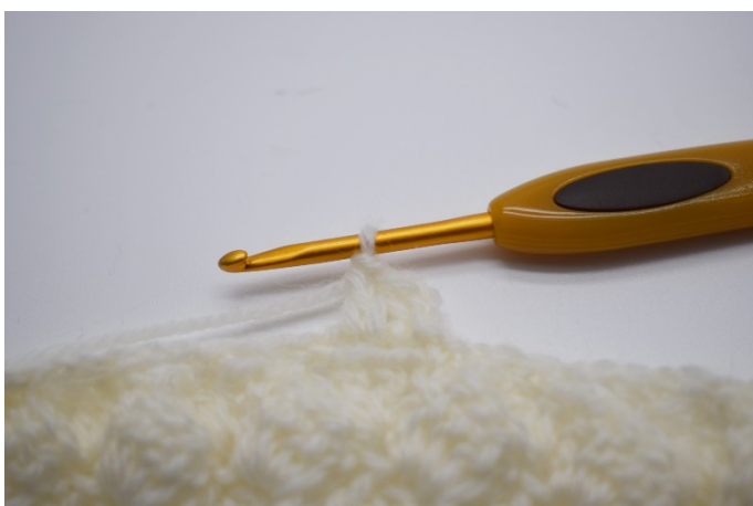
13. Hekle 2 stv ned i samme lm-bue.