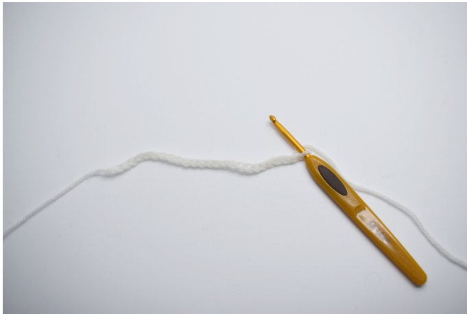
1. Legg opp luftmaskene dine.