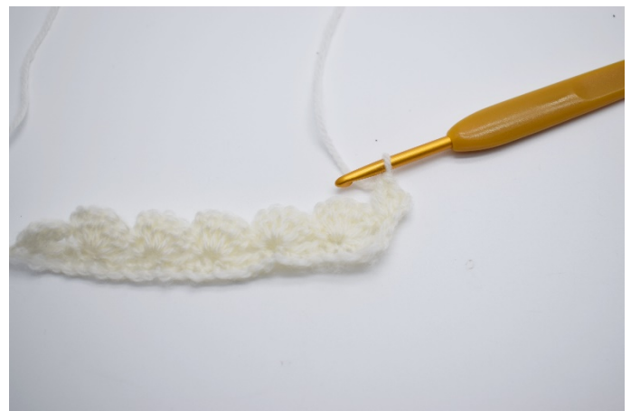
12. Hekle 2 stv i 1.maske.