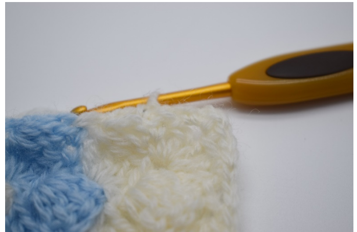
10. På teppets sider, springes ikke 2-3 masker over, men gjenta "1 fm, 2lm, 1 fm" for hver rekke ca. Pas på det ikke blir for stramt da teppet så vil bli krøllet.