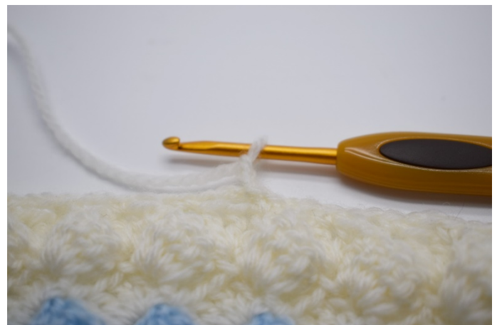
12. Nå lages 2 lm i den første lm-bue du nettopp har laget rundt i kanten.