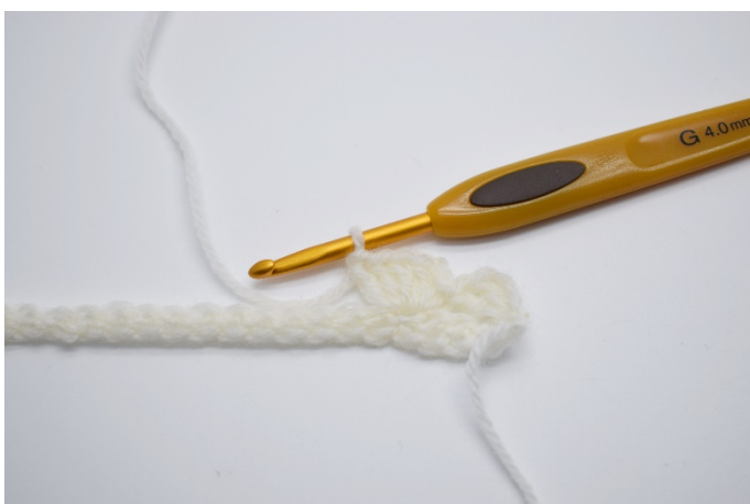
5. I neste maske hekles " 1fm, 2 lm, 4 stv".