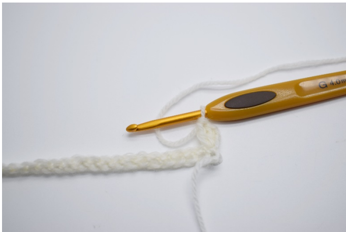
3. Snu arbeidet ditt med 3 lm, og hekle nå 2 stv i 1.fm.