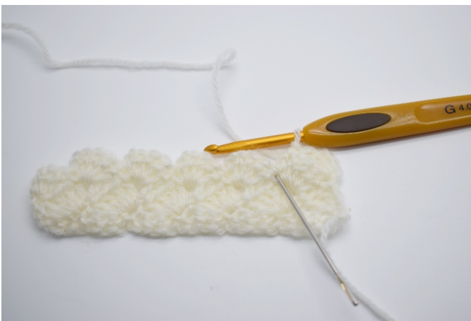
5.Nå hekles det i fm fra den forrige rekken.