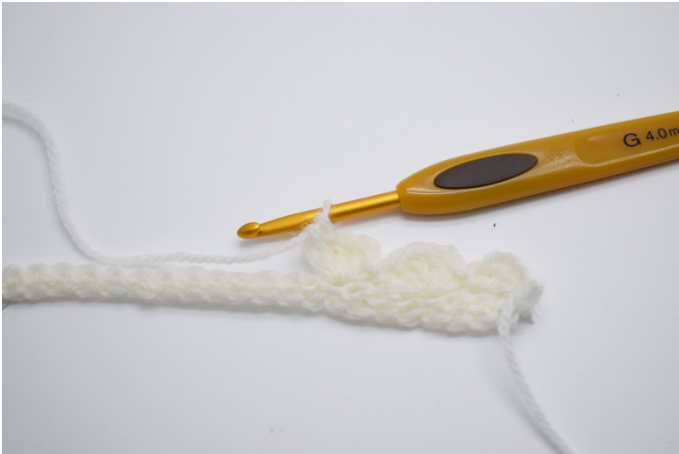
7. I neste maske hekles "1fm, 2 lm, 4 stv".