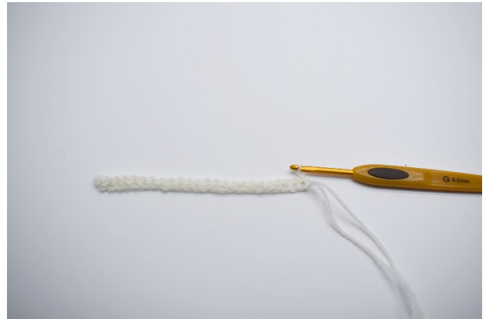
2. I 2.lm fra nålen hekles 1 fm, hekle nå fm rekken ut.