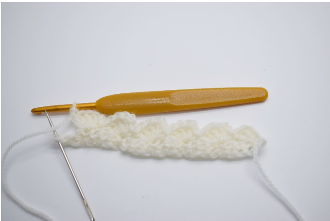
9. I den siste masken hekles 1 fm.