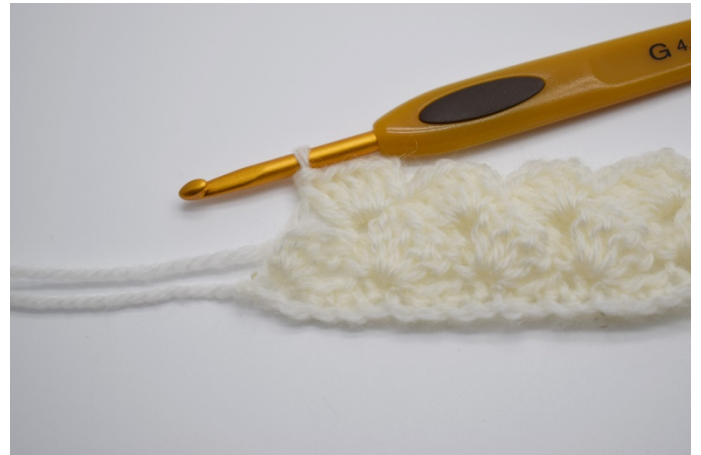
16. Gjenta rekken ut.