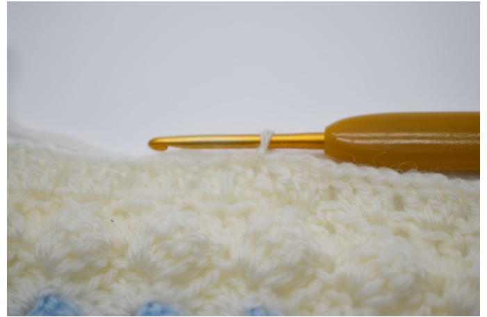
16. Avslutt med 1 kjm.