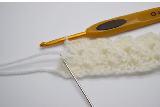
17. I den siste masken hekles 1 fm.