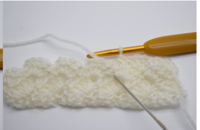
8. Nå hekles det i fm fra den forrige rekken.