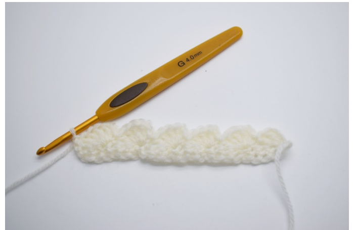
10. Slik ser den første rekken nå ut.