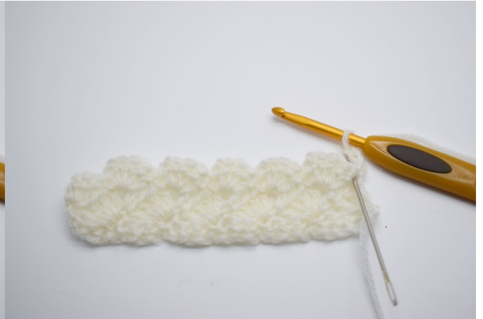
2.De neste maskene hekles i 4. lm fra nålen.