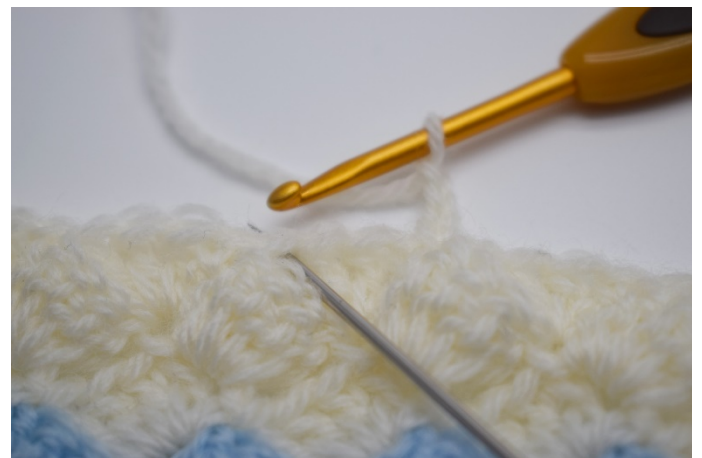
2. Spring over 2-3 masker.