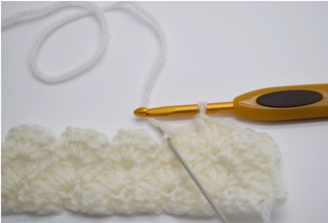
7. I lm-buen fra den forrige rekken hekles 1 fm.