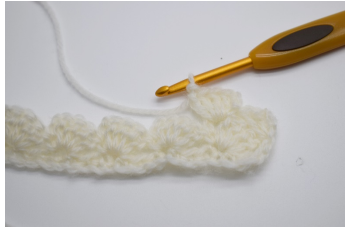
14. "1 fm, 2 lm, 4 stv".