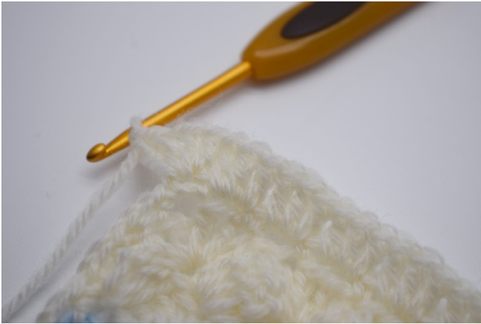
15. I lm-buen i hjørnet hekles "2 stv, 1lm, 2 stv". Gjenta nå hele veien rundt om teppet.