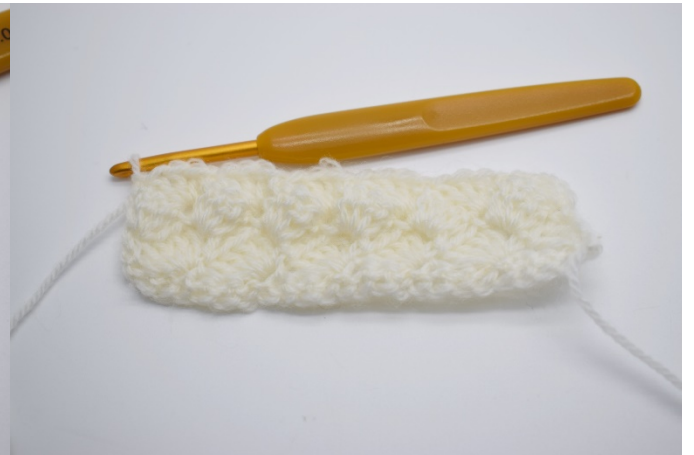
10. Gjenta rekken ut og avslutt med 1 fm.