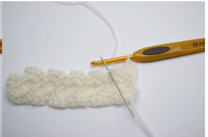
4.I lm-buen fra den forrige rekken hekles nå 1 fm.