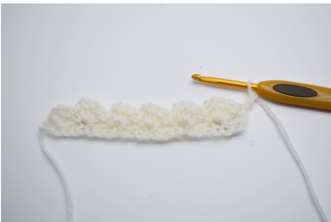
11. Snu arbeidet ditt med 3 lm.