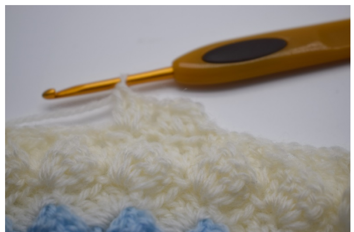
14. Hekle 3 stv i neste lm-bue.