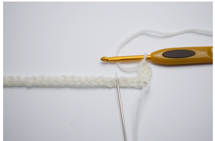
4. Spring over 3 masker.