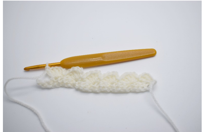
8. Gjenta "spring over 3 masker, i neste maske hekles "1fm, 2 lm, 4 stv"." Rekken ut.