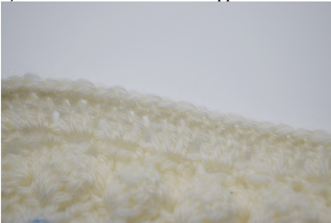
17. Avslutt nå kanten med en omgang fm.