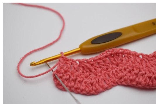
16. I snumasken hekles 2 stv