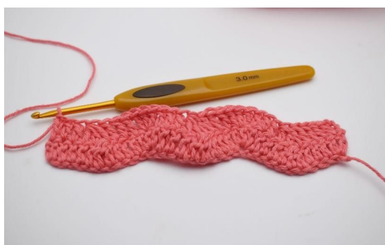
15. "Hekle 1 stv i de neste 3 m. Nå hekles 3 stv sammen. Hekle 1 stv i de neste 3 maskene og i den etterfølgene maske hekles 3 stv i samme maske." Gjenta "til" rekken ut til du har 4 lm tilbake. Hekle 1 stv i de neste 3 lm. I siste lm hekles 2 stv.