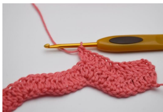
14. I den etterfølgende m hekles 3 stv i i samme m.