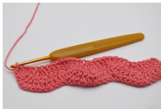
18. Slik gjentas rekkene.