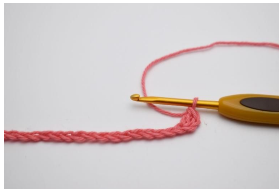
2. Hekle 1 stv i 3. lm fra nålen