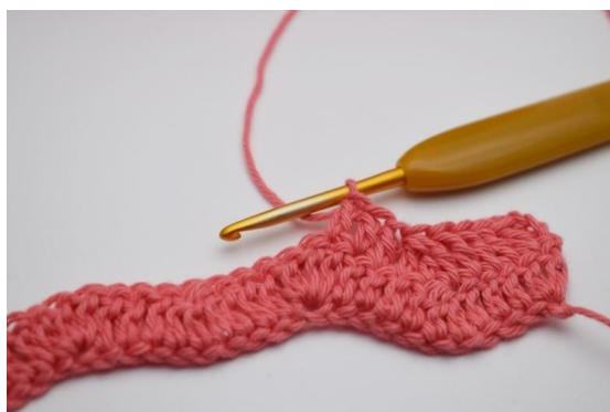
13. Hekle 1 stv i de neste 3 m