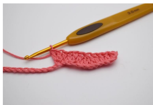
6. I den etterfølgende lm hekles 3 stv i samme lm