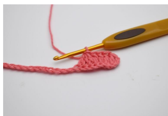
4. Nå hekles 3 stv sammen