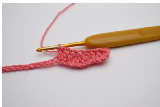
5. Hekle 1 stv i de neste 3 lm