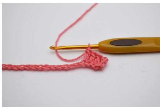
3. Hekle 1 stv i de neste 3 lm