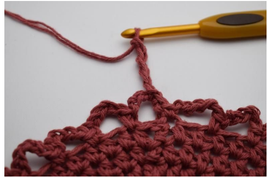
8. Lag 5 lm.