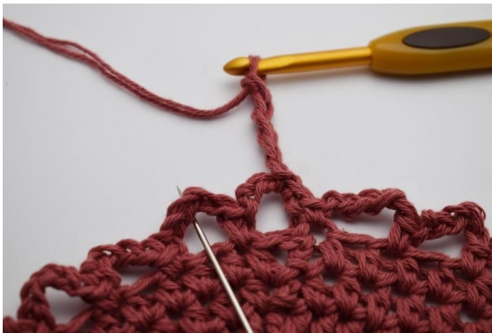
9. I den neste lm-buen (Nålen markerer den her).