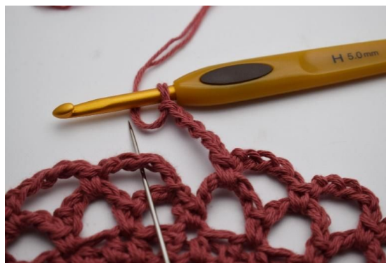
14. Slik gjentas omgangen rundt. omgangen avsluttes med 1 fm i den første lm-buen som ble dannet i denne omgangen.