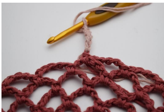
18. Skift til Gammelrosa ved å lage de neste 5 lm med den nye fargen.