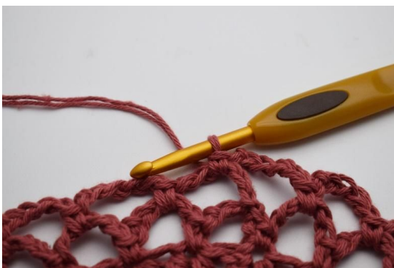
16. Hekle 1 fm i den neste lm-buen. Slik gjentas omgangen til du i alt har 5 omganger med Mørk Gammelrosa.