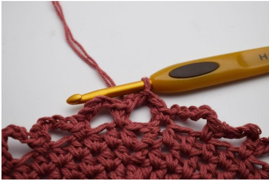
7. Lag 3 kjm opp langs den første lm-buen så du kommer til å starte i midten av buen.