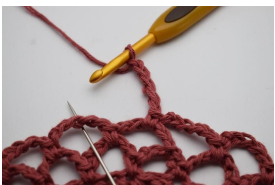
15. Da er du klar til å hekle ennå en omgang - lag 5 lm.