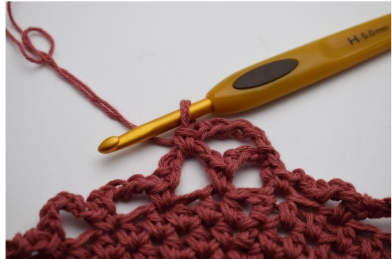
10. Hekles 1 fm