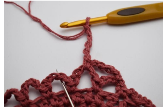
12. I den neste lm-buen (nålen markere den her)