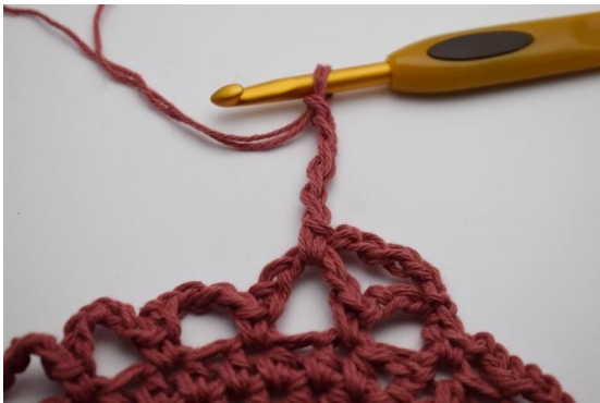
11. Lag 5 lm