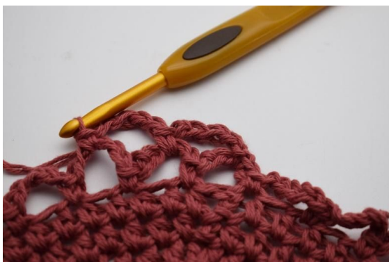
13. Hekles 1 fm