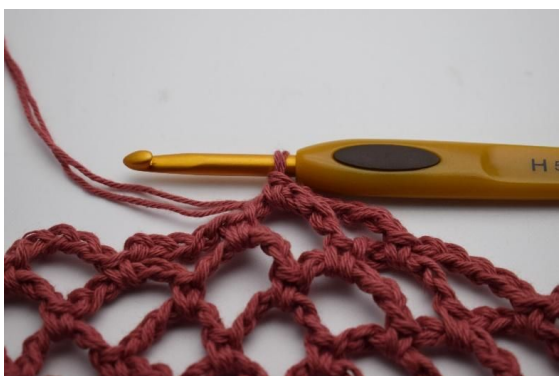
17. Den 5. omgangen med Mørk Gammelrosa er akkurat avsluttet.