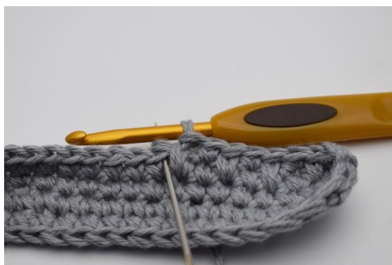
7. Hekle 1 fm som vanlig ved siden av.