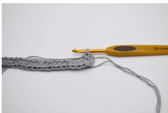
5. I siste lm hekles 4 fm. Nå må du hekle på den motsatte siden av din lm-rekke.