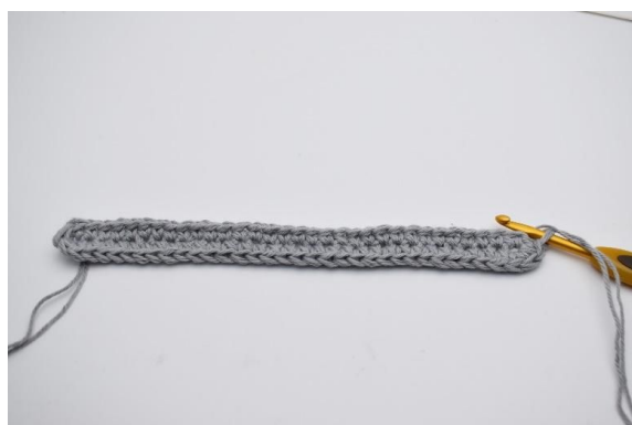
8. Hekles 1 fm (67)