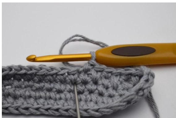
5. Den neste masken er igjen en dfm (nålen markerer hvor din dfm skal hekles).