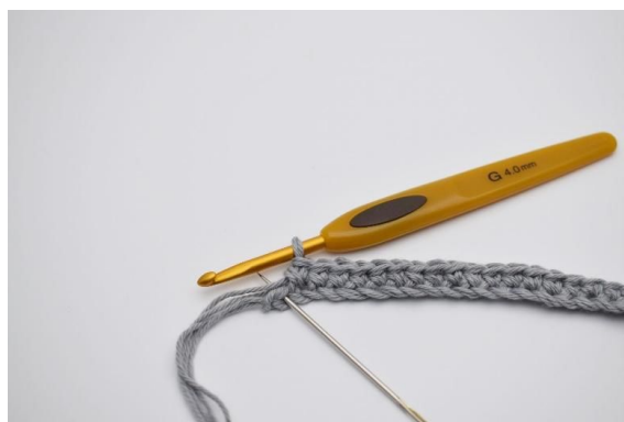
4. Hekle nå 1 fm i de neste 30 lm.