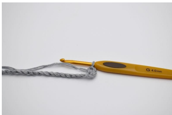
3. Hekle 2 fm.