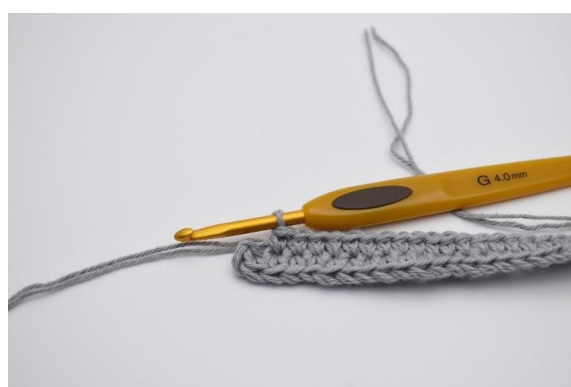
6. Hekle 1 fm i de neste 30 lm.