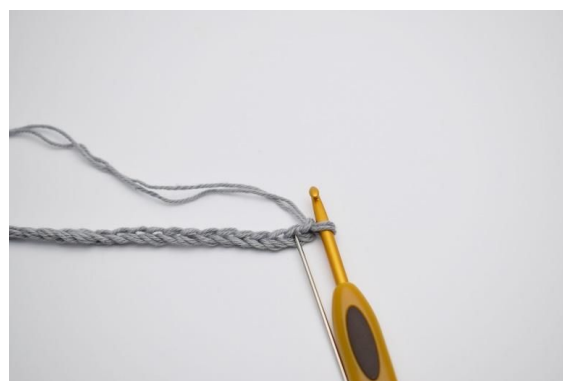
2. I 2. lm fra nålen (nålen markerer dette her)