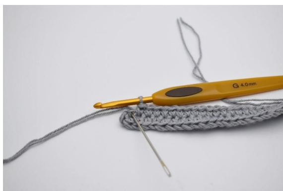
7. I den siste lm (nålen markerer dette her)