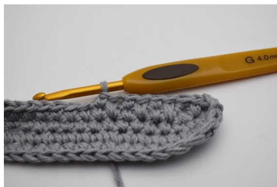
8. Slik gjentas omgangen rundt med skiftende "dfm, fm" og avsluttes med 1 kjm.