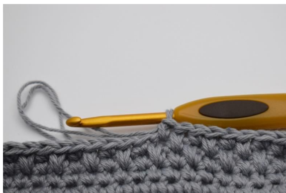
9. Når du skal hekle den neste omgangen, hekles det motsatt, hvor du starter omgangen med 1 dfm og så en 1 fm. Dvs. at du hekler dfm i fastmaskene fra den forrige omgangen. Gjenta disse 2 omganger til lommeboken din har den ønskede høyde.