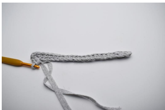
5. I siste lm hekles 5 fm.