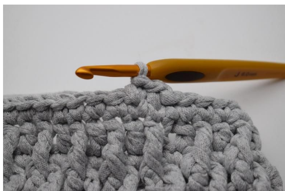
5. Det er nå heklet ennå en ks.