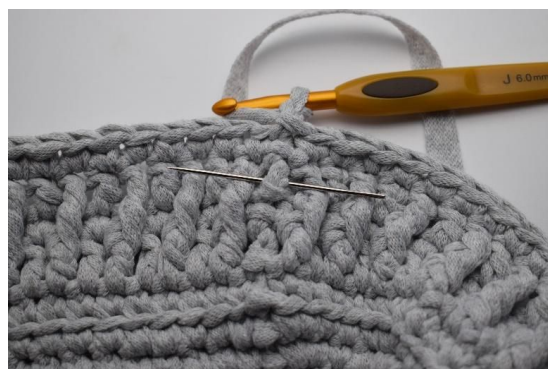
18. Lag 1 lm og hekle nå 1 Frdblst omkring stv under den forrige omgangen. Nålen her markere hvordan masken skal hekles ned omkring staven fra den forrige omgangen.