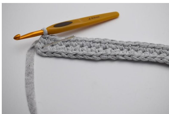
7. Den siste masken er den masken som nålen markerer.