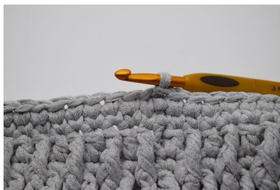
6. Hekle ks hele veien rundt og avslutt med 1 kjm.