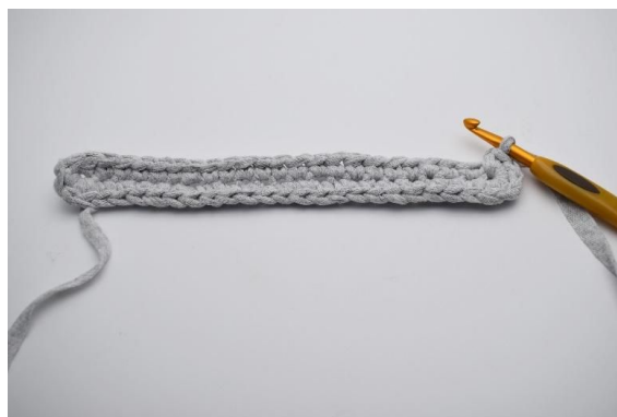
8. Hekle 5 fm i den siste m.