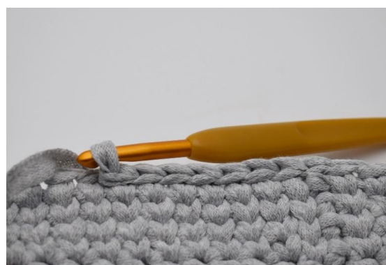
8. Nå hekles en omgang kjm. Vesken din er nå klar til å få satt på hankene.