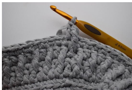
20. Hekle 1 stv i neste m.