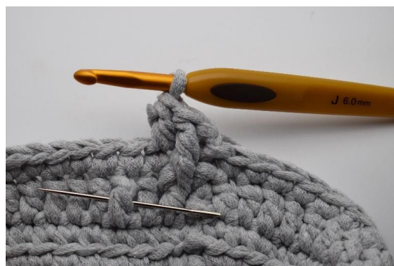
12. Hekle nå 1 Frdblst omkring stv under den forrige omgangen. Nålen her markerer hvordan masken skal hekles ned omkring staven forfra.