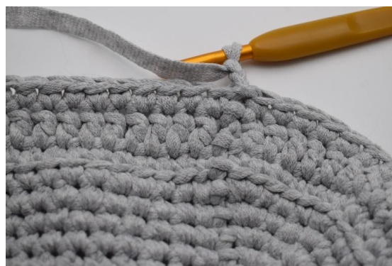
8. Lag 2 lm (erstatte 1. stv).