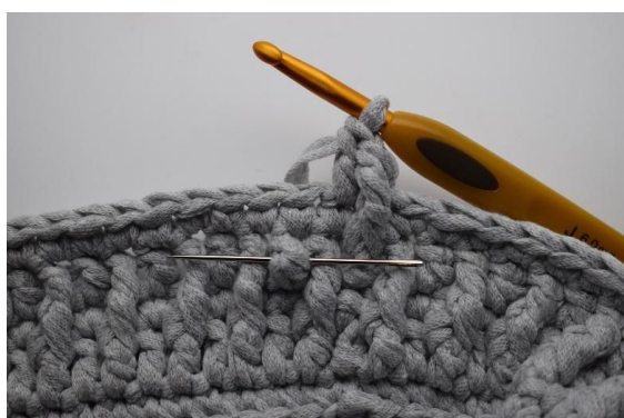
21. Hekle nå 1 Frdblst omkring stv under den forrige omgangen. Nålen her markerer hvordan masken skal hekles ned omkring staven forfra.