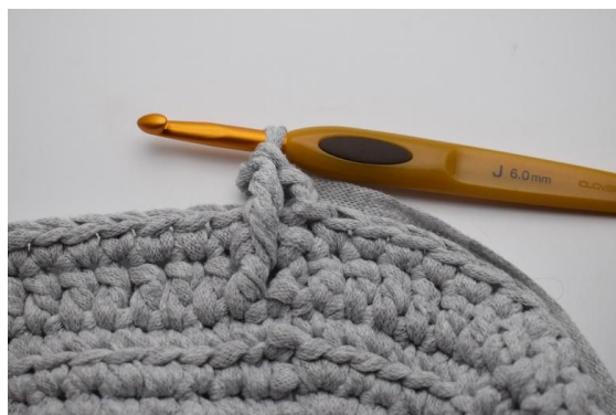
10. Slik ser arbeidet ditt ut nå.