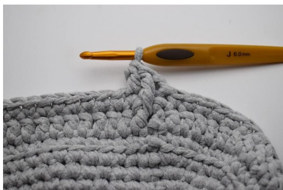
11. Hekle 1 stv i neste m