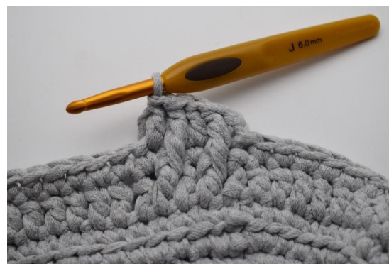
14. Hekle 1 stv i neste m.