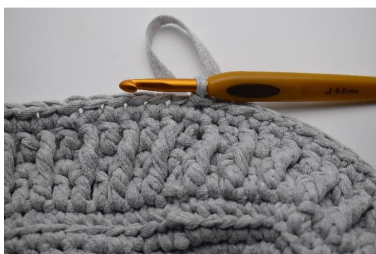
17. Avslutt med 1 kjm.