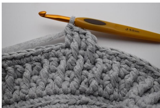
23. Hekle 1 stv i neste m.