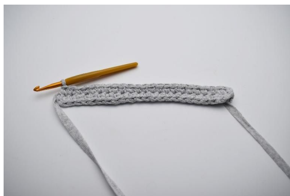
6. Nå hekles på den motsatte siden av lm-rekken din. Hekle 1 fm i de neste 21 lm.