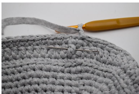
9. Hekle nå 1 Frdblst omkring stv under den forrige omgangen. Nålen her markerer hvordan masken skal hekles ned omkring staven fra den forrige omgangen.