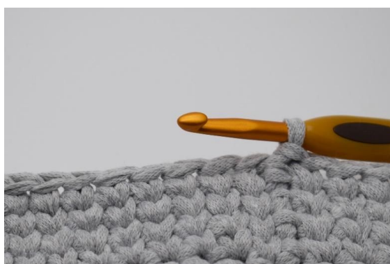
7. Gjenta omgangen så du i alt har 2-3 omganger. Antallet av omganger avhenger av hvor høy du vil ha at kanten på vesken din skal være.