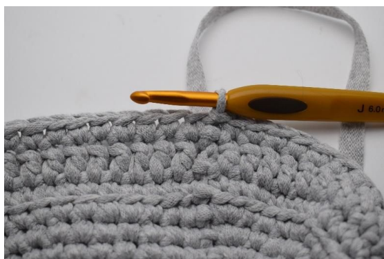
7. Avslutt med 1 kjm.