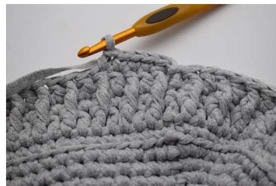
16. Lag 1 lm (erstatte 1. fm). Hekle 1 fm i samme m. Hekle nå fm omgangen rundt.