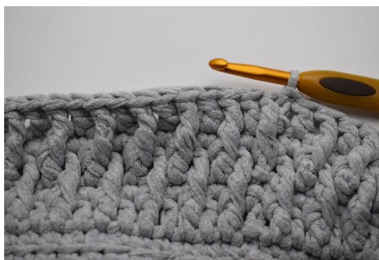
24. Hekle "1 Frdblst omkring stv fra den forrige omgangen og 1 stv i neste m". Gjenta "til" omgangen rundt. Avslutt med 1 kjm.