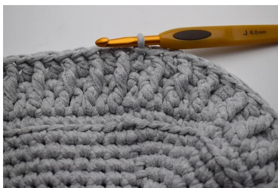
15. "Hekle 1 stv i neste m, 1 Frdblst under den forrige omgangen". Gjenta "til" omgangen rundt. Avslutt med 1 kjm.