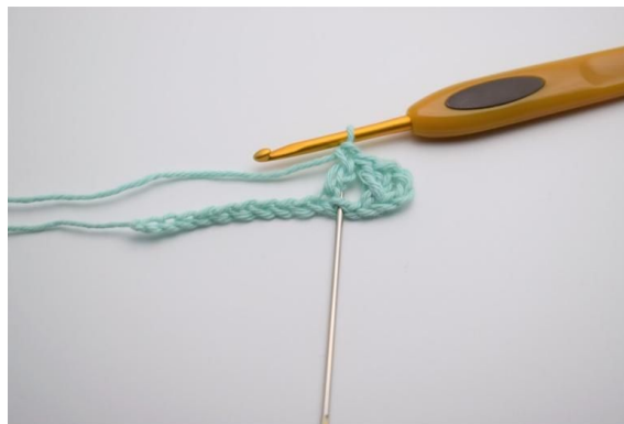
4. Nå hekles 1 stv i den masken du nettopp sprang over, så denne krysser den forrige stv.