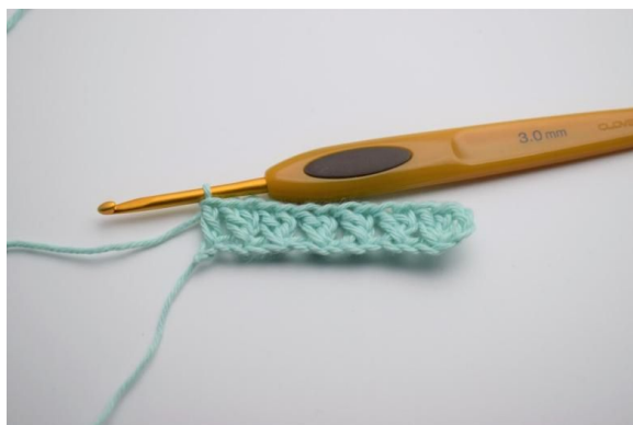
7. Nå er den første rekken med kryssede stv laget.