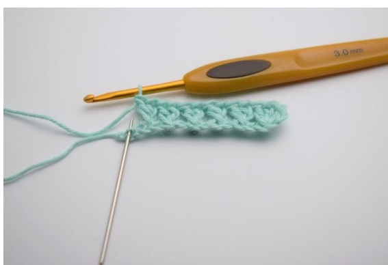
6. I den siste masken hekles 1 stv.