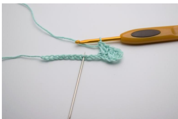
5. Spring over 1 lm, hekle 1 stv etterfulgt av 1 stv i den masken du nettopp sprang over, sånn at de krysser hverandre igjen.