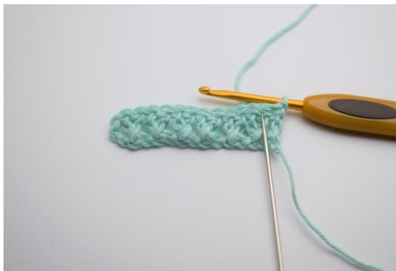
8. Snu arbeidet ditt med 1 lm (Denne lm erstatter 1. fm). Nå hekles fm rekken ut.