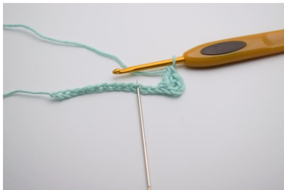
3. Spring over 1 lm og hekle 1 stv.