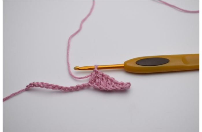
4. Hekle 1 stv i de neste 4 lm.