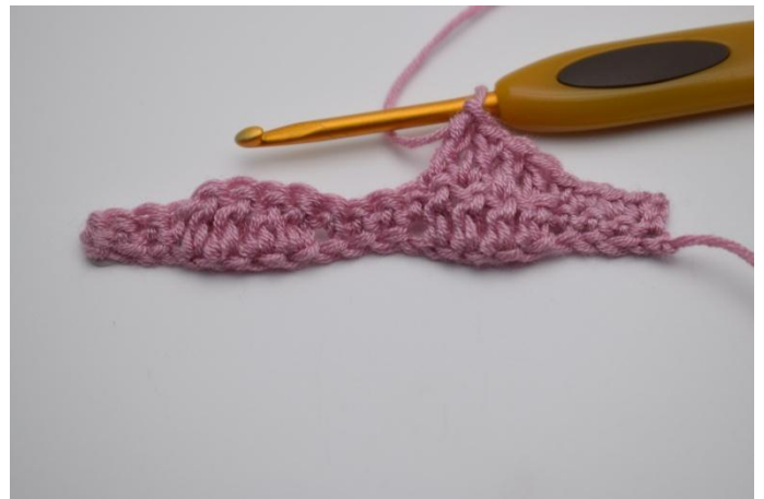
8. Hekle 1 stv i de neste 4 masker.