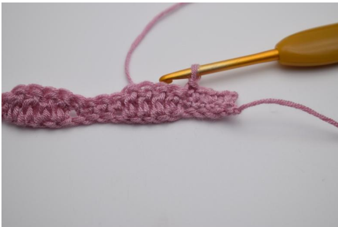
7. Hekle 1 fm i de neste 4 masker.