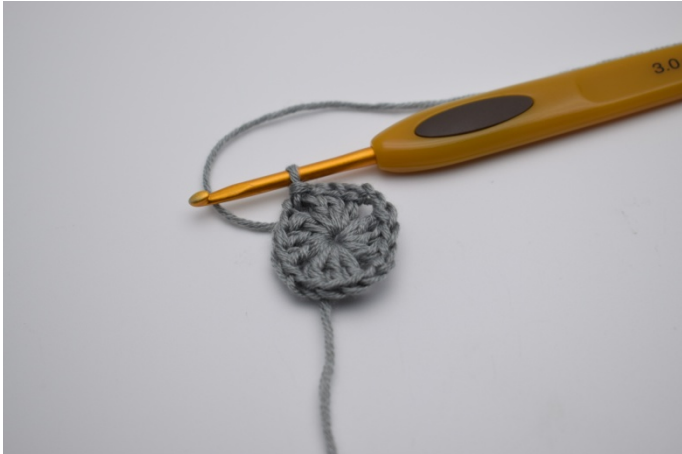
Lag nå kjm til det første lm-mellomrommet.