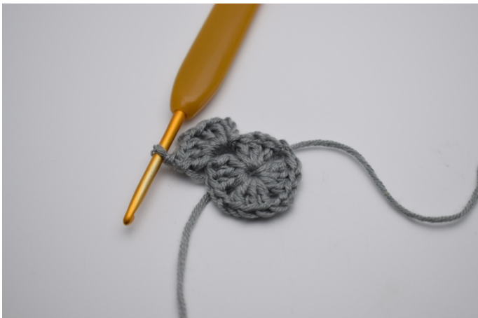
2 lm, og 3 stv ned i lm-mellomrommet etterfulgt av 1 lm.