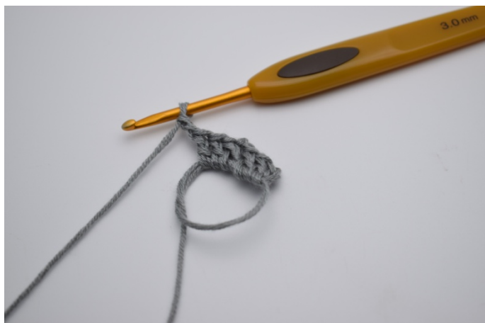
Hekle 3 stv ned i sirkelen og lag 2 lm.