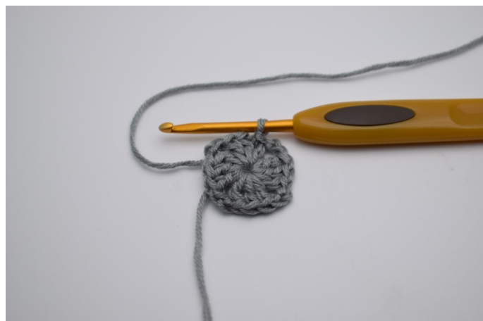
Hekle "3 stv ned i sirkelen og 2 lm". Gjenta "til" 2 ganger mer og avslutt med 1 kjm. Stram sirkelen til.