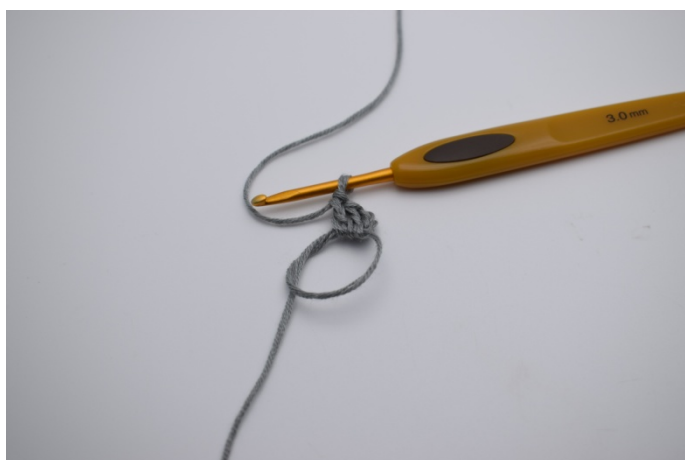
Lag en magisk sirkel. Lag 3 lm (erstatte 1 stv) Hekle 2 stv ned i sirkelen.