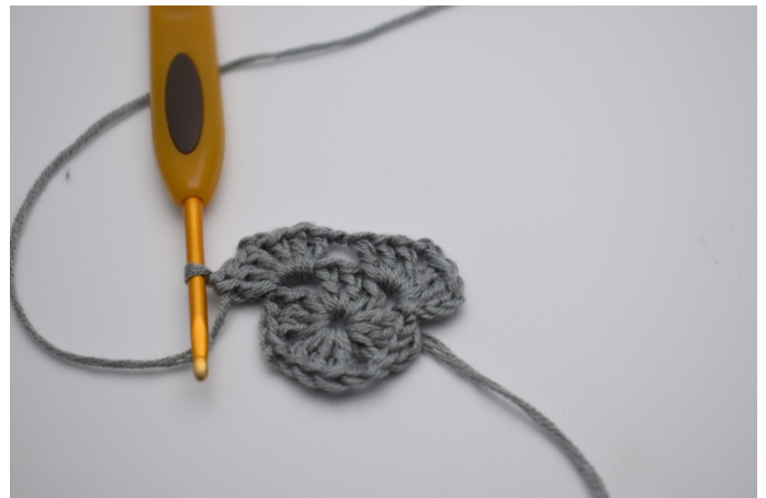
Hekle " 3 stv, 2 lm, 3 stv, 1 lm" i neste lm-mellomrom.