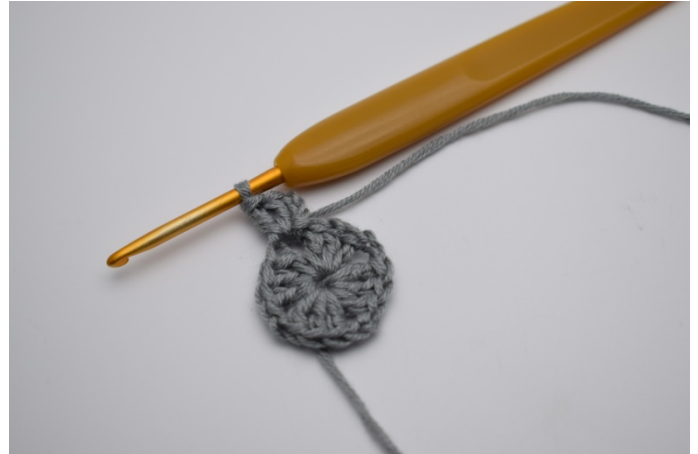
Lag 3 lm (erstatte 1.stv) Hekle 2 stv