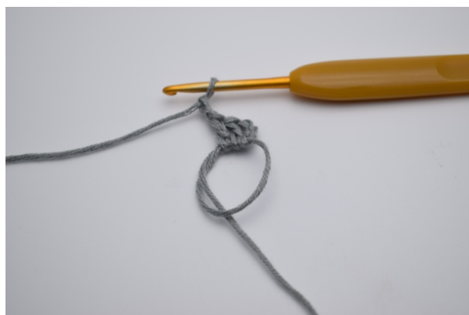
Lag 2 lm.