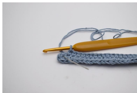
6. Hekle 1 fm i de neste 36 lm. I siste lm (nålen markerer dette her)