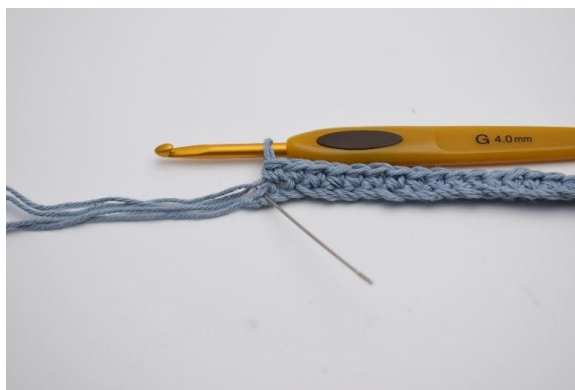
4. Hekle nå 1 fm i de neste 36 lm. I siste lm (nålen markerer dette her)