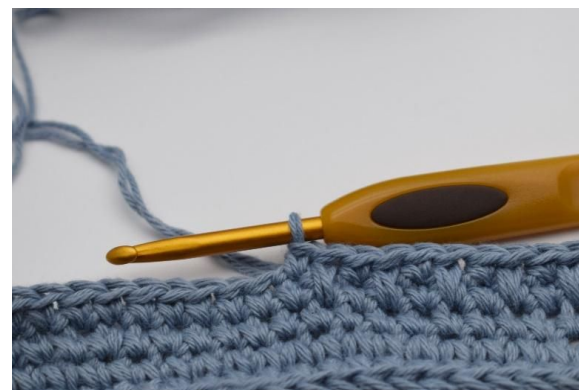
8. Sånn. Gjenta dette omgangen rundt.