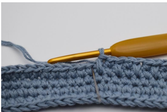
7. Hekle 1 fm som vanlig ved siden av.