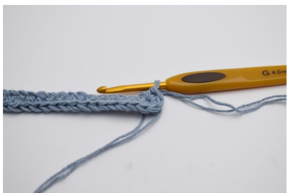
5. Hekles 4 fm. Nå må du hekle på den motsatte siden av din lm-rekke.