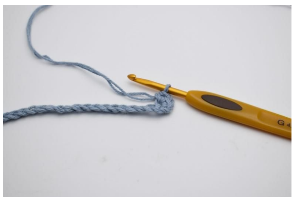
3. Hekle 2 fm.