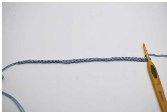
1. Start med å legge opp luftmaskene dine