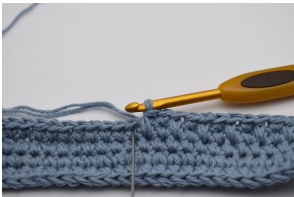
3. Hekle 1 fm som vanlig ved siden av.