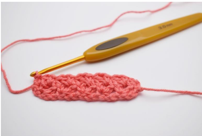
15. I snu-masken hekles 1 fm. Gjenta nå raden til du har den ønskede størrelse.