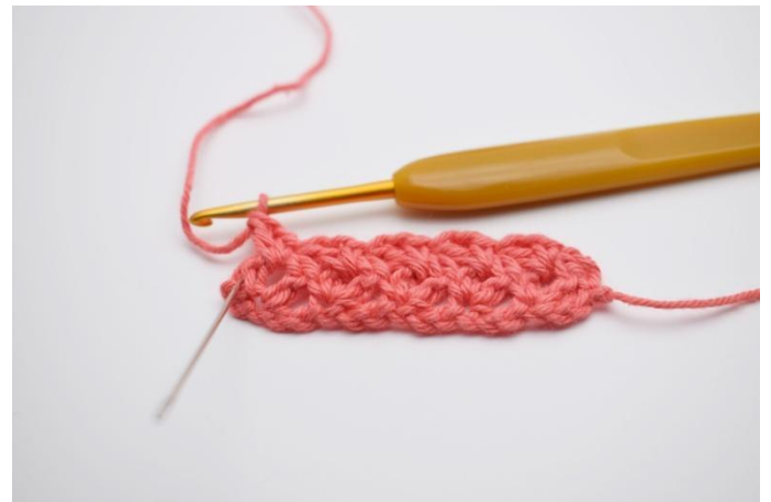
14. Gjenta raden ut.