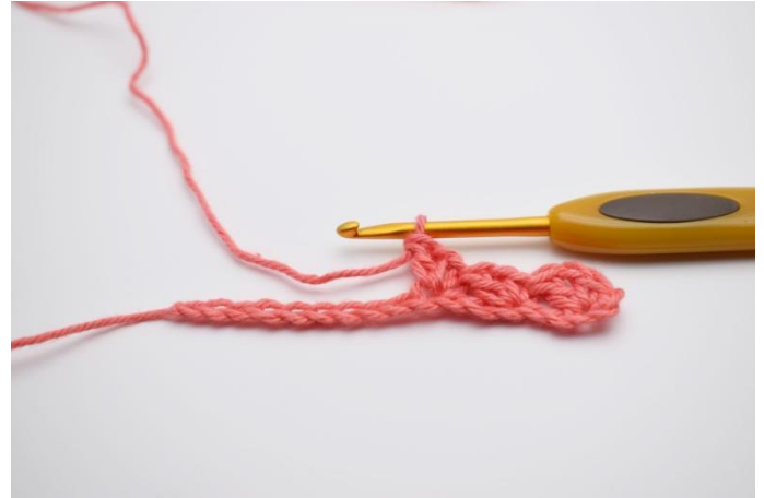
6. Hekle *1fm, 1 lm, 1 stv* i neste lm.