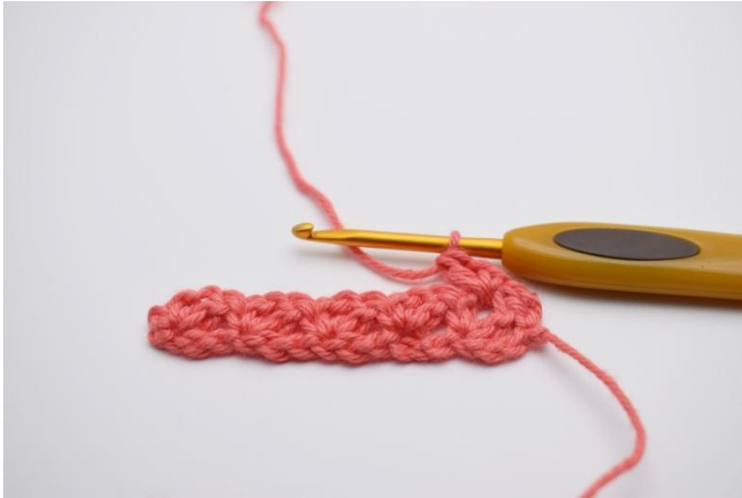
11. Hekle *1fm, 1lm, 1stv* i 1. lm- mellomrom