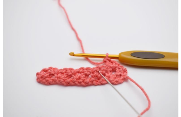
12. Hopp videre til neste lm- mellomrom.