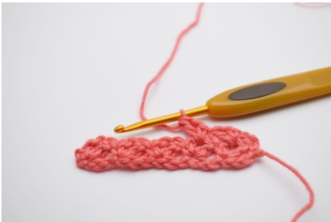
13. Hekle *1fm, 1lm, 1stv* i neste lm-mellomrom.