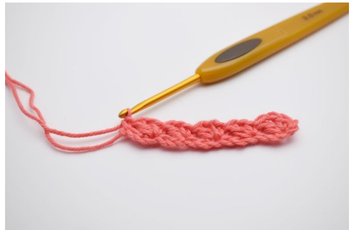
8. I siste lm, hekles 1 fm.