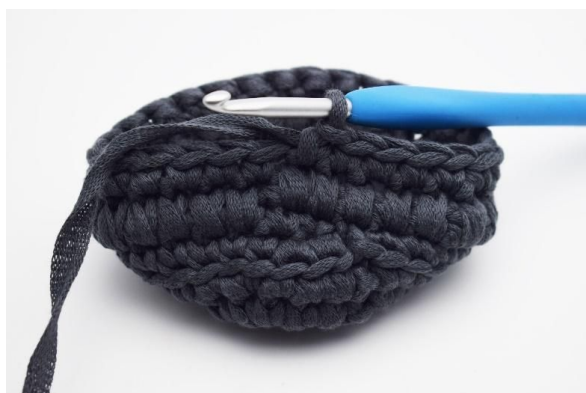
5. Hekle 1 omgang fm som vanlig.