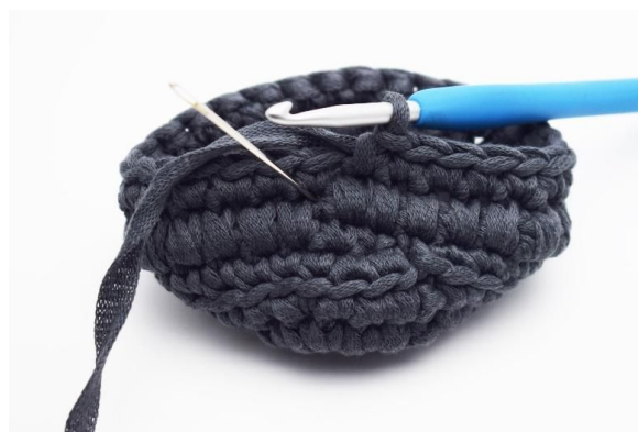
6. Nå hekles det igjen en omgang med dfm. Nålen her markerer hvor den neste dfm skal hekles.