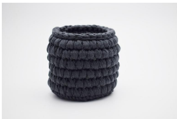
10. Avslutt med 1 omgang kjm.