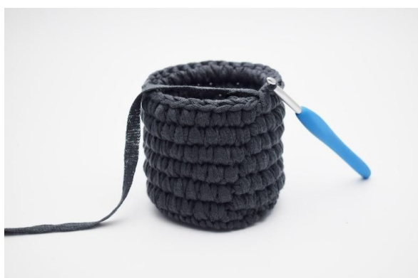
9. Gjenta vekselvis omgangene til du i alt har 6 omganger med dfm.