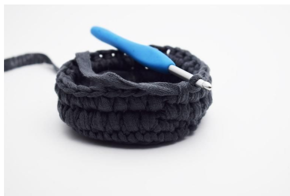
8. Slik gjentas omgangen rundt.