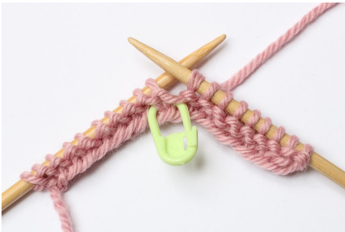
3. Sett den over på høyre pinne