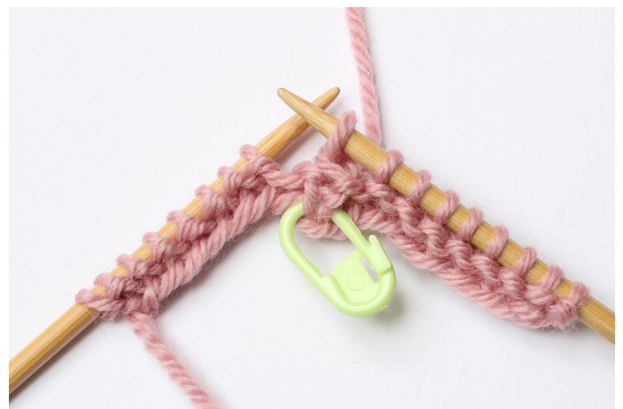
6. Trekk den løse maske over