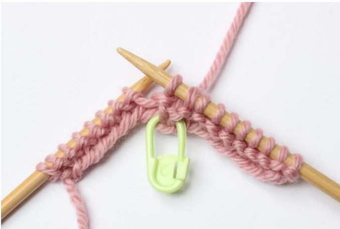
5. Strikk disse maskene rett sammen