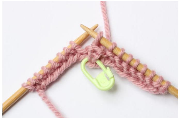
6. Trekk den løse maske over.