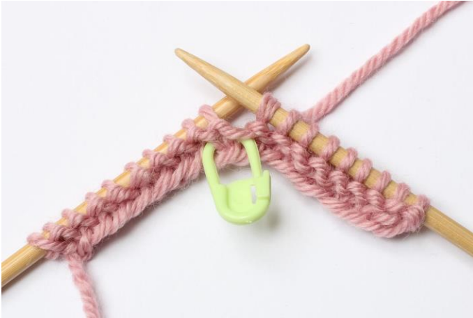
3. Sett den over på høyre pinne,