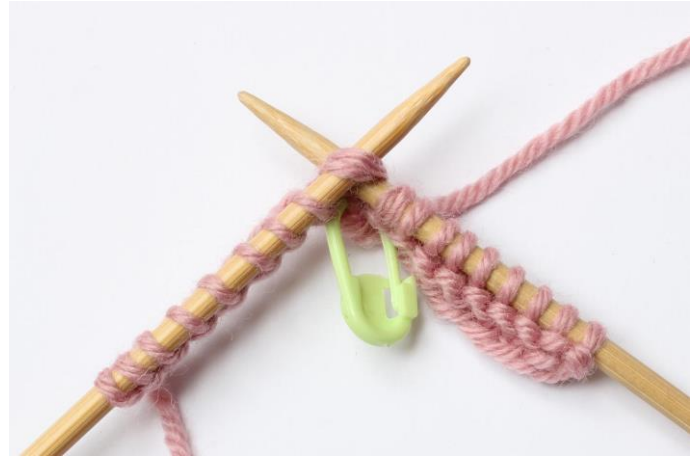
4. Stikk pinnen inn i 2 masker, fra venstre mot høyre,