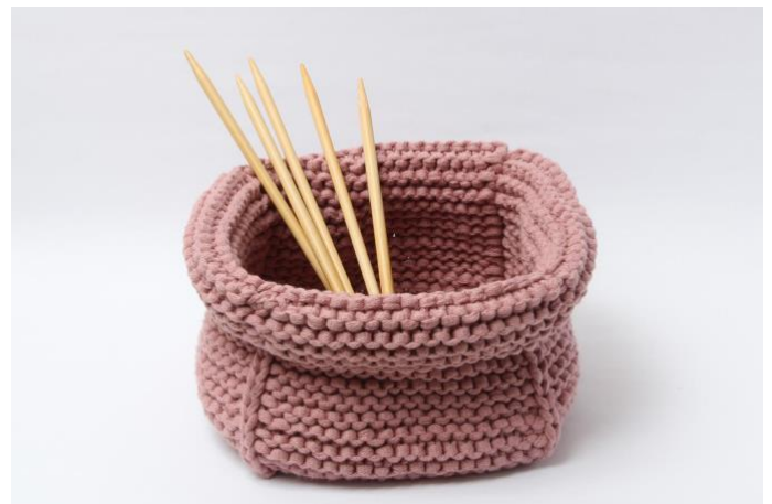
Kurv med rundt kant.