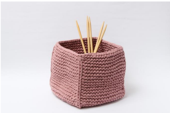
Kurv uten rundt kant.

Snu retten ut av arbeidet og fold kanten ned.