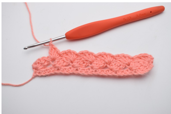
21. Gjenta dette rekken ut.