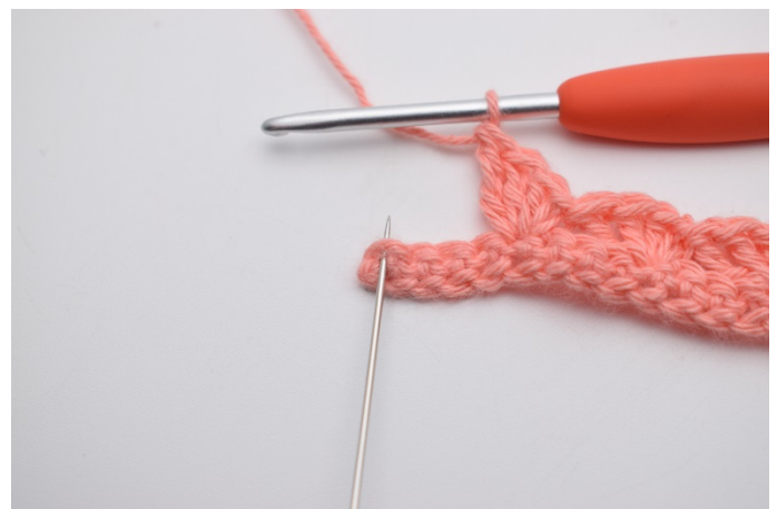
12. I den siste masken (den nålen her markerer)