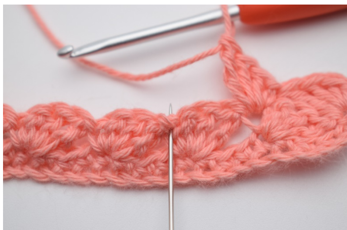
19. Spring over 3 masker.