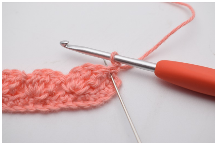
15. I den første masken (den nålen her markerer)