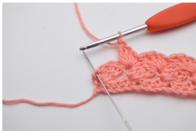
22. I den siste masken (den nålen her markerer)