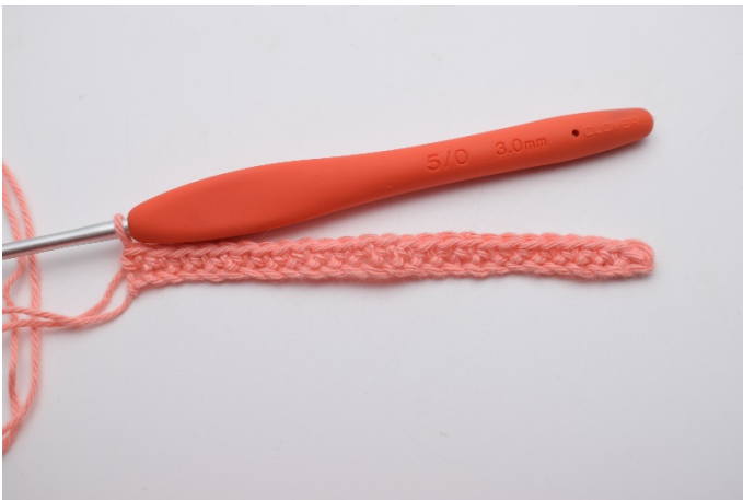
3. Hekle fm rekken ut.