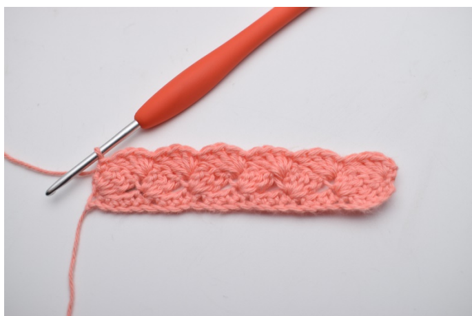
23. Hekles 1 fm.