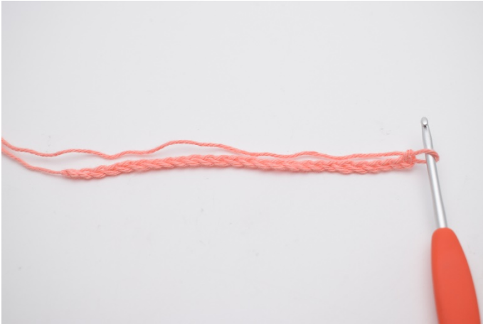
1. REKKE 1: Start med å legge opp luftmaskene dine.