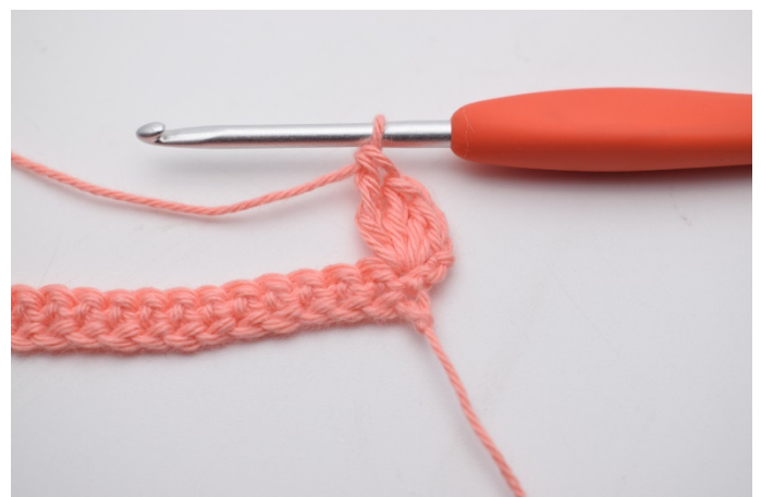
6. Hekles "1 fm, 2 stv, 1 dstv".