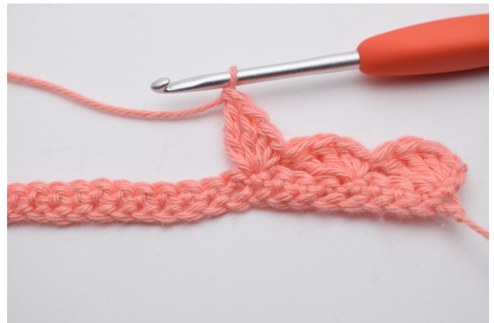
10. Hekle "1 fm, 2 stv, 1 dstv" i neste m.