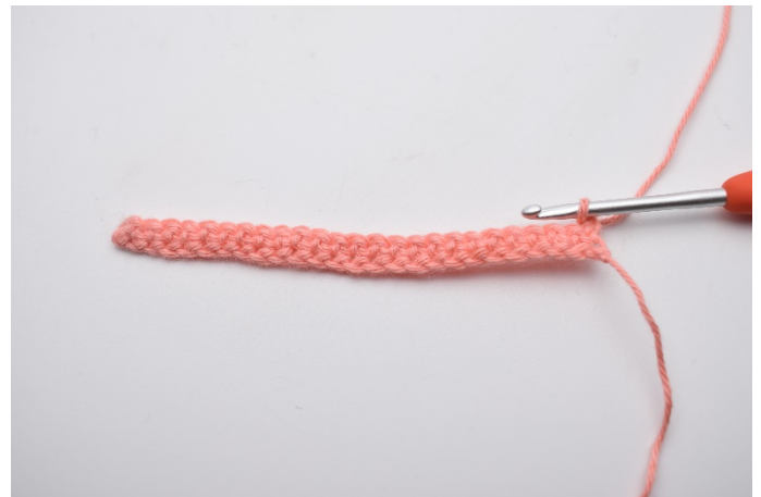
4. Snu arbeidet ditt med 1 lm.