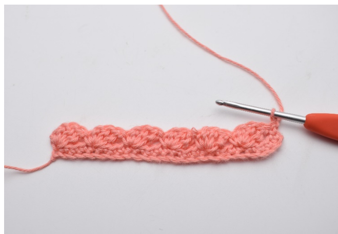
14. REKKE 3: Snu arbeidet ditt med 1 lm.