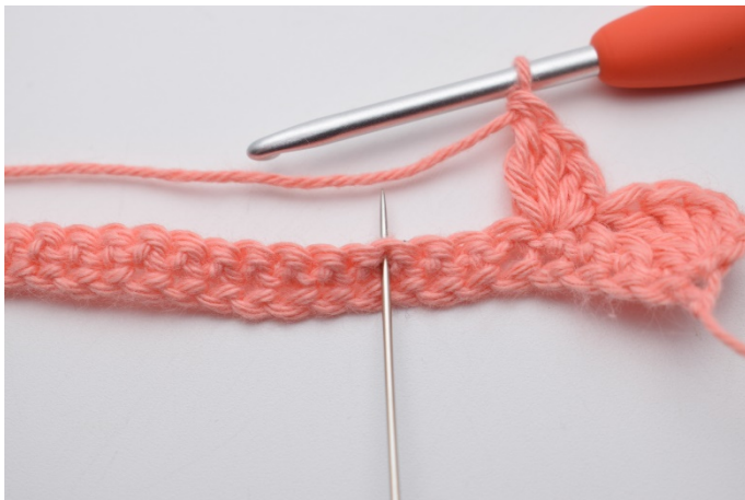
9. Spring over 3 masker.