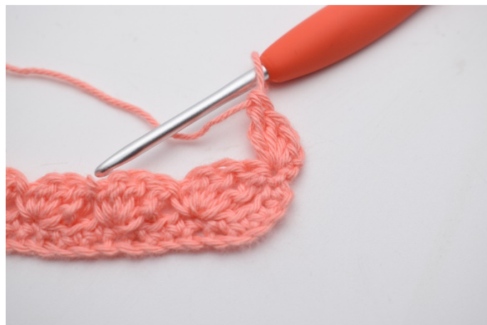
16. Hekles "1 fm, 2 stv, 1 dstv".