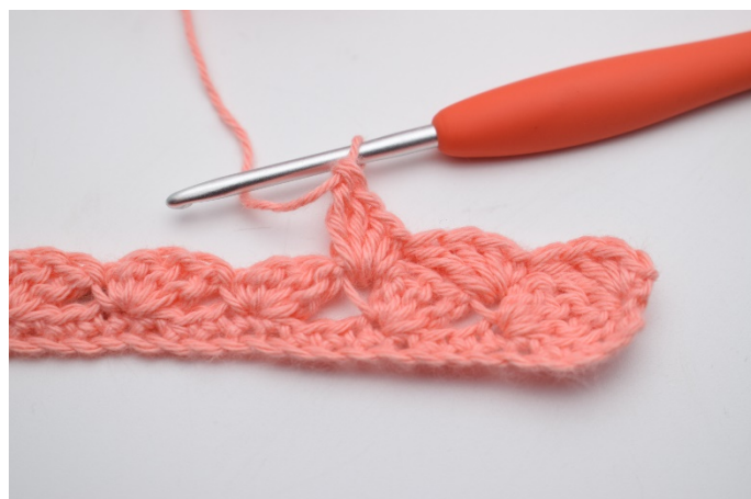
20. Hekle "1 fm, 2 stv, 1 dstv" i neste m.