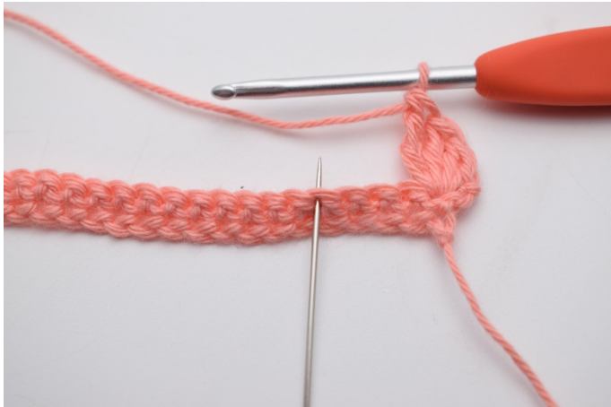
7. Spring over 3 masker.