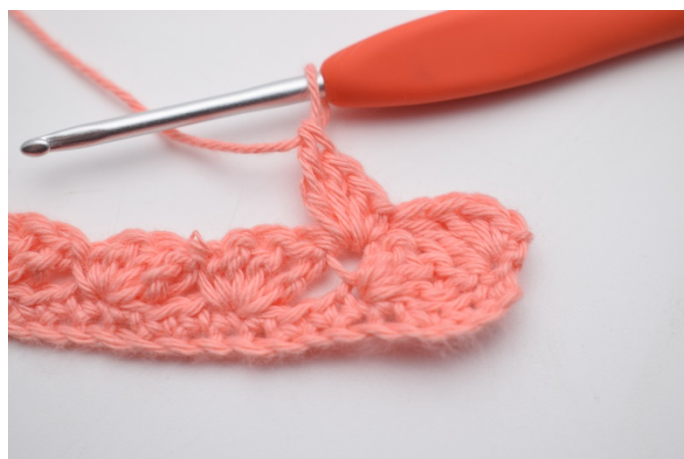
18. Hekle "1 fm, 2 stv, 1 dstv" i neste m.