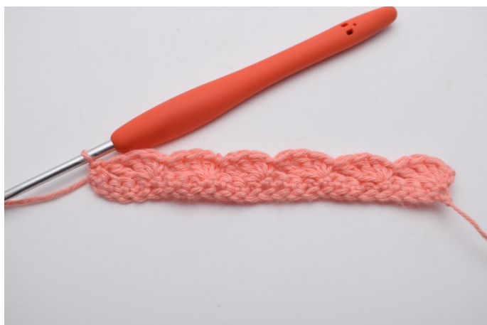
13. Hekles 1 fm.