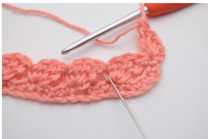
17. Spring over 3 masker.