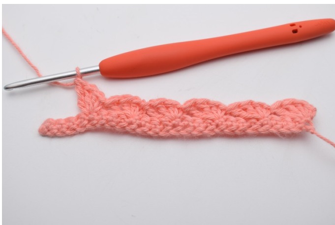
11. Gjenta dette rekken ut.