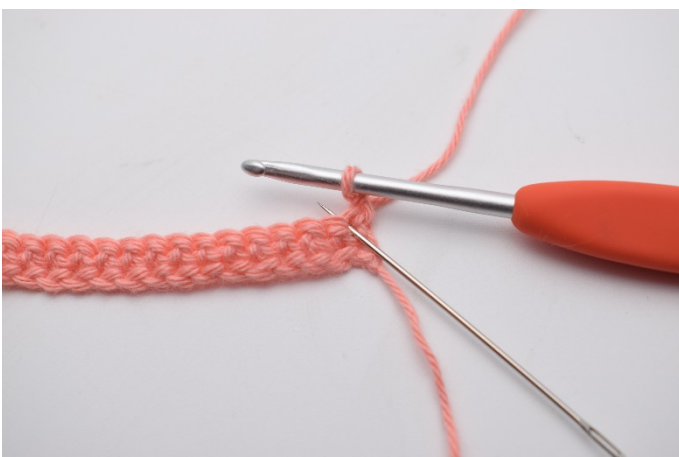
5. I den første masken (den nålen her markerer)