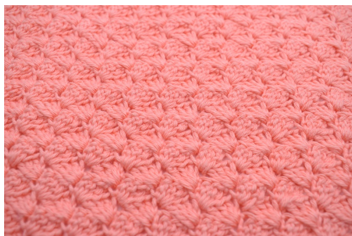
24. Gjenta nå rekke 3 som beskrevet i oppskriften