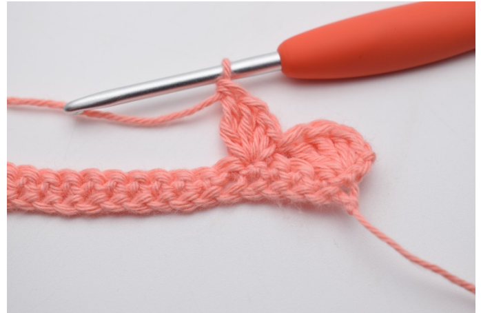
8. Hekle "1 fm, 2 stv, 1 dstv" i neste m.