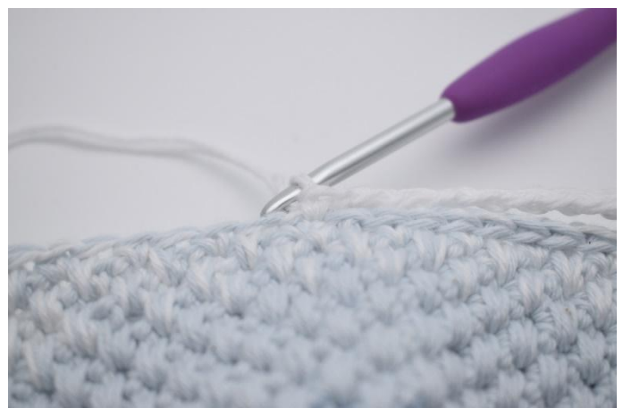
6. og hopp over de 18 km.