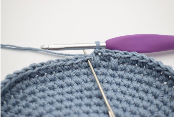
7. Hekle 1 fm som normalt ved siden av.