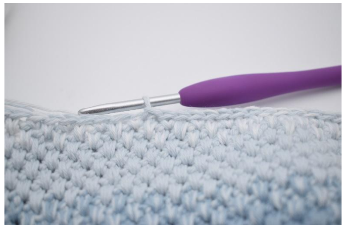
4. I de etterfølgende 18 m hekles det km.