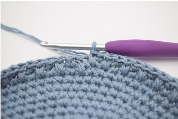
9. Gjenta omgangen rundt, og avslutt med 1 lfm.