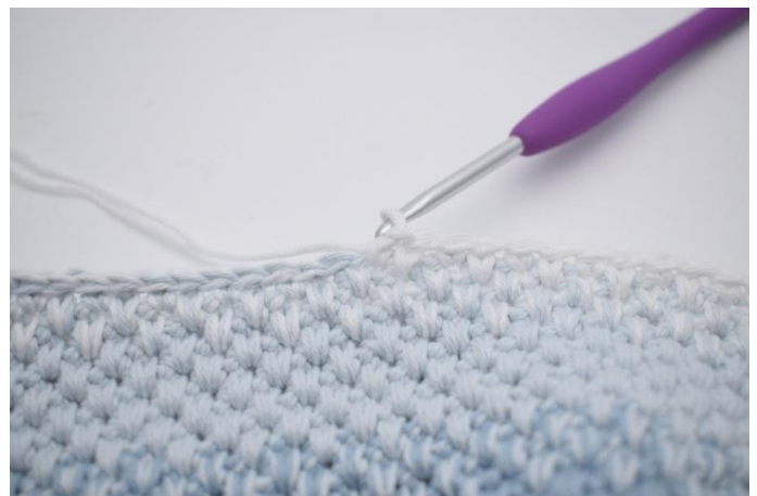
4. Nå hekles det skiftevis 1 fm og 1 lfm i de neste 33 m. (Det hekles 1 fm i siste m.)