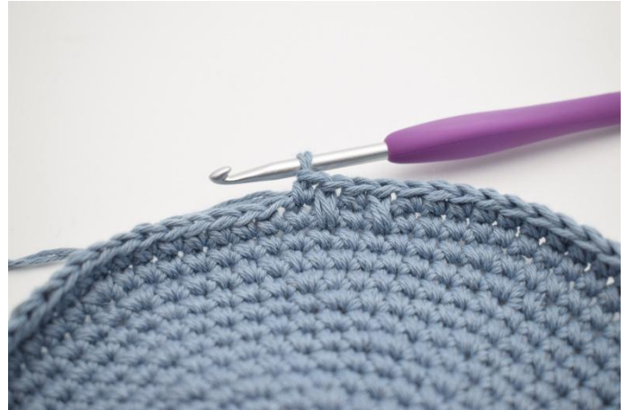
8. Slik. Dette gjentas omgangen rundt.