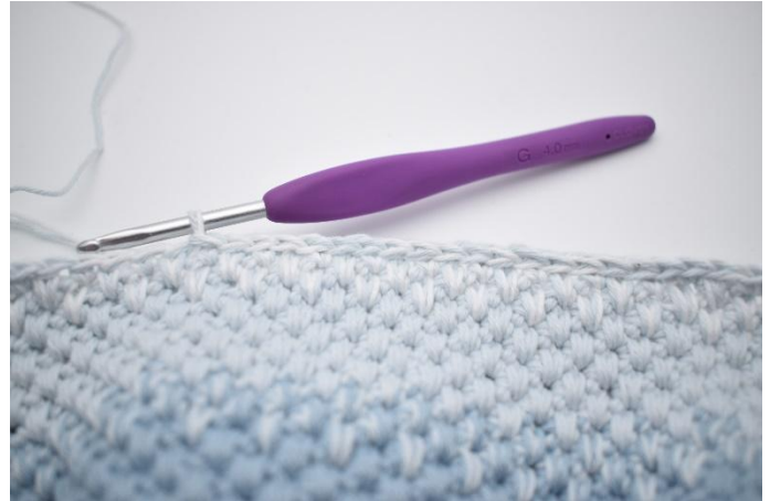
2. Hekle km i de neste 18 m.