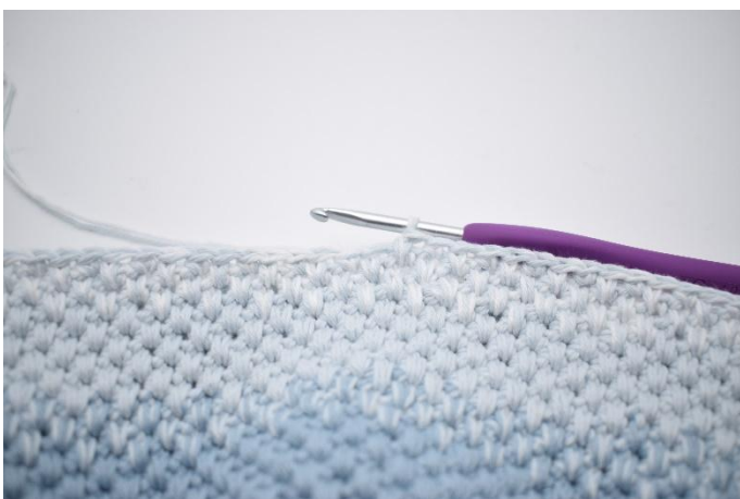
5. Hekle skiftevis fm og lfm i de siste 16 m.