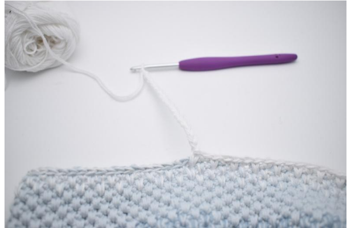
2. Lag 18 lm.