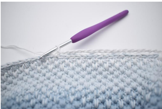
3. Hopp over over de 18 km.