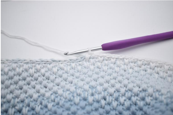
1. Hekle skiftevis 1 fm og 1 lfm i de neste 16 m.

2. Skift nå farge slik at det kun hekles med farge 4. Hekle skiftevis 1 fm og 1 lfm i de neste 16 m. Lag 18 lm, og hopp over de 18 km. Nå hekles det skiftevis 1 fm og 1 lfm i de neste 33 m. (Det hekles 1 fm i siste m.) Lag 18 lm, og hopp over de 18 km. Hekle skiftevis lfm og fm i de siste 16 m.