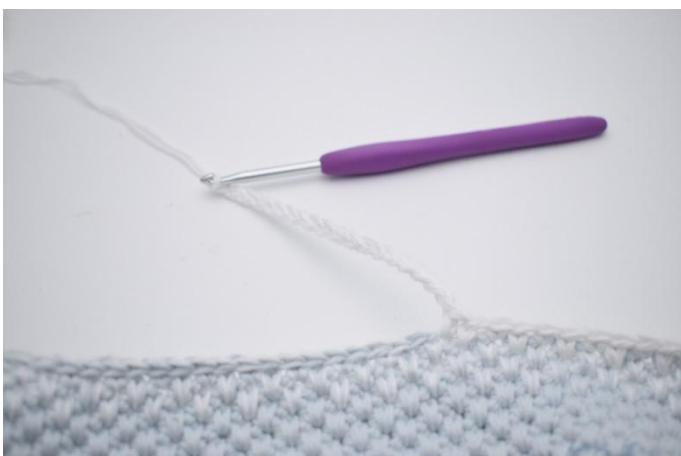
5. Lag 18 lm,