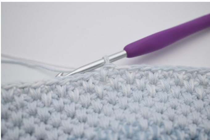
3. Nå hekles det skiftevis 1 lfm og 1 fm i de neste 33m. (Det hekles 1 lfm i siste m.)