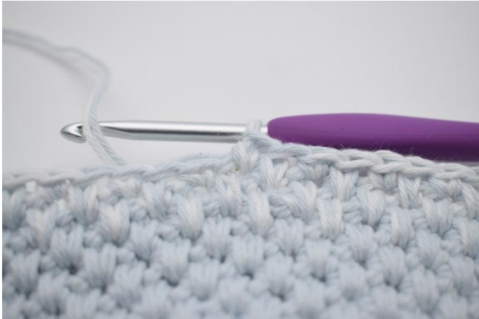
1. Hekle skiftevis 1 lfm og 1 fm i de neste 16 m.