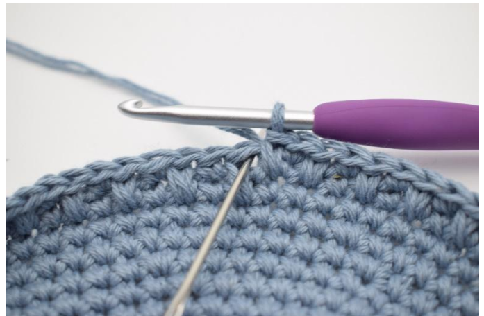
10. Når du skal hekle din neste omgang, hekles det motsatt, slik at du starter omgangen med 1 fm, etterfulgt av 1 lfm. Dvs. at du hekler fm i lfm fra forrige omgang, og lfm i fm fra forrige omgang. Slik gjentas de 2 omganger som beskrevet i oppskriften.