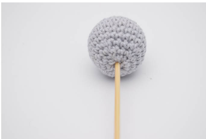
5. Sett blomsterpinnen/spydet i kulen