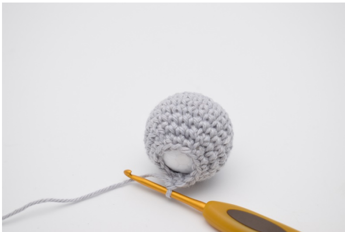
3. Det hekles nå videre omkring den.