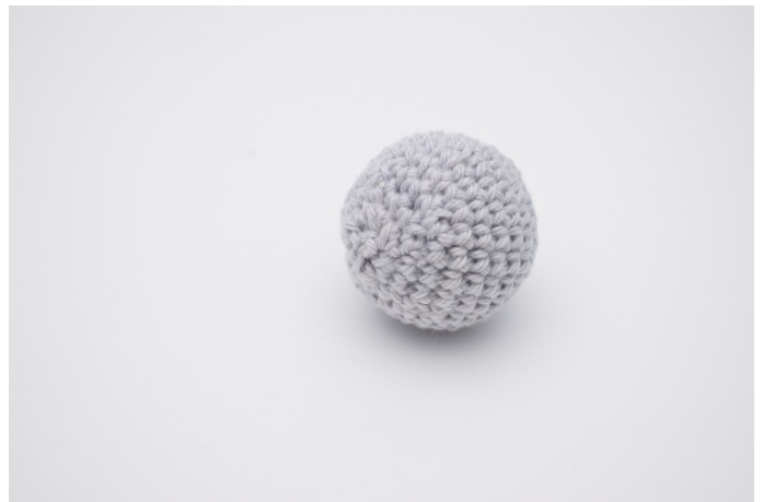
4. Sy hullet sammen, og fest tråder.