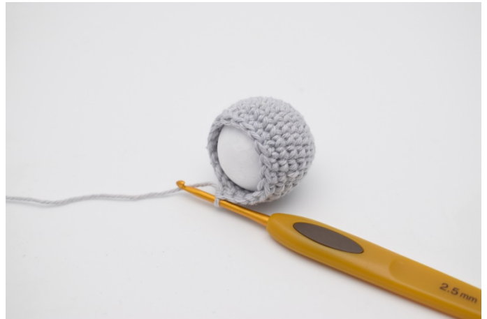
2. settes kulen i.