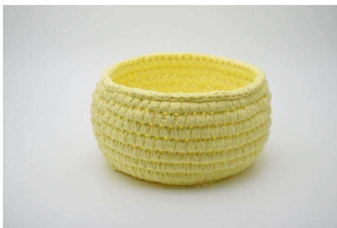
16. Gjenta omgangene som beskrevet i oppskriften. Avslutt med en omgang kjm.