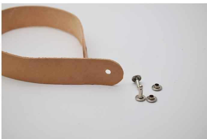
17. Klipp skinnremmen din til og rund evt. hjørnene av. Lag hull til nittene med en hulltang