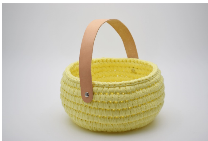
18. Sett hanken på kurven med nittene.