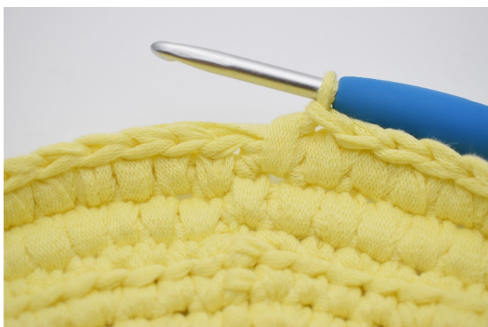
15. Gjenta med dfm omgangen rundt.