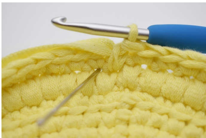
13. Neste dfm hekles på den samme måten. Nålen her markerer at det igjen hekles i masken under den du vanligvis ville hekle den neste masken i.