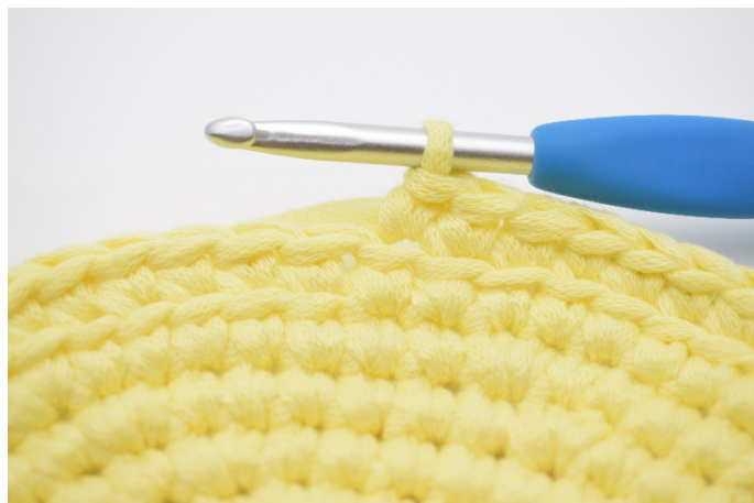
4. Hekle fm i bmb omgangen rundt.