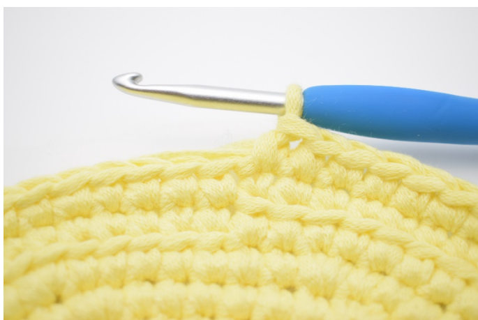
5. Hekle 1 omgang med fm.