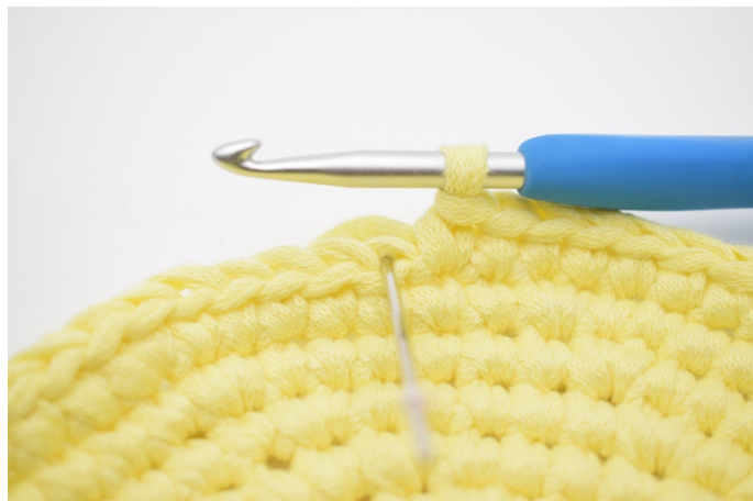
2. Nå hekles 1 omgang fm i bmb. Det er den buen som nålen her markerer.