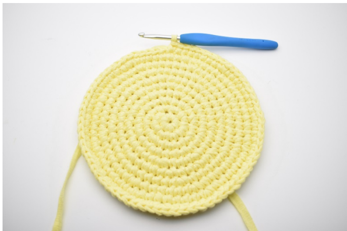
1. Her er bunnen nettopp heklet ferdig.