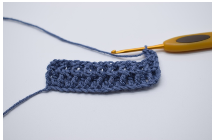
10. Nå hekles det 1 brstv om stolpen på den forrige rekken.