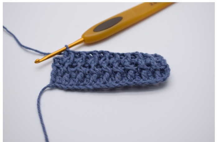
12. Gjenta vekselvis brstv og frstv rekken ut. I snumasken hekles 1 vanlig stv. Slik gjentas rekkene til du har oppnådd den ønskede størrelsen.