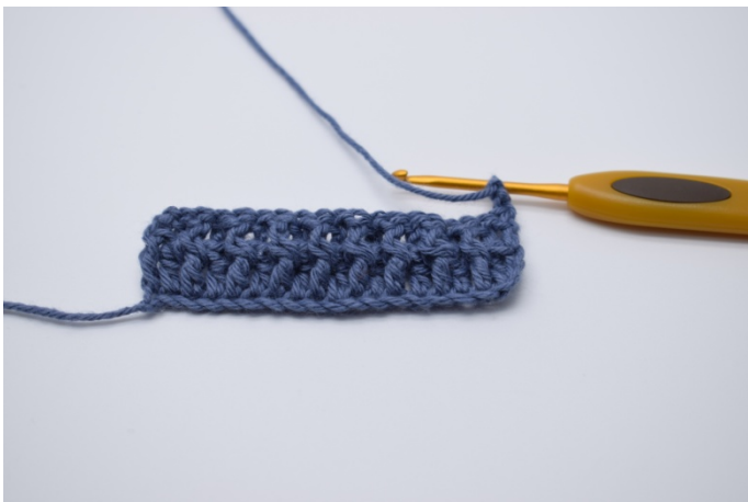
9. Snu arbeidet ditt med 2 lm. De erstatter den første vanlige stv.