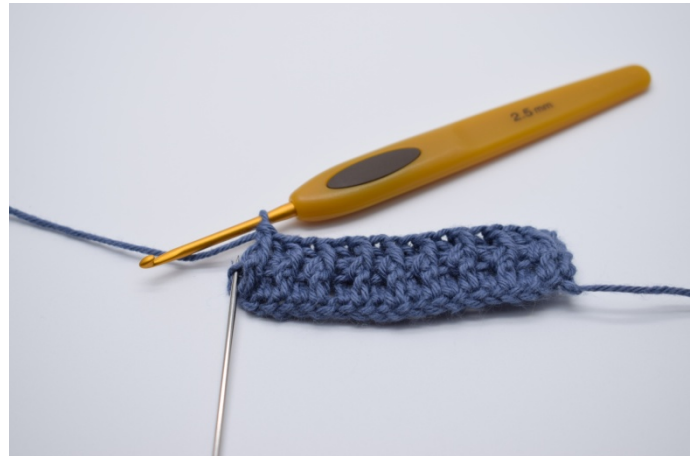
8. Nå gjentas vekselvis frstv og brstv rekken ut. I snumaskene hekles 1 vanlig stv.