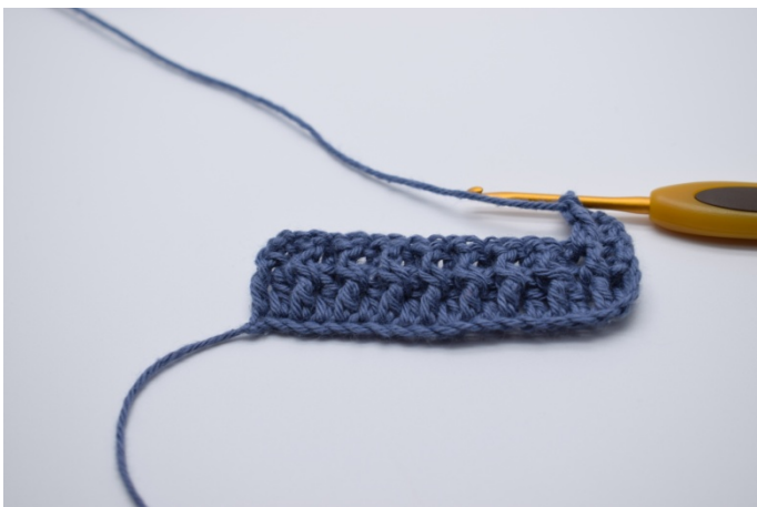
11. Om den neste stolpen hekles 1 frstv.