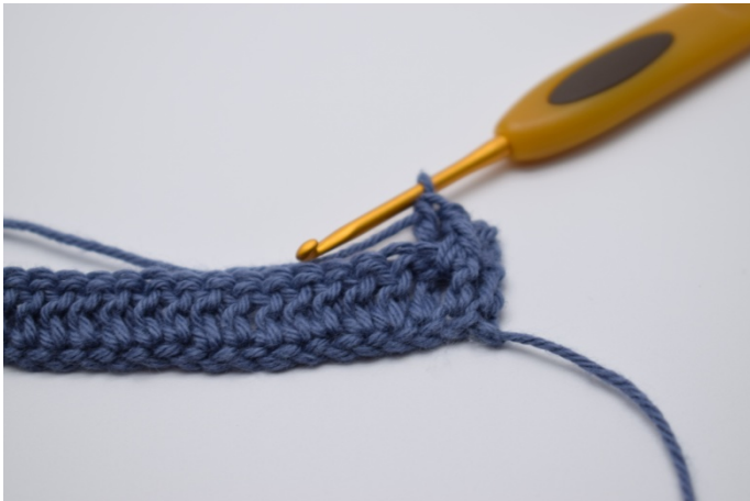
7. Kast garnet på pinnen og ferdiggjør staven din som vanlig. Det er nå heklet 1 brstv.