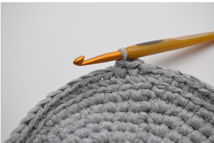
7. Gjenta i neste maskens "V".