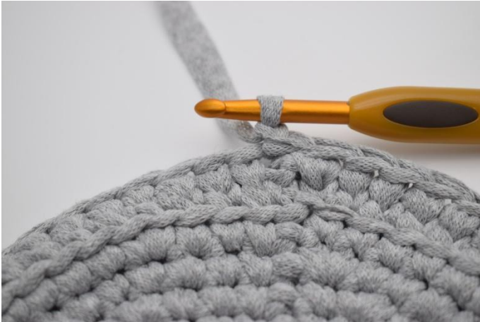
9. Lag 1 lm.