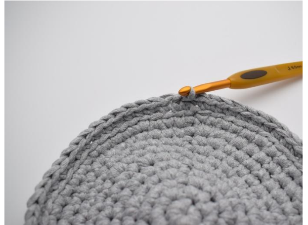
4. Avslutt omgangen med 1 km