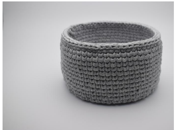
12. Avslutt kurven med en omgang km.