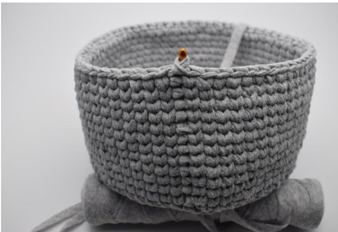
11. Slik gjentas omgangene til du har den ønskede høyde på din kurv.