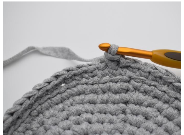
6. Her er den første ks heklet ned i "v'en".