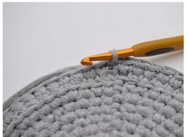
8. Gjenta omgangen rundt, og avslutt med 1 km.