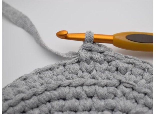
10. Hekle ks i alle masker rundt.