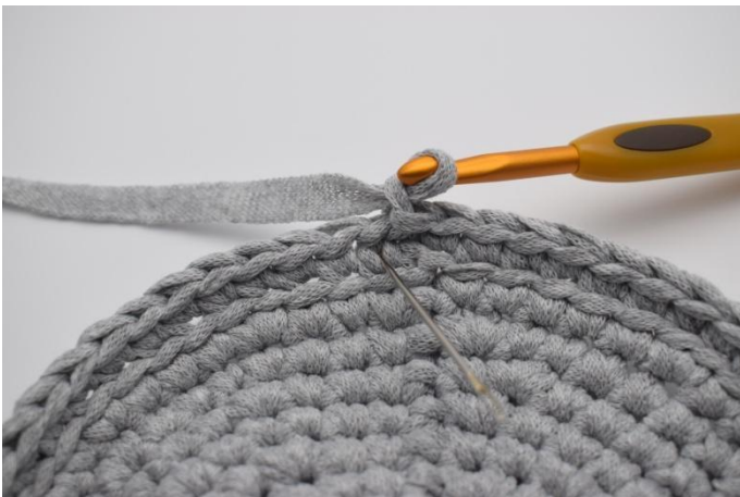
5. Lag 1 lm. Nå hekles det ks. Ks er alm. fm, men som hekles i "v'en" under maskens ledd.