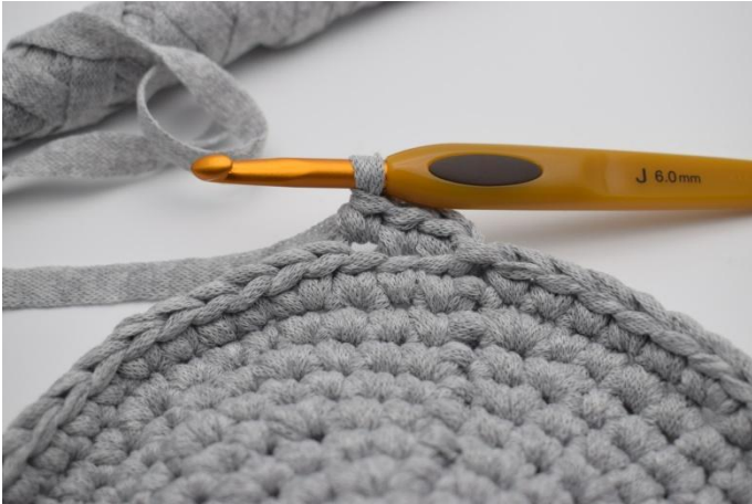
3. Hekle fm i bml omgangen rundt.