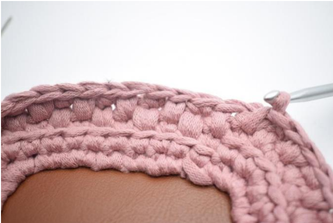
7. Gjenta omgangen rundt og avslutt med 1 lfm.