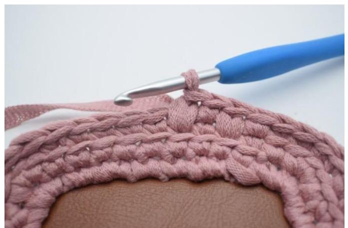
6. Slik. Gjenta nå *1 fm, 1 lfm* omgangen rundt.