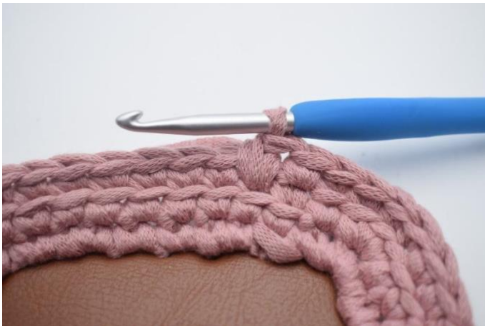
3. Slik. Det er nå heklet 1 fm og 1 lfm.