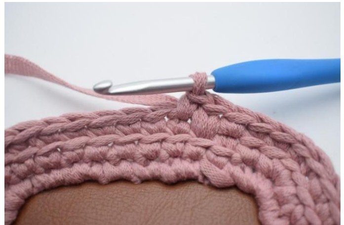
4. Hekle 1 fm i neste m.