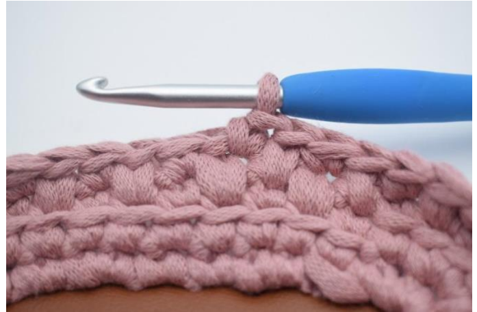
6. Hekle en fm i neste.