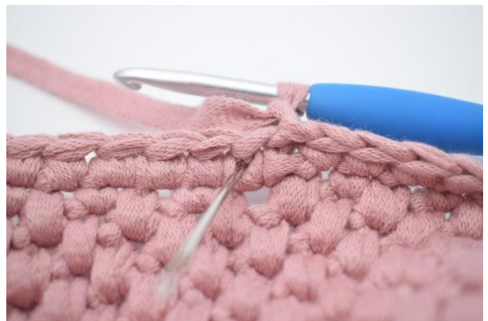
2. Det skal nå hekles ks (knit stitch). Lag 1 lm. Hekle 1 fm i v'et på masken (under) fra forrige omgang. Nålen over markerer her hvor du skal hekle din fm.