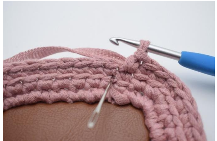
2. I neste m hekles 1 lfm. Nålen over markerer hvor din lfm skal hekles.