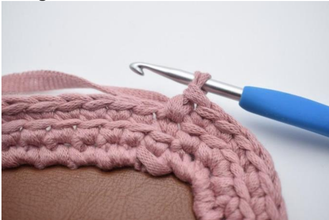
1. Hekle 1 fm i første m.