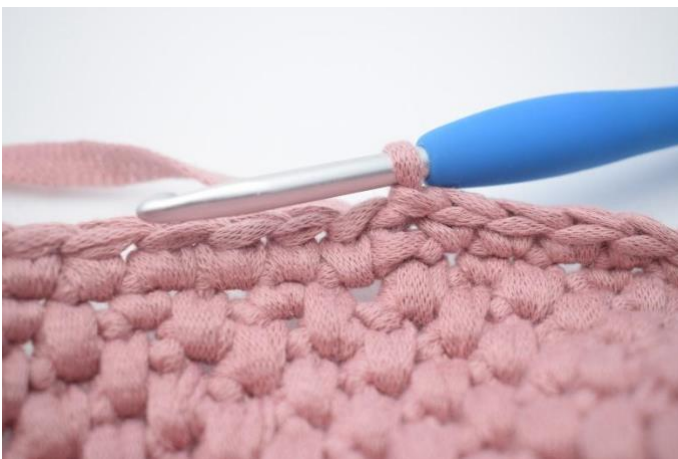
1. Lag 1 lm. Hekle 1 fm hele veien rundt, og avslutt med 1 km.