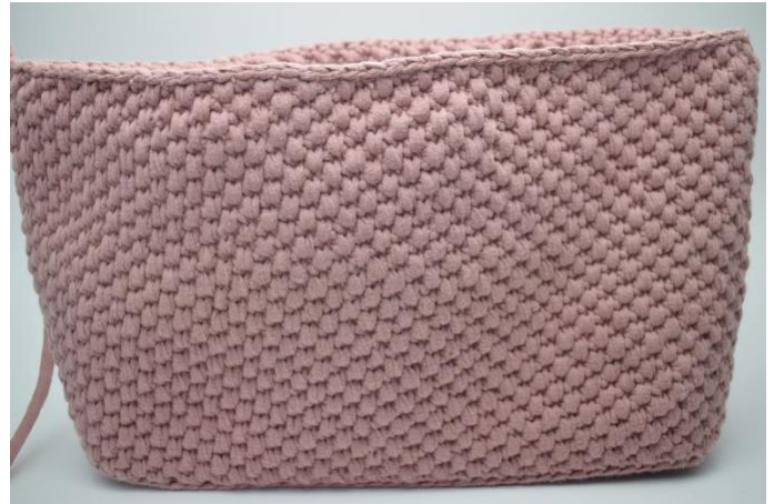
8. Gjenta disse 2 omgangene i alt 16 ganger eller til du har den ønskede høyde på din veske. Avslutt siste omgang med 1 km.