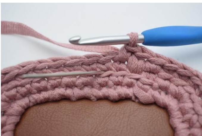
5. Hekle 1 lfm i neste m. Nålen over markerer hvor din lfm skal hekles.