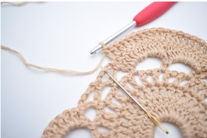
7. Lag 1 fm i lm-buen ved siden av. Nålen markerer hvor din fm skal hekles.