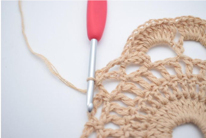
11. Lag 4 lm, og hekle 1 fm i neste lm-bue.