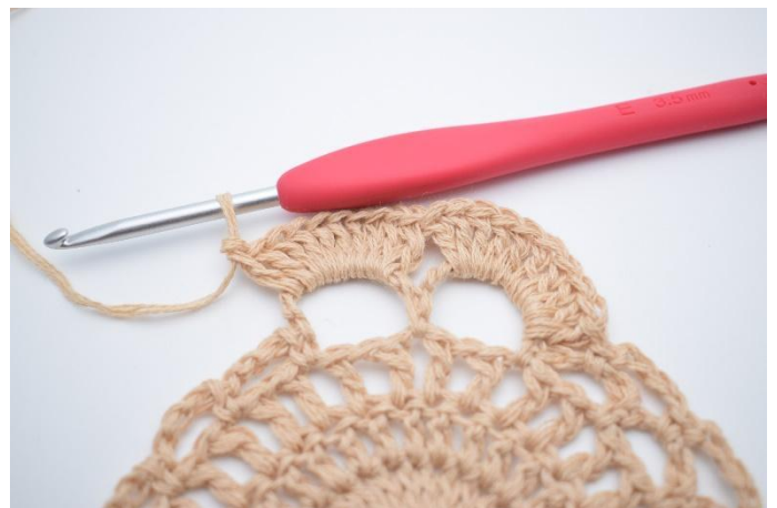
8. Hekle 10 stv i den neste store lm-bue.