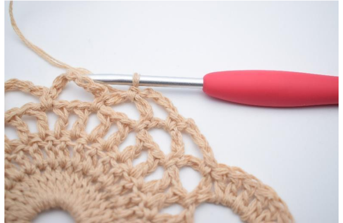
6. Lag 4 lm, og hekle 1 fm i neste lm-bue.