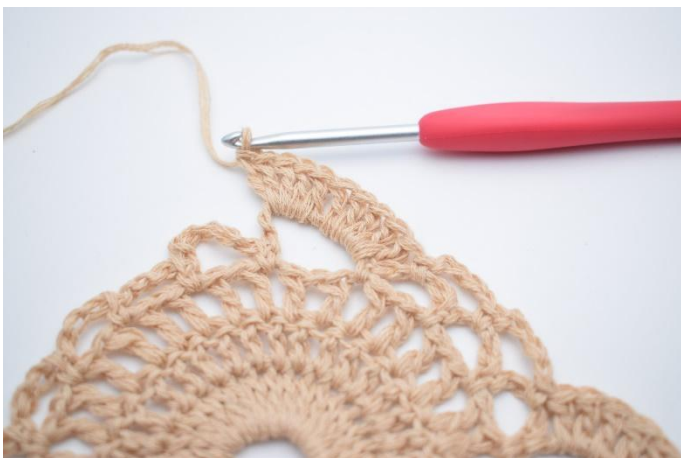
7. Hekle 10 stv i den store lm-buen.