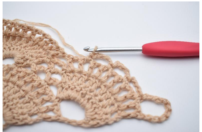
21. Gjenta 1 gang til slik at du har 3 små lm-buer.