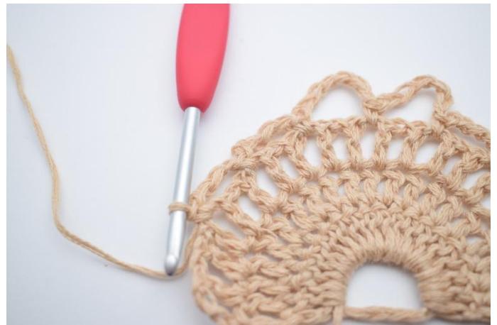
10. Lag 4 lm, hopp over 1 lm-mellomrom og hekle 1 fm i neste lm-mellomrom.