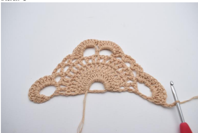
1. Snu ditt arbeid med 3 lm (som erstatter 1 stv).