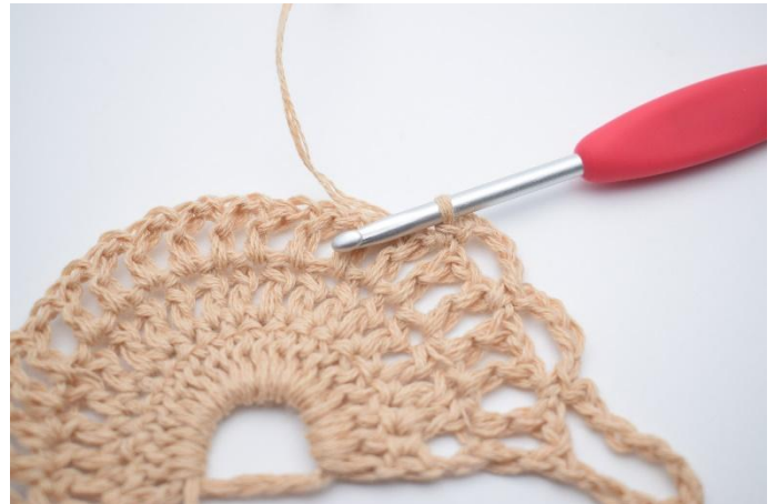
5. Lag 4 lm, hopp over 1 lm-mellomrom og hekle 1 fm i neste lm-mellomrom.