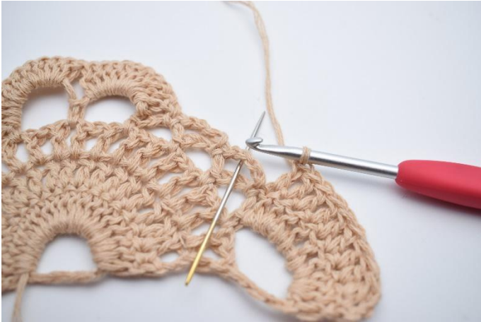
3. Lag 1 fm i lm-buen ved siden av. Nålen markerer hvor din fm skal hekles.