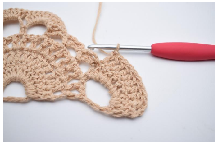
2. Hekle 1 stv i alle stv rundt den store lm-buen. (=10 stv)