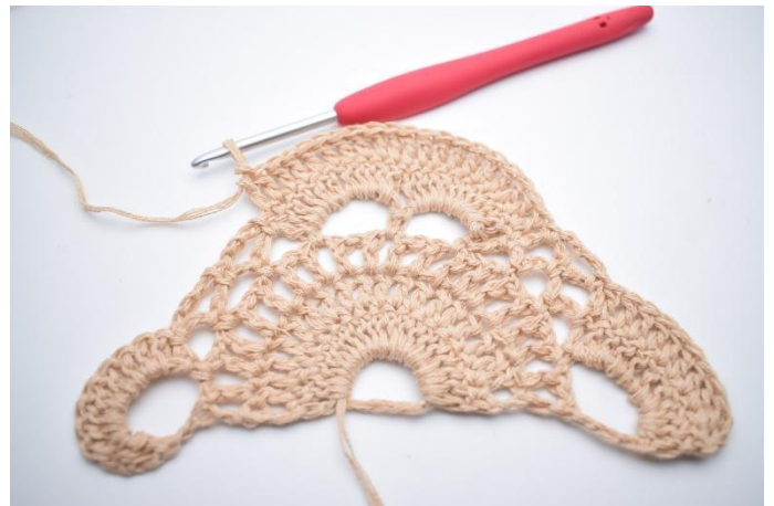
6. Hekle 1 stv i alle stv rundt de 2 store lm-buene. (=20 stv)