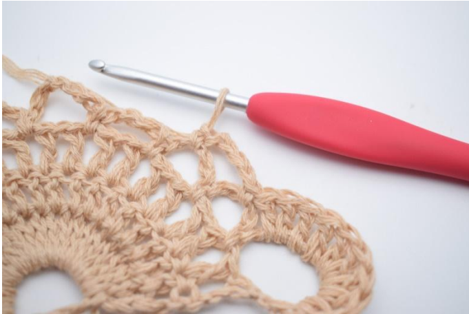
5. Lag 4 lm, og hekle 1 fm i neste lm-bue.