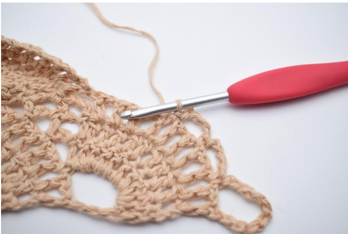
20. Lag 4 lm, hopp over 1 lm-mellomrom og hekle 1 fm i neste lm-mellomrom.