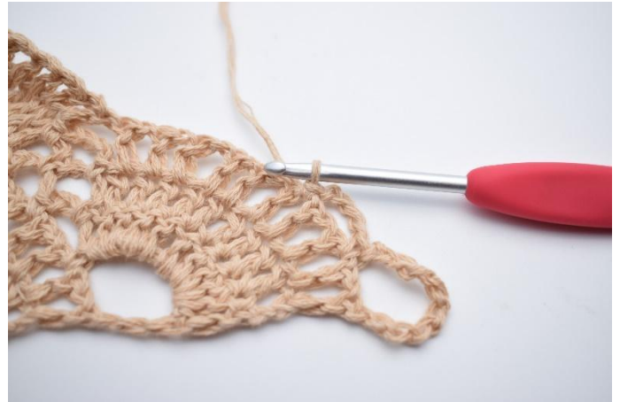
19. Lag 4 lm, og hopp over 1 lm-mellomrom, og hekle 1 fm i neste lm-mellomrom.