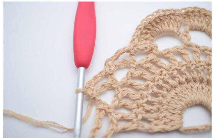
12. Lag 4 lm, og hekle 1 fm i neste lm-bue.