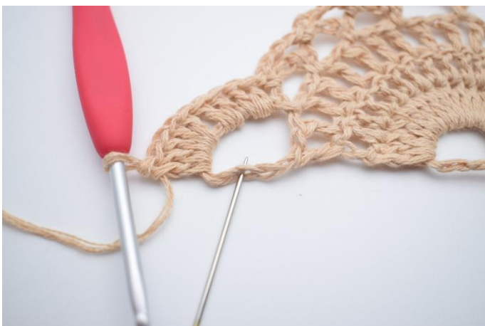
13. Hekle 10 stv i den siste store lm-buen. Den siste stv hekles i 3 lm der som nålen markerer.