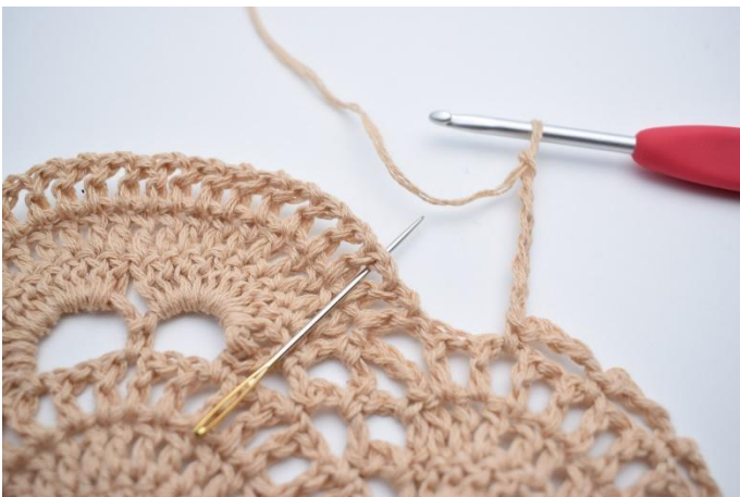
22. Lag 7 lm, og hopp over 2 lm-mellomrom. Hekle 1 fm i neste lm-mellomrom. Nålen markerer hvor din fm skal hekles.