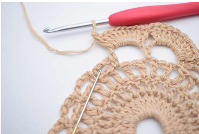
9. Lag 1 fm i lm-buen ved siden av. Nålen markerer hvor du skal hekle din fm.