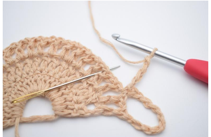
3. Lag 4 lm, og Hopp over 1 lm-mellomrom , og hekle 1 fm i neste lm-mellomrom. Nålen markerer hvor det skal hekles 1 fm.