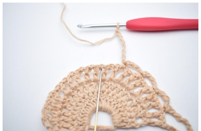
Lag 7 lm, Hopp over 1 lm-mellomrom og hekle 1 fm i neste lm-mellomrom.