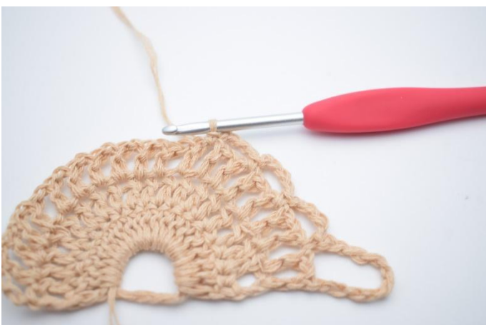
6. Gjenta 1 gang til slik at du har 3 små lm-buer.