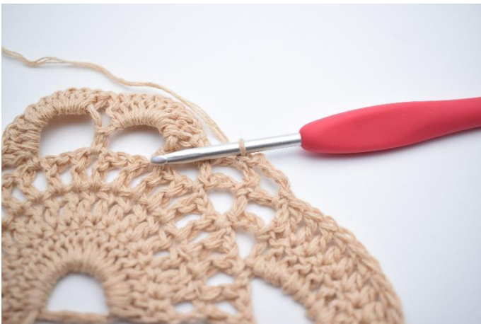
5. Lag 4 lm, og hekle 1 fm i neste lm-bue.