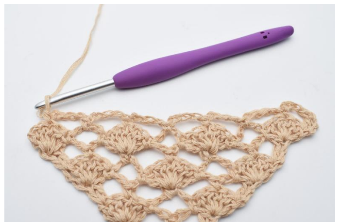
10. Gjenta dette til siste vifte på raden.