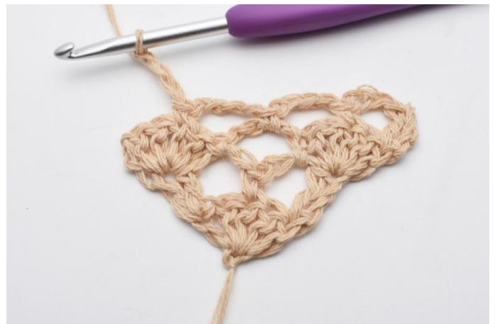
10. Lag 3 lm.