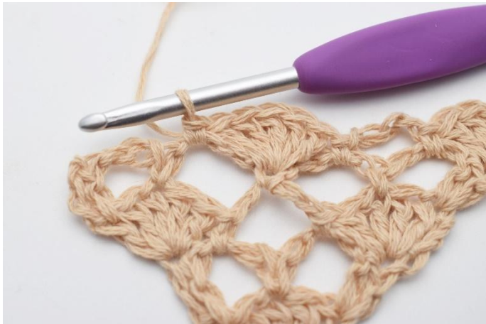
11. 1 fm.