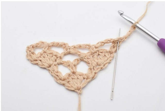
1. Snu arbeidet med 3 lm. I den første maske (som nålen markerer)