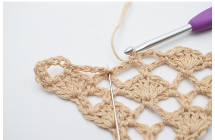
14. Nå hekles det 1 vifte (5 stav) i fm mellom de 2 neste lm-buene (nålen markerer den fm som viften skal hekles i)