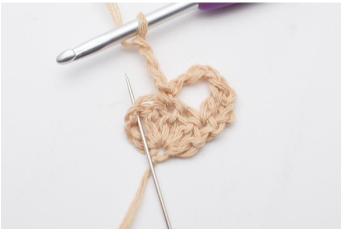
7. og hekle 2 stv i den siste stv-masken i viften på forrige rad (der nålen markerer)