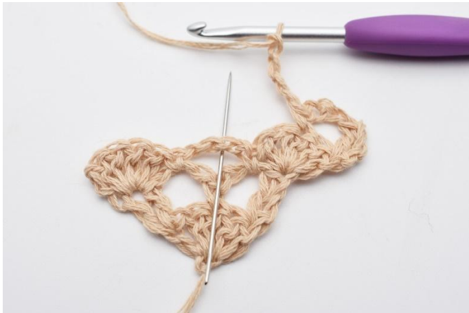
5. Lag 4 lm og en fm rundt lmbuen under.