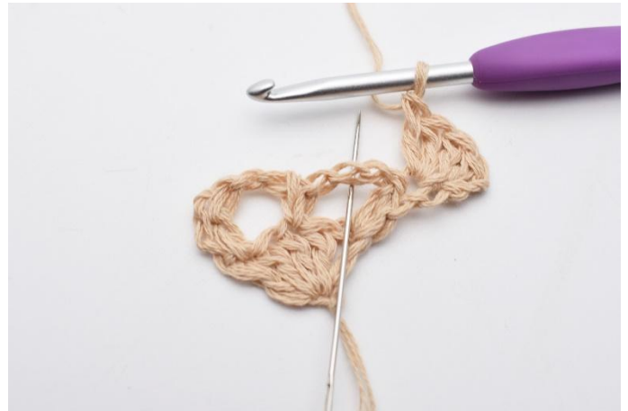
4. I lm-buen (der nålen markerer),