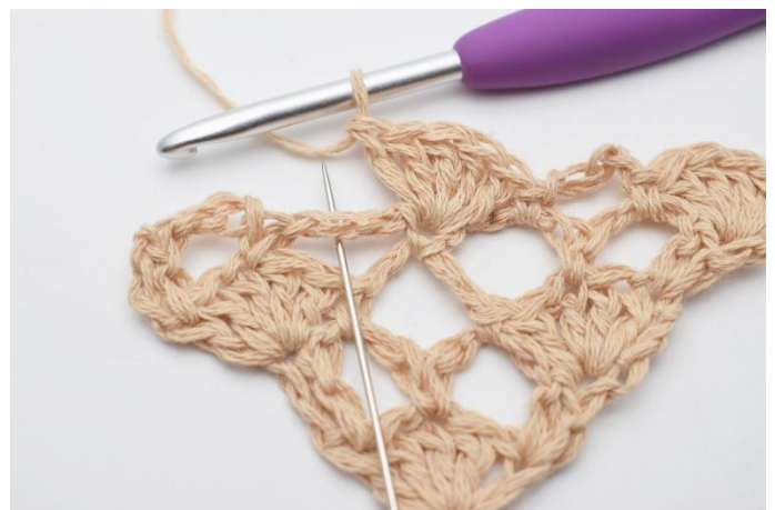
10. I den neste lm-buen, hekles