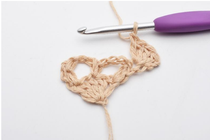
3. Slik. Det er nå heklet 1 vifte med 5 stv-masker, der hvor den første stv blir erstattet med lm.