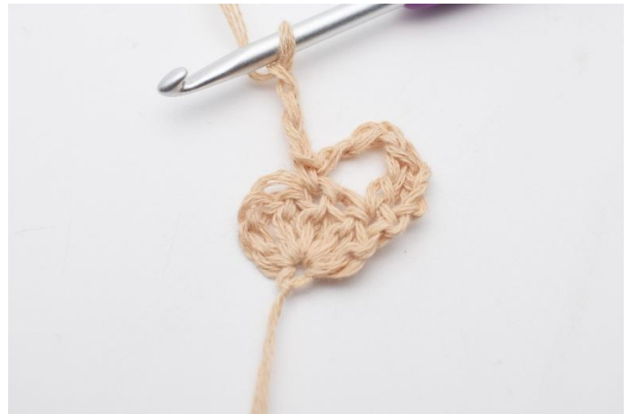
6. Lag 3 lm,