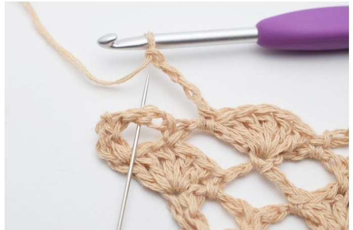
12. Lag 4 lm og hekle 1 fm i neste lm-bue.