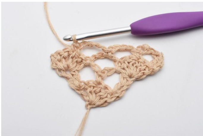
9. 1 fm.