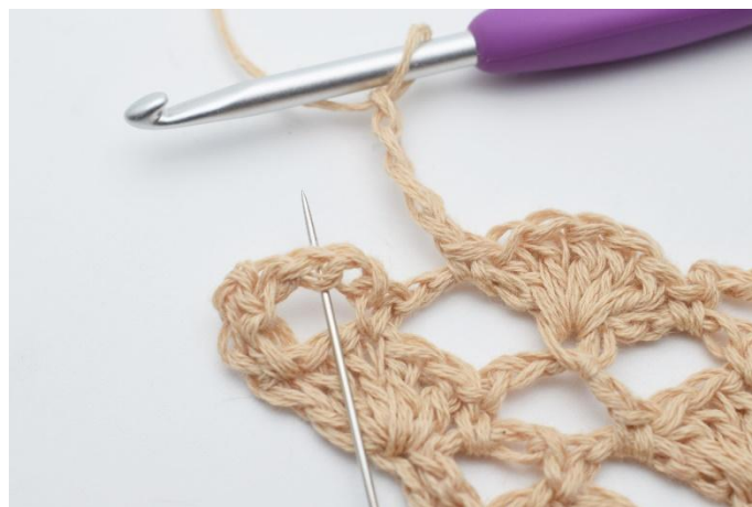
18. Lag 4 lm. I neste lm-bue, hekles