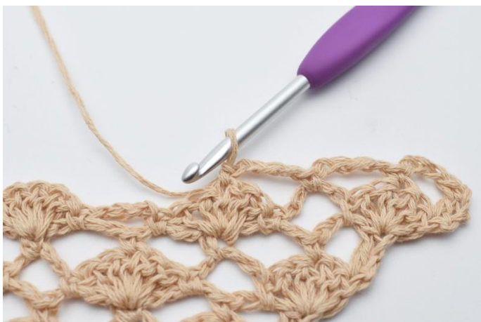
9. 1 fm