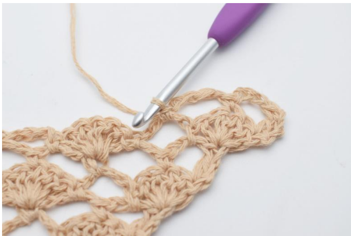
7. 1 fm.