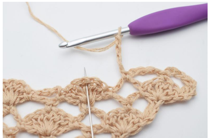
8. Lag 4 lm og i den midterste stv-maske i viften under, hekles.