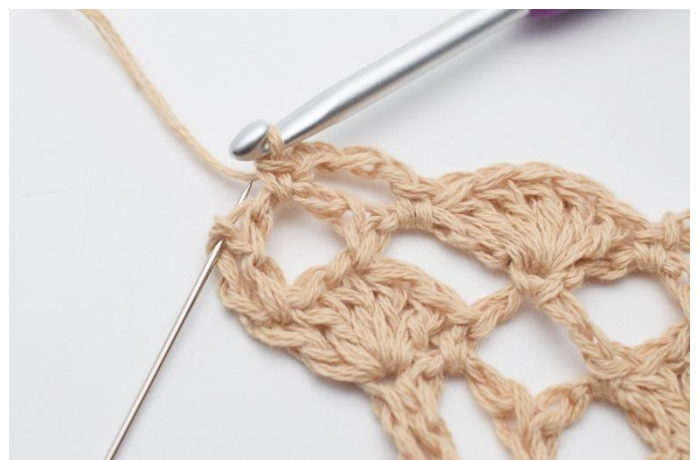
14. I den siste masken, (der nålen markerer)