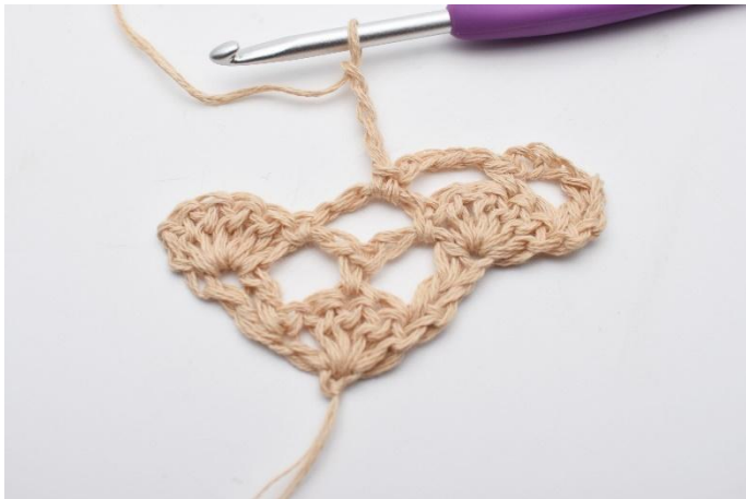
7. Lag 4 lm.