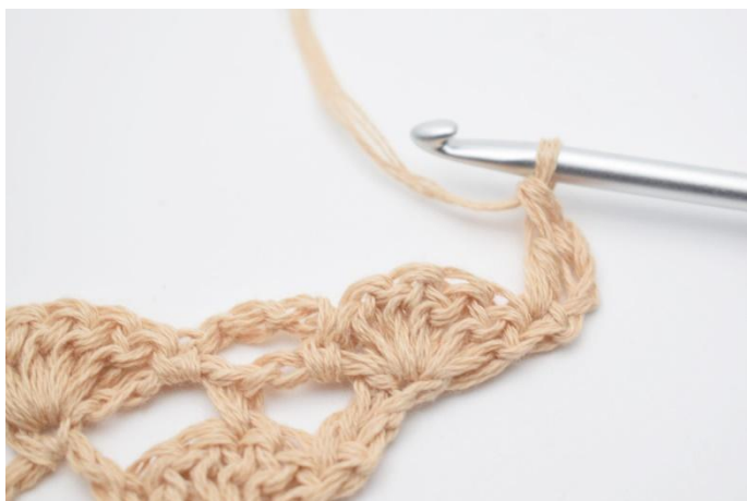
3. hekles 1 stv.