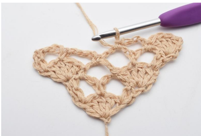
7. 1 fm.