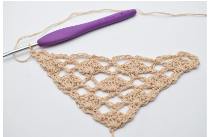
12. hekles 2 stv.

Fortsett sjalet / mønsteret ved å gjenta rad 7 og 8 vekselvis til nøstet er brukt opp.