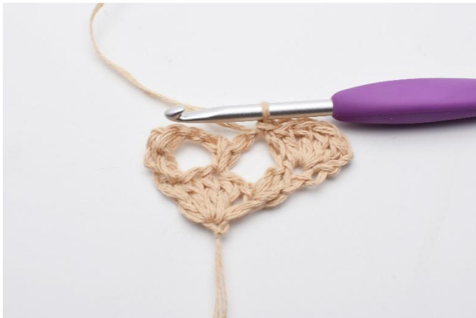
5. hekles det 1 fm.