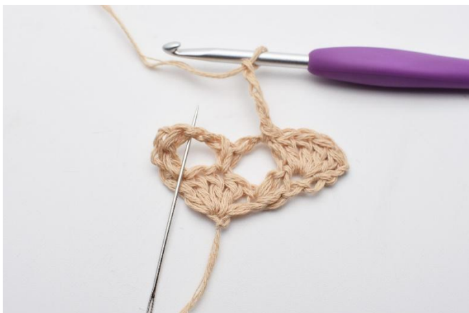
7. I den neste lm-bue,