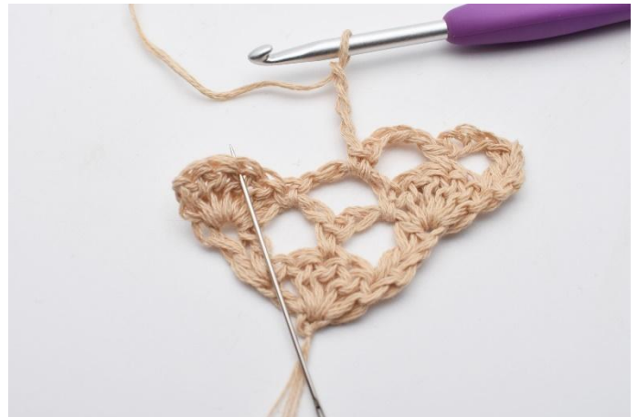
8. I den midterste stv i viften (5 stv-maskene fra forrige rad),