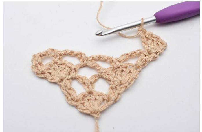
2. hekle 4 stv. Det er nå heklet 1 vifte med 5 stv- masker, hvor den første stv er erstattet av lm.