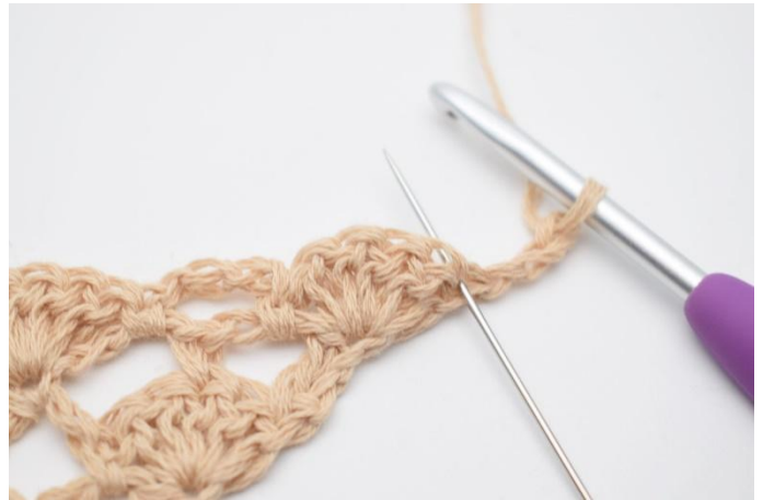
2. I den første masken (der nålen markerer)