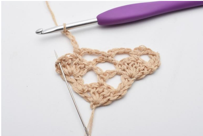
11. I den siste masken (der nålen markerer), hekles 2 st.