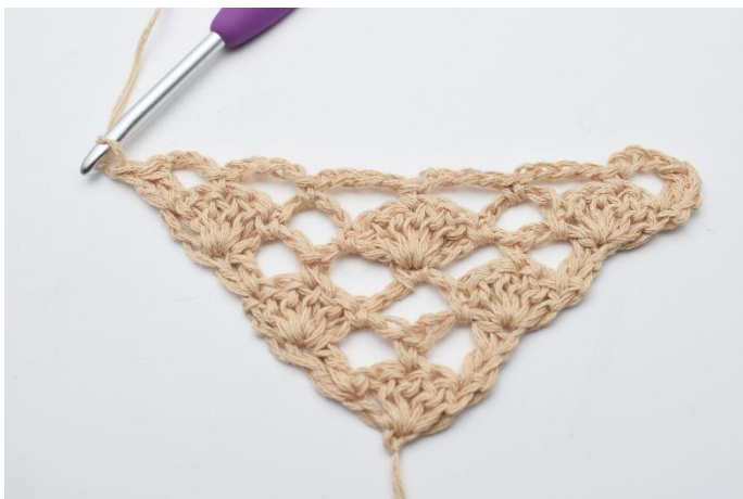
15. hekles 2 stv.