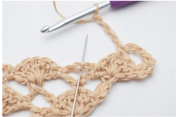
6. Lag 4 lm. I den neste lm-buen, hekles