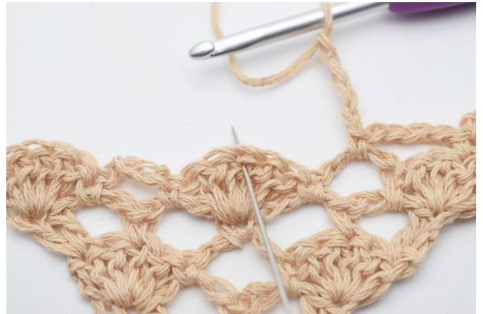
8. Lag 4 lm og hekle 1 fm i den midterste stv i viften under, (der hvor nålen markerer)