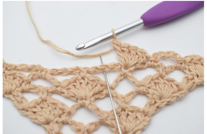
10. I den neste lm-buen, hekles