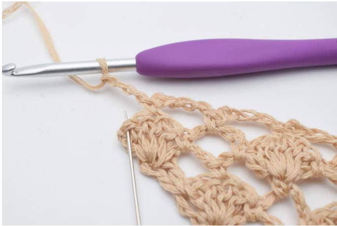
11. Lag 3 lm, og i den siste masken (som nålen markerer)