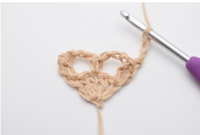
1. Snu arbeidet med 3 lm.