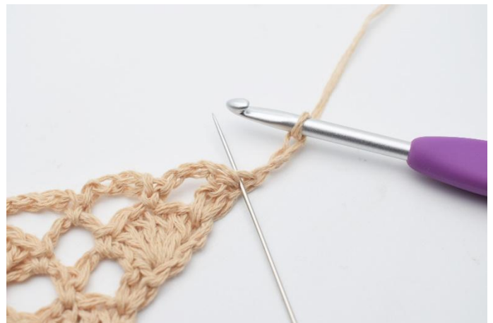
2. I den første maske (der nålen markerer)