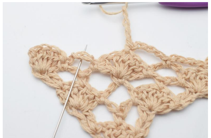
10. Lag 4 lm og en fm rundt lm-buen under.