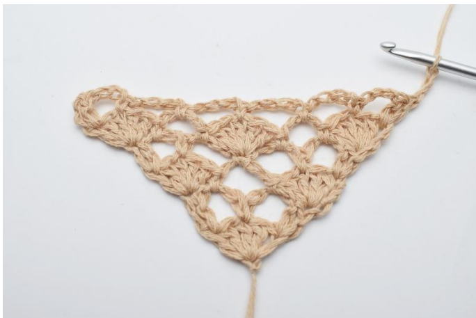
1. Snu arbeidet med 3 lm.