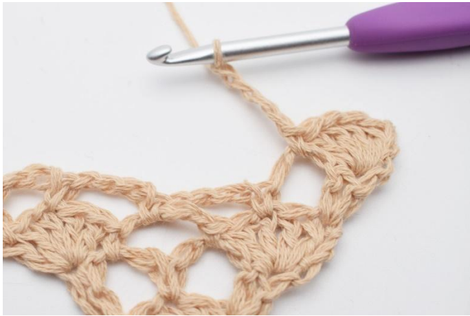
5. Lag 4 lm.