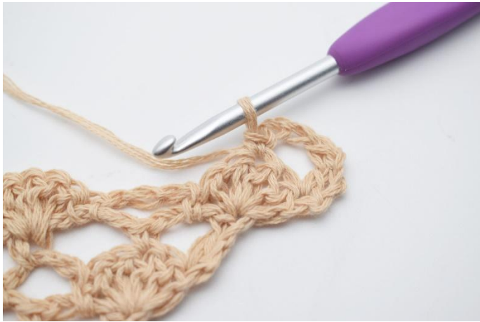
5. 1 fm