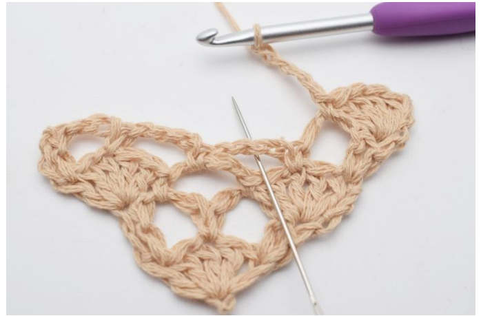
6. I den neste lm-buen,