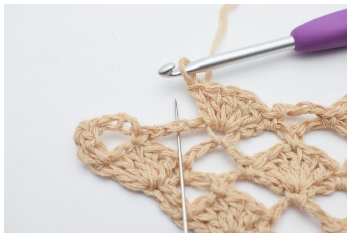
16. I den neste lm-buen hekles