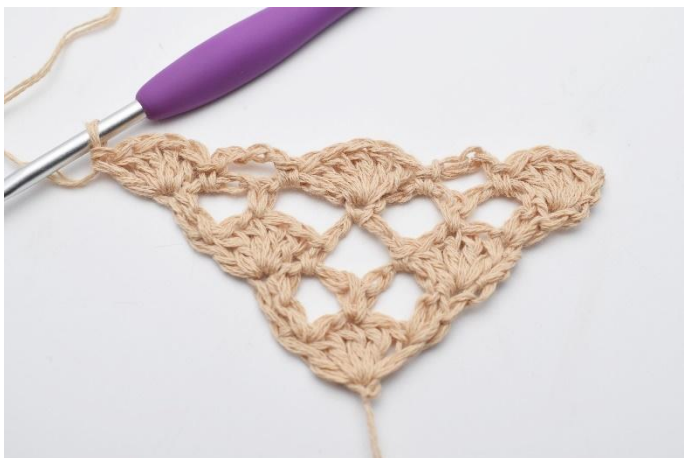
15. hekles 1 vifte med 5 stv-masker.