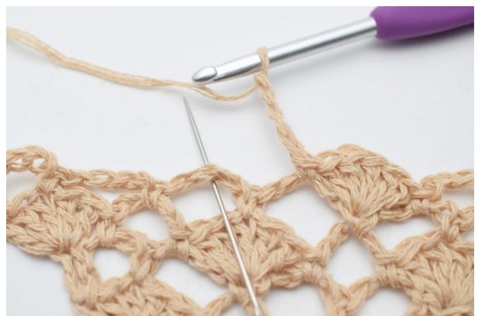
12. Lag 4 lm. I neste lm-bue, hekles