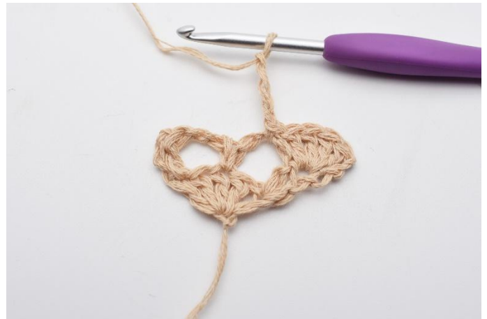
6. Lag 4 lm.