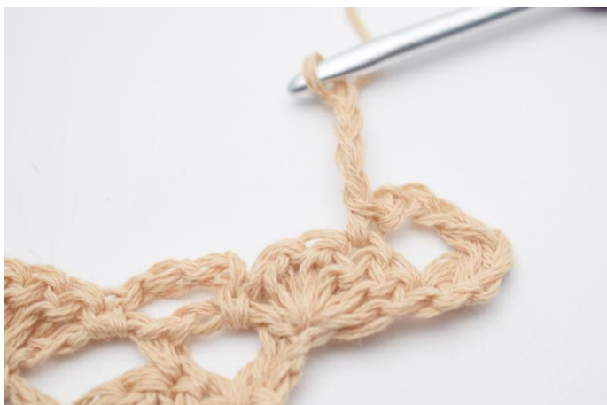
5. Lag lm 4