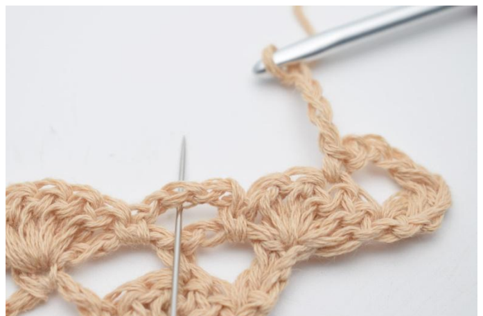
6. hekle 1 fm rundt lm-buen.