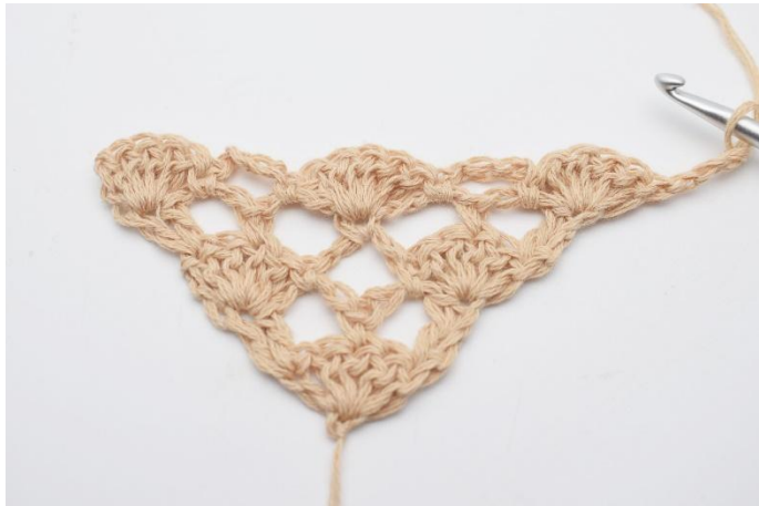
1. Snu arbeidet med 3 lm.