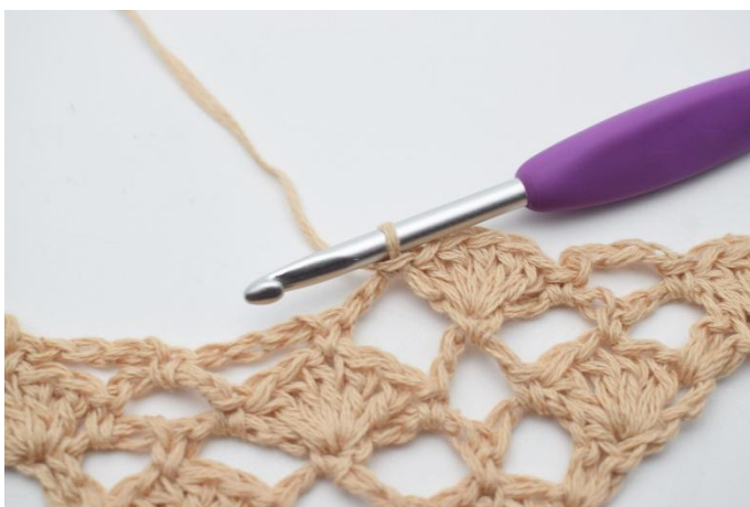
11. 1 fm.