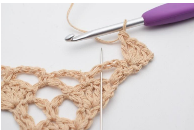
3. I lm-buen under (der nålen markerer) hekle 1 fm.