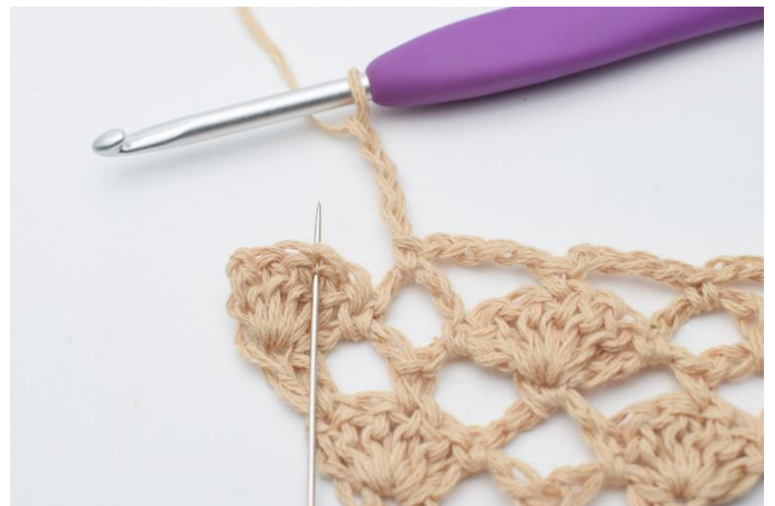
12. Lag 4 lm og hekle 1 fm i den midterste stv i viften under (der nålen markerer)