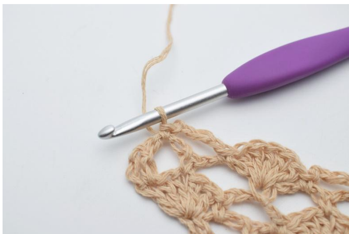
19. 1 fm.