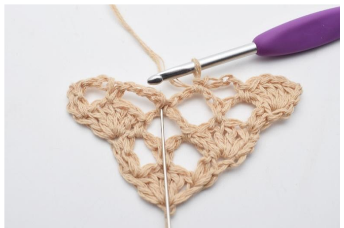
8. Nå hekles det 1 vifte (5 stv) i fm mellom de neste 2 lm-buene (der nålen markerer).