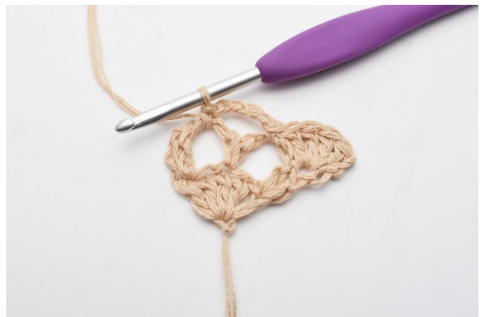
8. 1 fm.