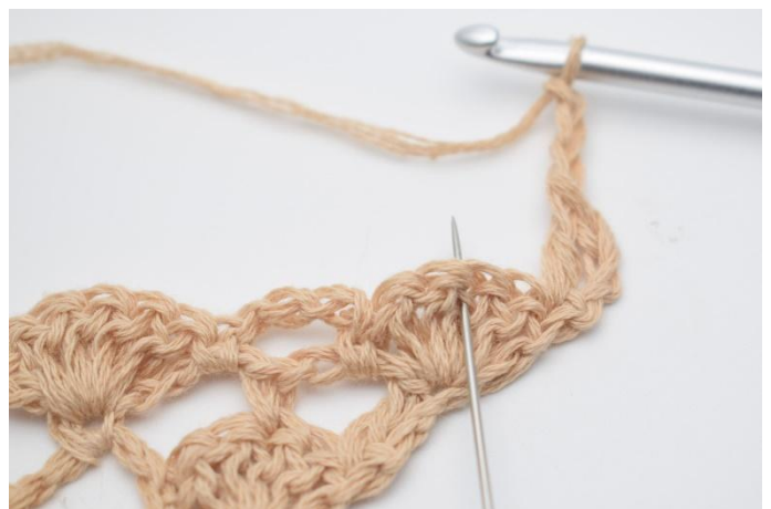
4. Lag 3 lm, og hekle 1 fm i den midterste stav i viften under (der nålen markerer).