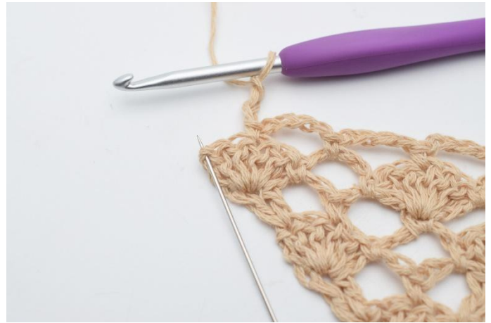
14. Lag 3 lm og i den siste masken, (som nålen markerer)