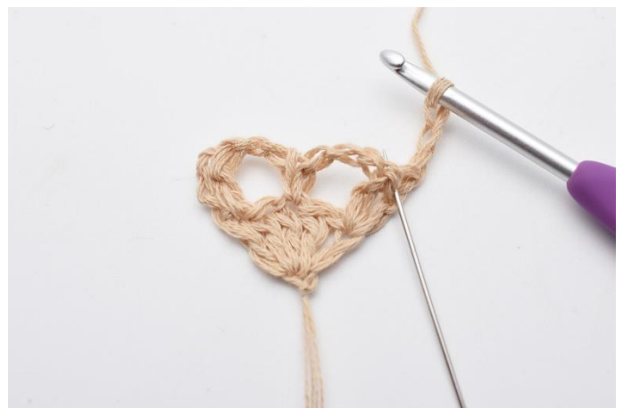
2. I den første maske (som nålen markerer) hekle 4 stv.