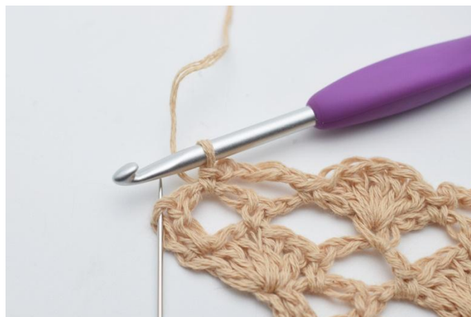
20. I den siste masken, (som nålen markerer)