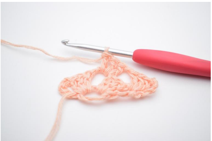
11. Hekle 1 stv maske gruppe.