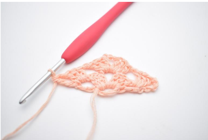
17. Det hekles 1 dblst.