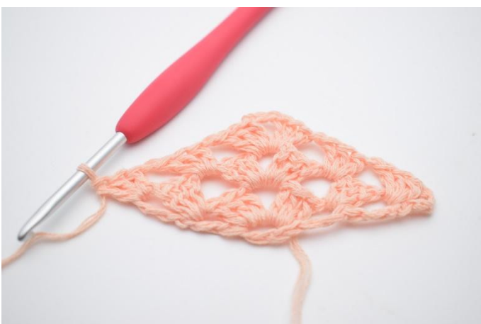
28. Hekle 1 stv maske gruppe.