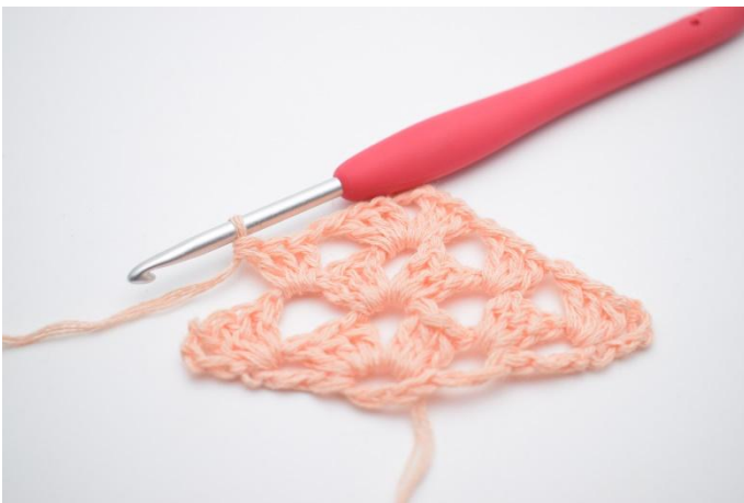
26. Hekle 1 stv maske gruppe.