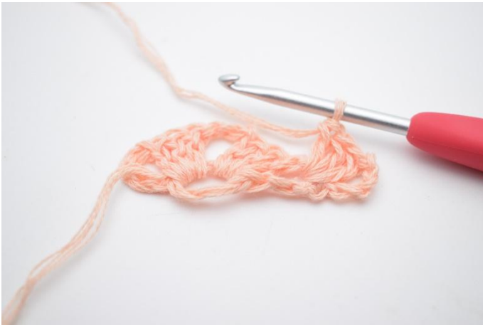
9. hekles 1 stv gruppe.