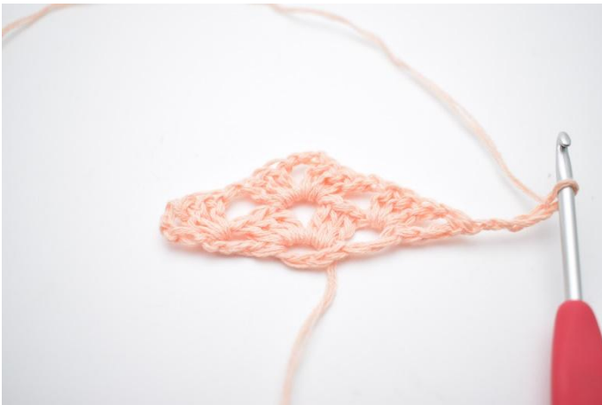
18. Snu ditt arbeid og lag 5 lm.