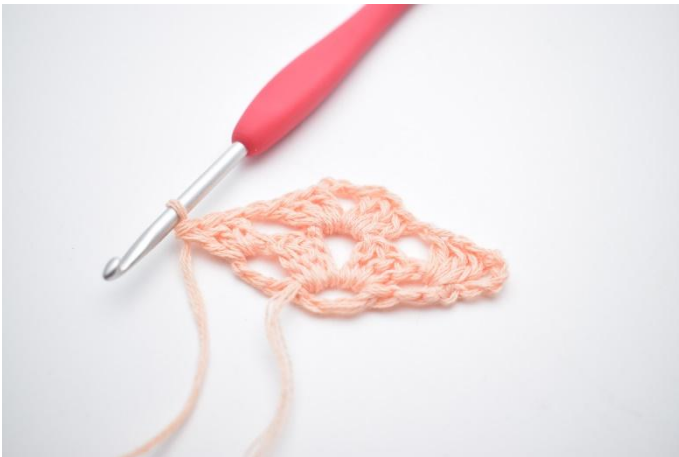
15. Hekle 1 stv maske gruppe.