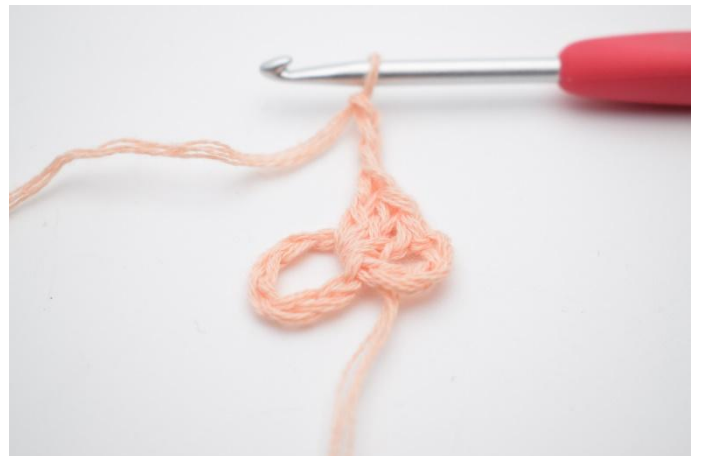
4. Lag 3 lm.