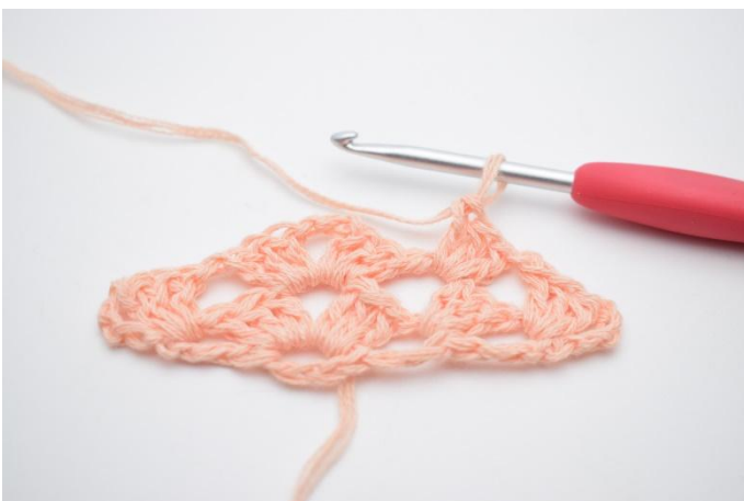
22. Hekle 1 stv maske gruppe og lag 1 lm.