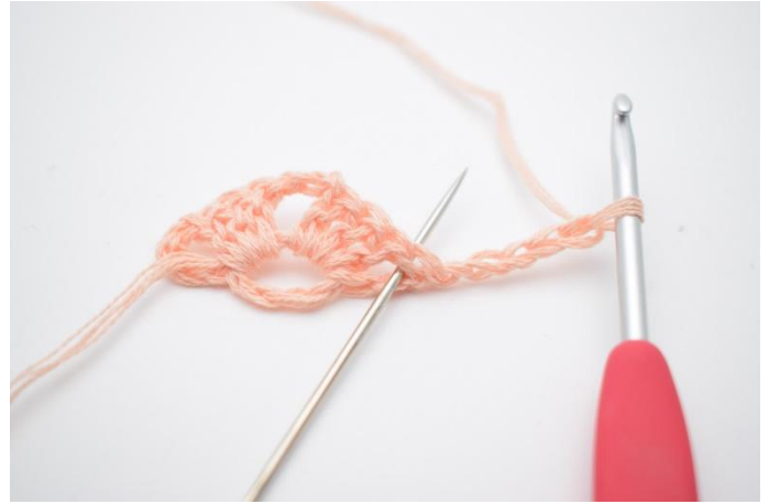
8. I mellomrommet, som nålen markerer,