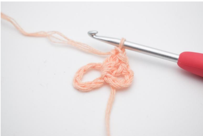
3. Hekle 3 stv ned i ringen.