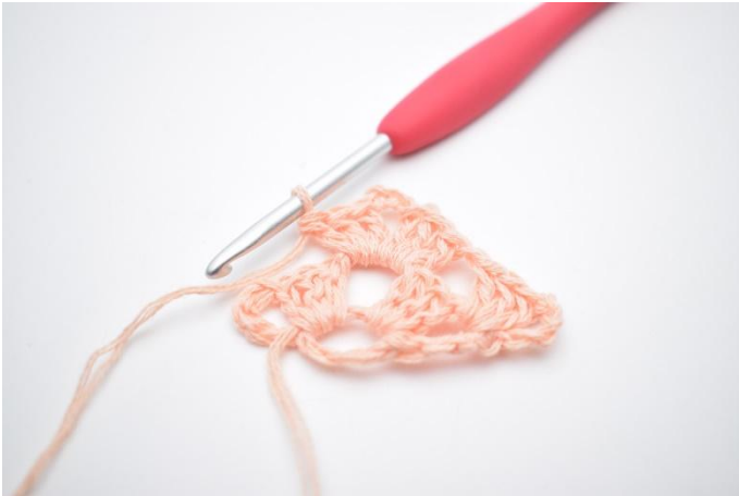
13. Hekle ennå 1 stv maske gruppe.