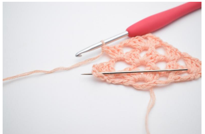
27. Lag 1 lm, og neste stv maske gruppe hekles i neste mellomrom (som nålen markerer).