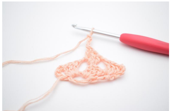
12. Lag 3 lm. Det hekles igjen ned i lm-buen