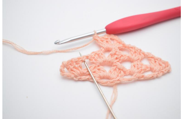
25. Lag 1 lm. Neste stv maske gruppe hekles i neste mellomrom (som nålen markerer).