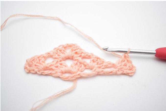
20. Hekle 1 stv maske gruppe.