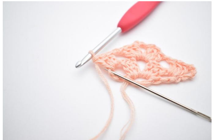
16. Lag 1 lm, og nå hekles det i 4. lm fra forrige omgang.