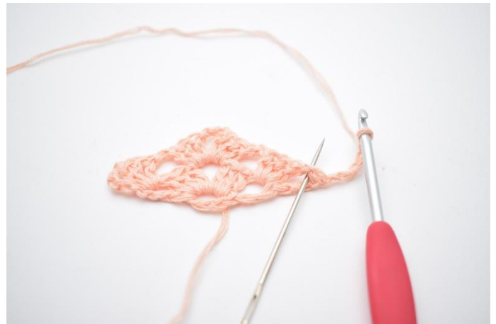
19. Det hekles nå i mellomrommet (som nålen markerer).