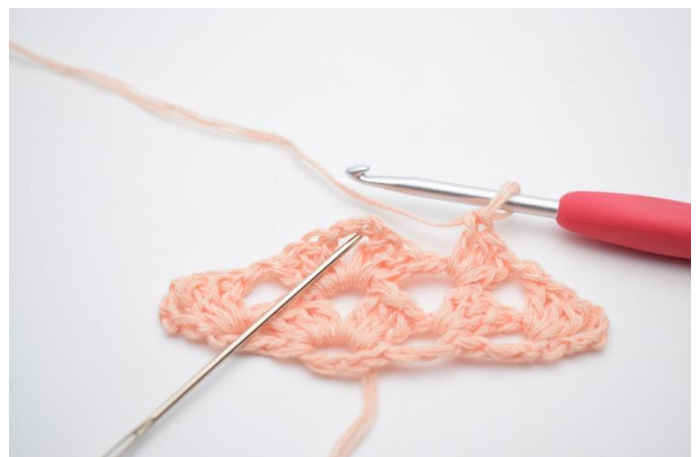
23. Nå hekles det igjen i spissen, og ned i lm buen.