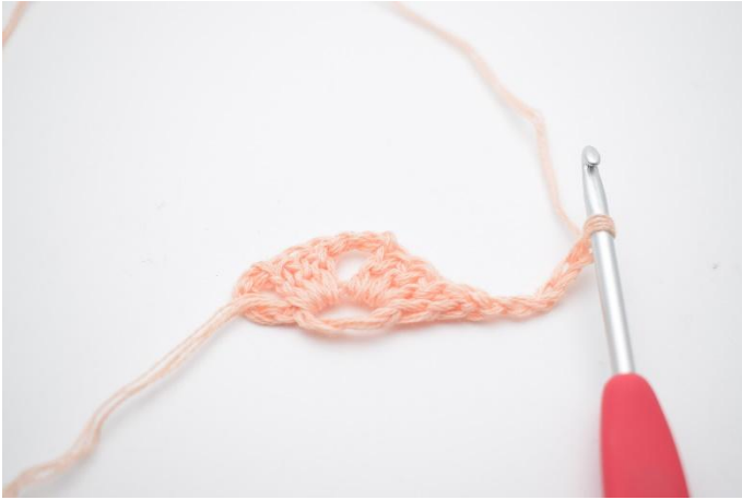
7. Snu ditt arbeid og lag 5 lm.