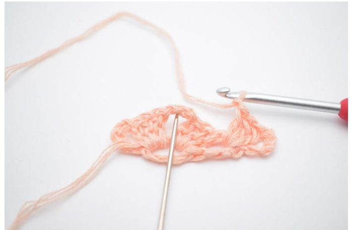
10. Lag 1 lm. Nå hekles det ned i lm-buen fra forrige omgang (dette blir spissen av sjalet).