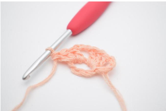
5. Hekle 3 stv ned i ringen.