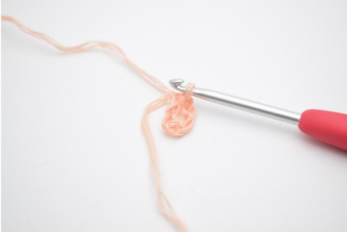
1. Lag 6 lm, som samles til en ring med 1 km.