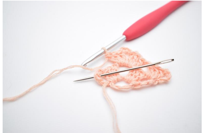
14. Lag 1 lm. Neste stv gruppe hekles i mellomrommet (som nålen markerer).