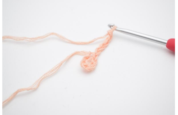
2. Lag 5 lm.