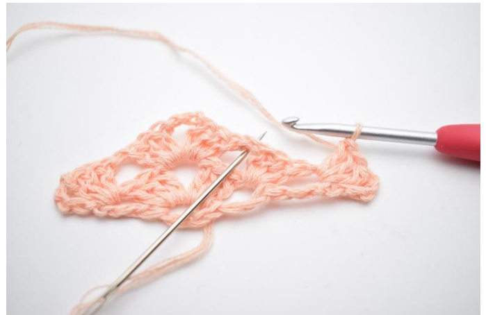
21. Lag 1 lm. Neste stv gruppe hekles i neste mellomrom.