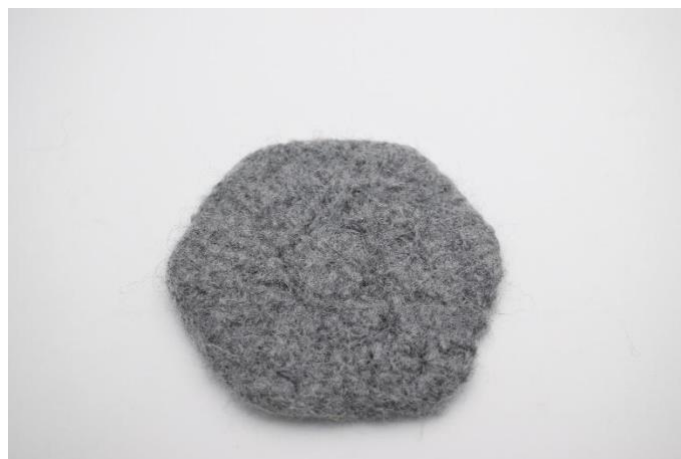
Etter toving. Mål ca. 10x11 cm