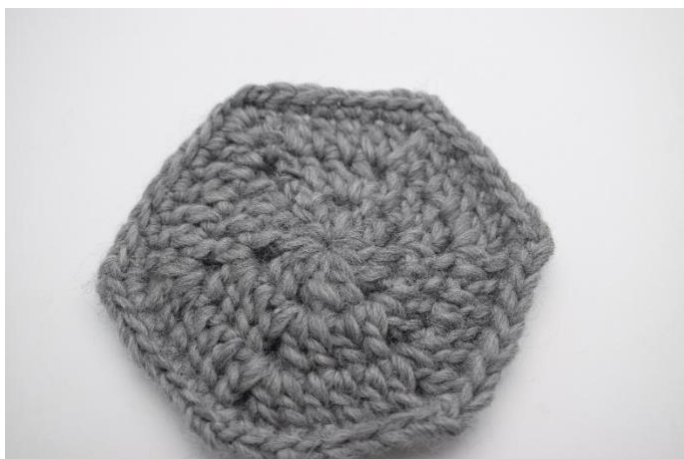
Slik ser brikken ut før toving. Mål ca. 14x15 cm