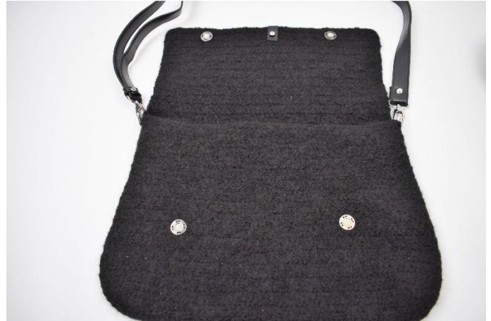
9. Sy 2 sett magnet trykklås fast på vesken som vist her.