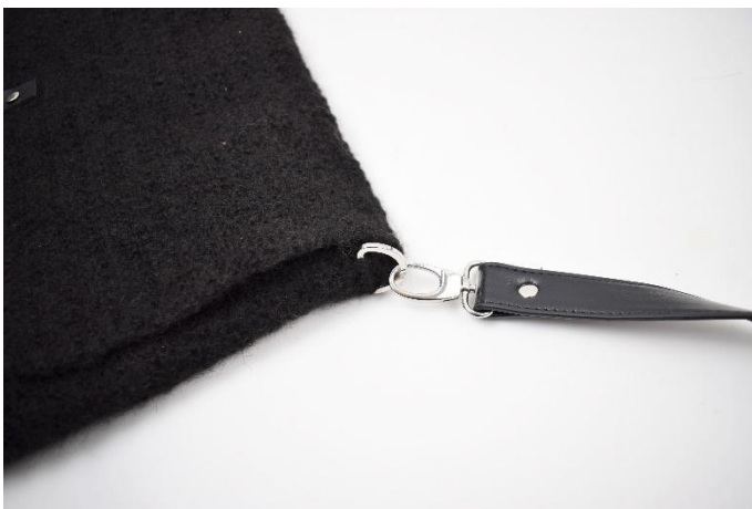
5. Nå kan remen festes på.