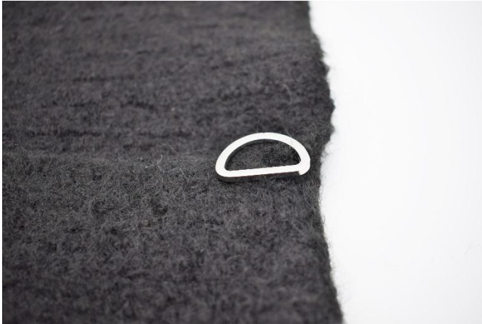
3. Sy d-ringen fast i siden av vesken.