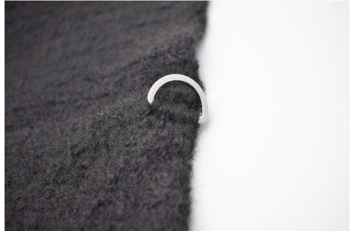
4. Slik. Gjenta i den andre siden.