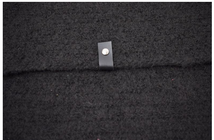
7. Monter lær stykket midt på "flappen" og slå på naglen.