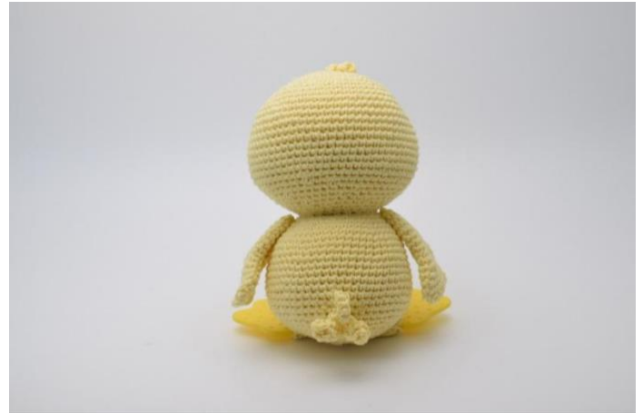
2. Samt bakpå.