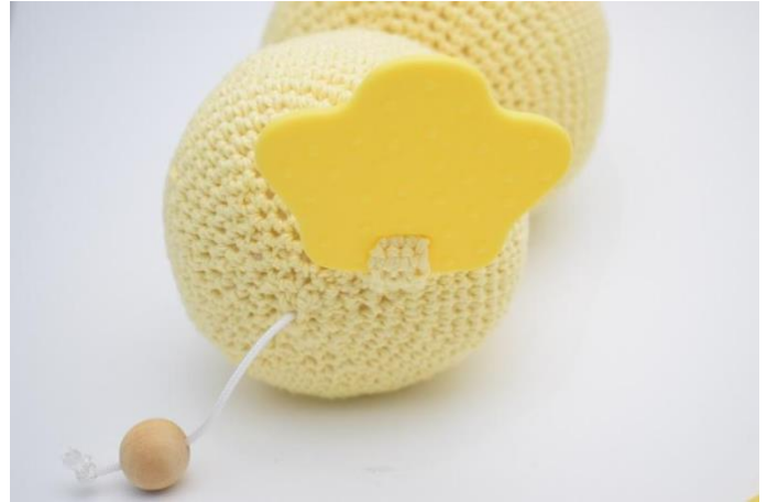
4. og sy den fast under anden.