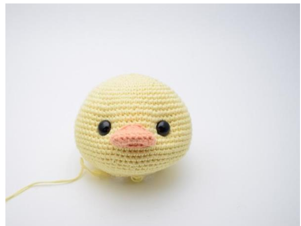
10. Lag en knute. Det er nå laget fordypninger ved øyene.