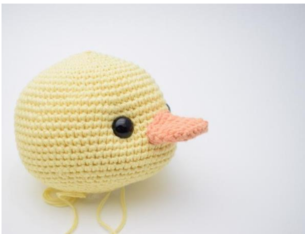
9. Trekk nålen med ned gjennom hodet igjen. Trekk i de to ender og stram forsiktig til inntil du har den fordypning du ønsker.