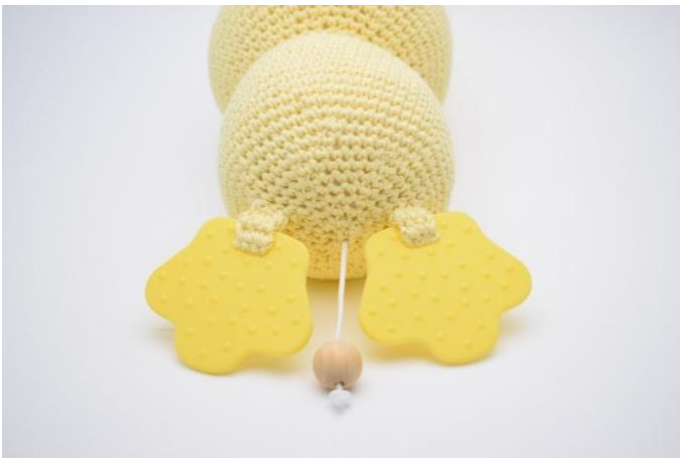
5. Gjenta dette ved begge føtter.