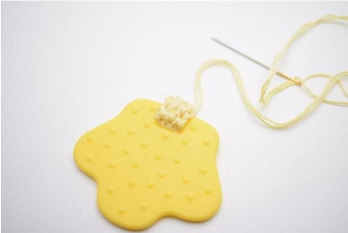
3. Sy stykket sammen,