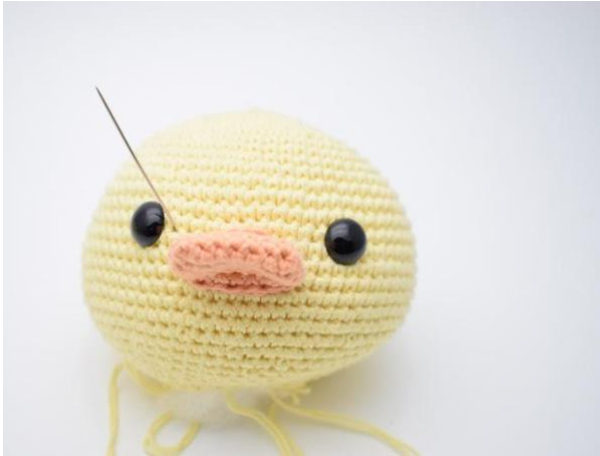
7. Trekk nålen over i siden av det andre øye,