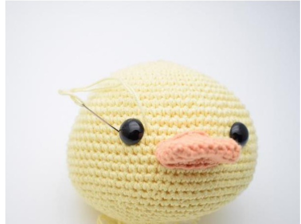
8. og ned igjen på den andre siden av øyet.