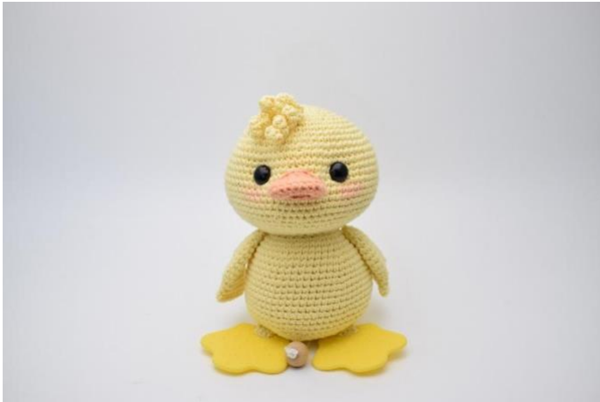
1. Sy krøllene fast øverst på hovedet.