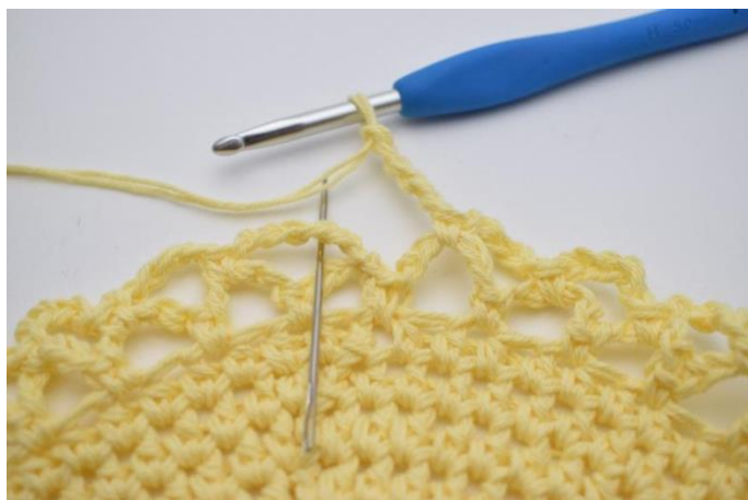
14. Slik gjentas omgangen rundt. Omgangen avsluttes med 1 fm i den første lm-bue som ble dannet på denne omgang.