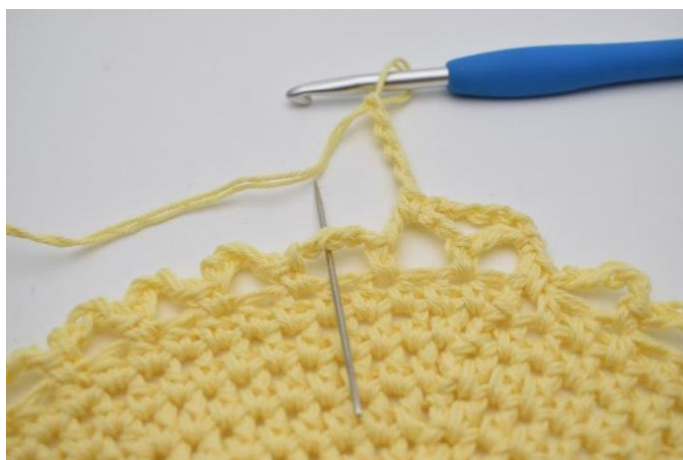
12. I neste lm- bue. (Nålen markerer den her)