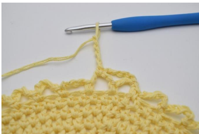
11. Lag 5 lm.