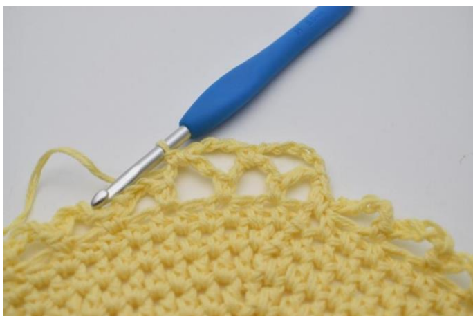
13. Hekle 1 fm.