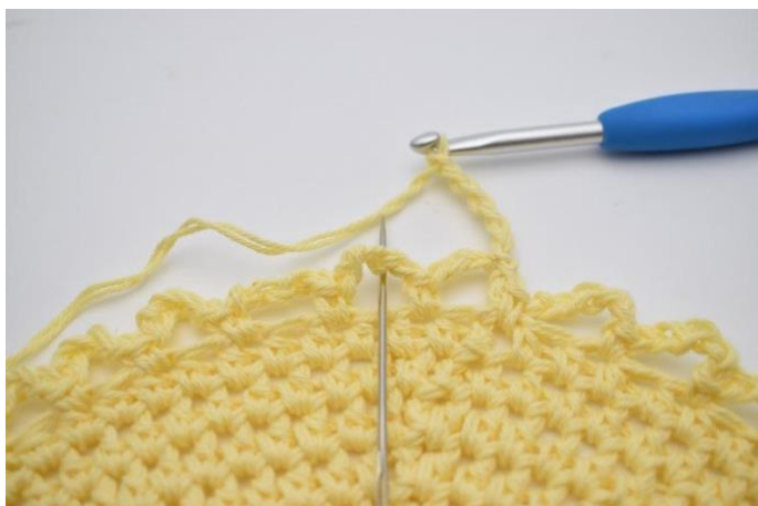
9. I neste lm- bue. (Nålen markerer den her)