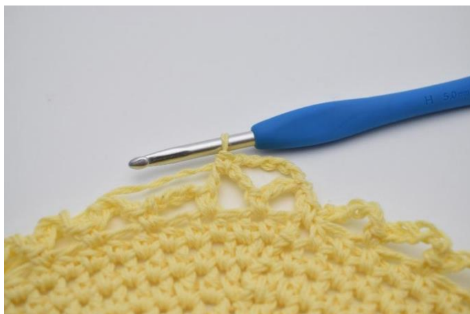
10. Hekle 1 fm.