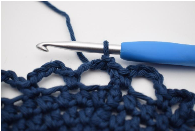
7. Lag 3 km opp langs den første lm-bue, slik at du starter i midten av den.