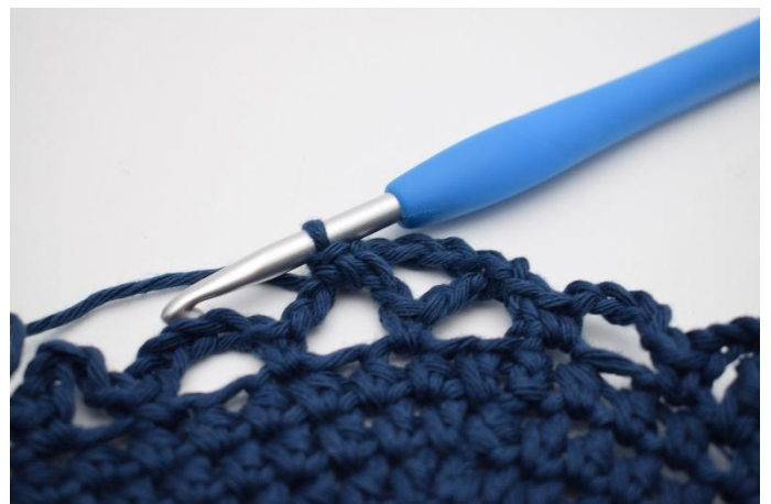
10. Hekle 1 fm.