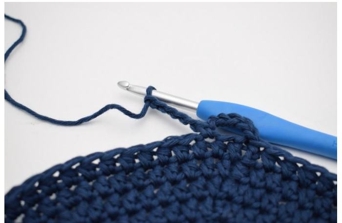
4. Lag 5 lm.