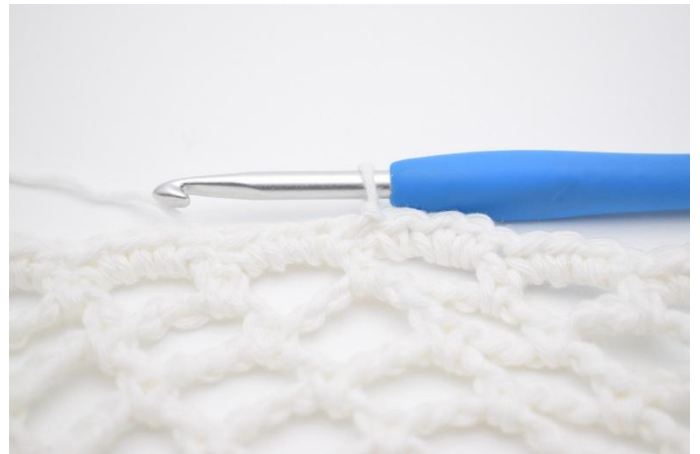
4. Avslutt med 1 km.