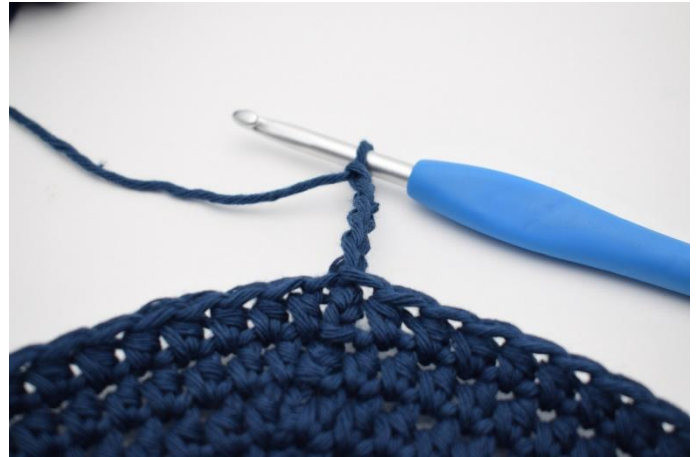
2. Lag 5 lm.