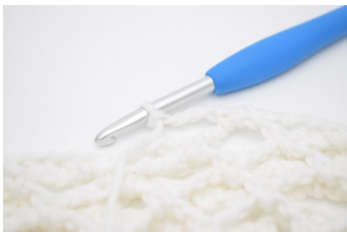
17. Det hekles en omgang til med farge 4. Denne omgangen hekles som før, men bare med 4 lm i stedet for 5 lm.