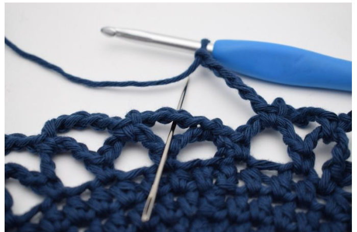
14. Slik gjentas omgangen rundt. Omgangen avsluttes med 1 fm i den første lm-bue som ble dannet på denne omgang.