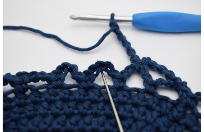
12. I neste lm- bue. (nålen markerer den her)