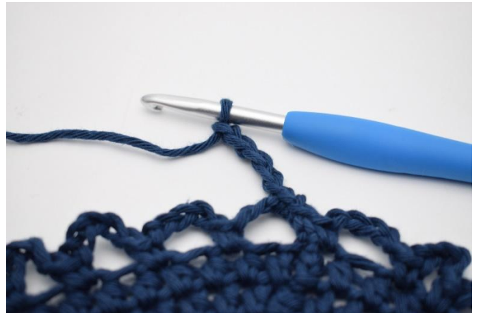
8. Lag 5 lm.