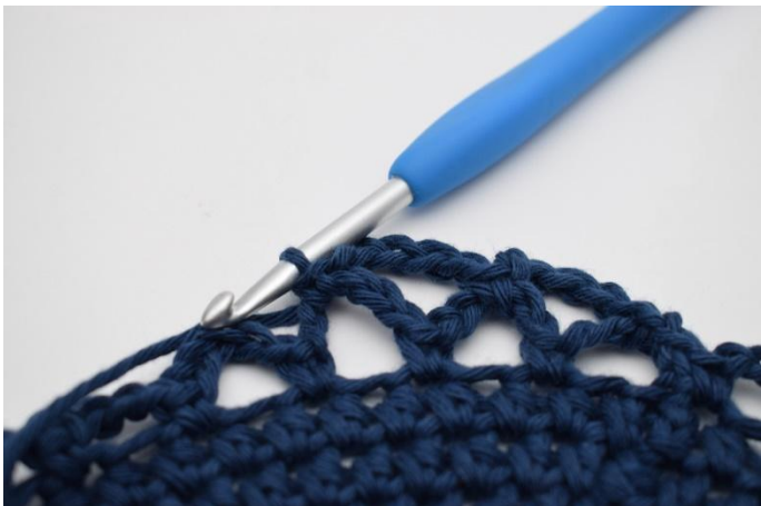
13. Hekle 1 fm.