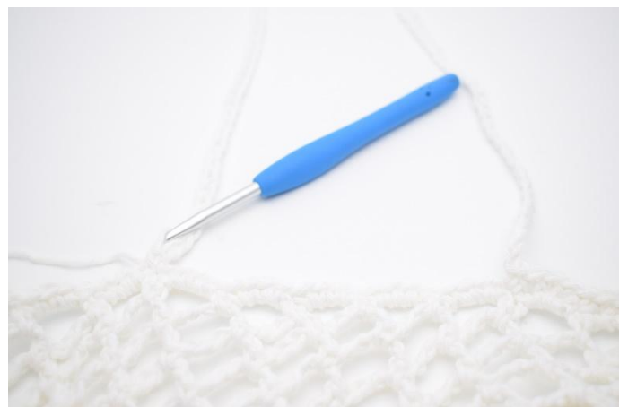
6. Hekle 1 fm i neste maske.