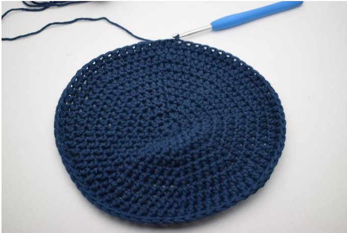
1. Her er bunnen nettopp avsluttet med 1 km.