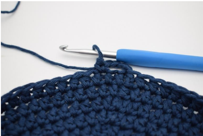
3. Hopp over 1 m, og hekle 1 fm i neste.