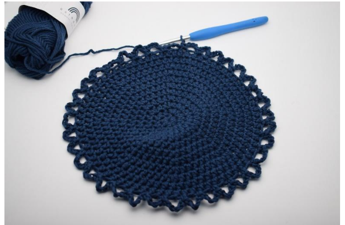
6. Slik gjentas omgangen rundt, så du har 36 lm-buer rundt bunnen.