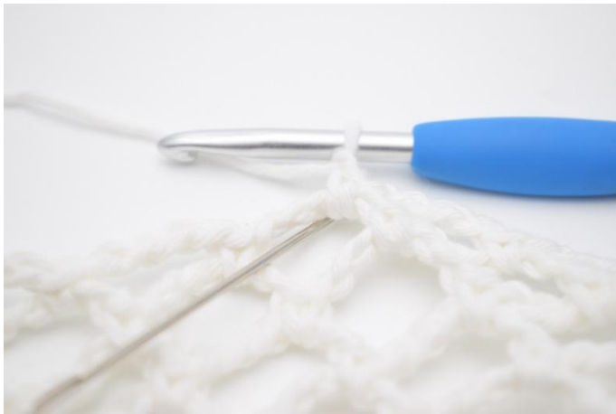
1. Lag 1 lm, og hekle 4 fm i lm-buen.

Nå hekles kanten og hanken. Dette gjøres på følgende måte: