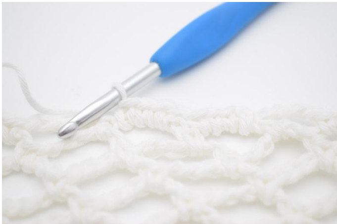
3. Hekle 4 fm i neste lm-bue. Dette gjentas hele veien rundt.