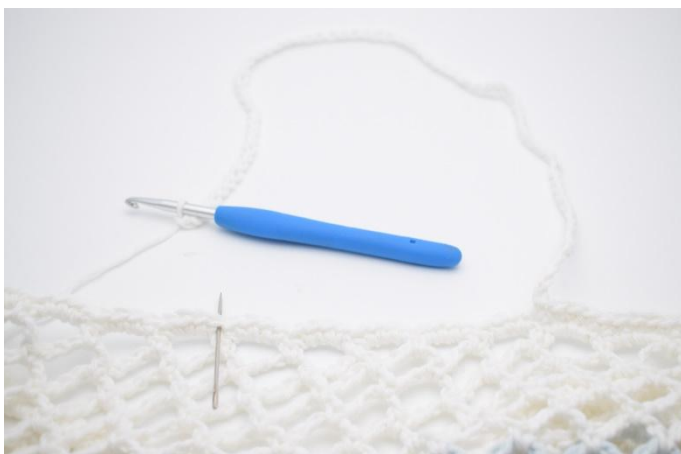
5. Nå hekles det den omgangen der hvor hanken skal lages. Lag 1 lm, og hekle 1 fm i de neste 52 m. Lag 75 lm. Hopp over 20 masker,