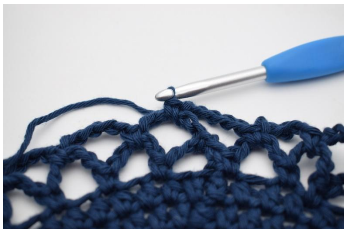
15. Gjenta nå omgangene og skift farge som beskrevet i mønsteret