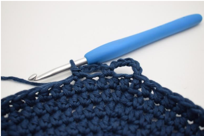
5. Hopp over 1 m, og hekle 1 fm i neste.