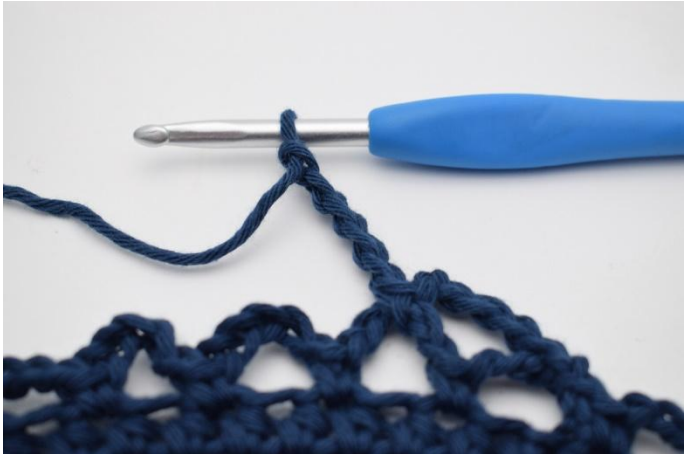
11. Lag 5 lm.