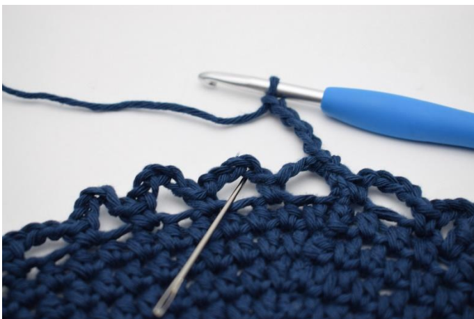
9. I neste lm- bue. (nålen markerer den her)