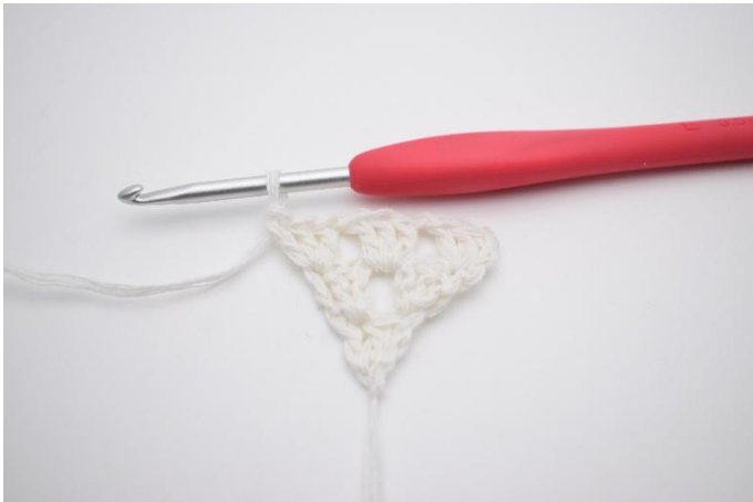
7. Hekle 1 stv gruppe i siste m.