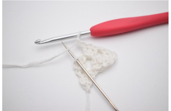
6. Lag 1 lm. Nå hekles det i siste m som nålen her markerer