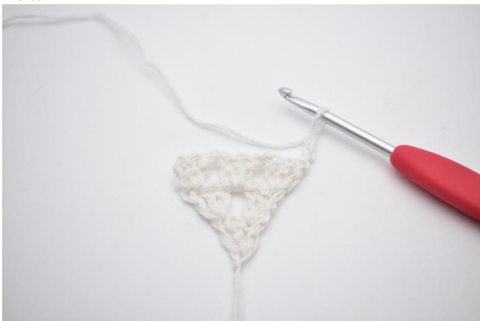
1. Snu ditt arbeid med 3 lm (som erstatter 1. stv)