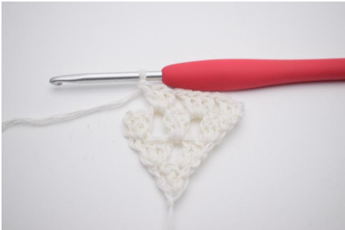
5. Lag 1 lm, og i neste lm-mellomromm hekles det enda 1 stv gruppe.