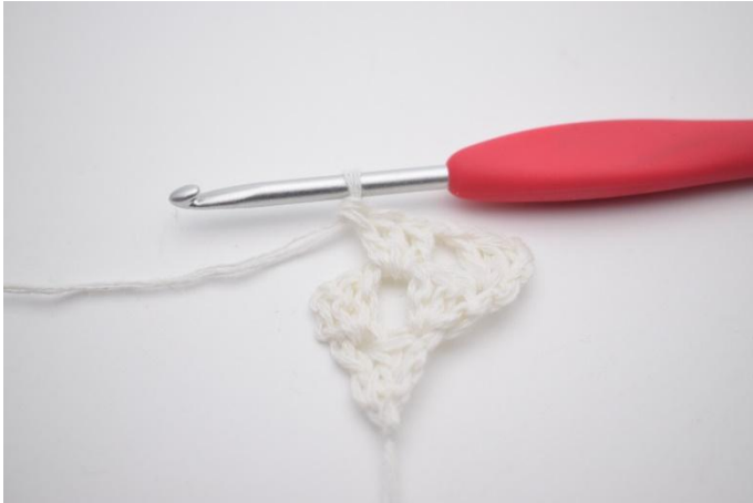
5. Hekle 1 stv gruppe i lm-mellomrommet.