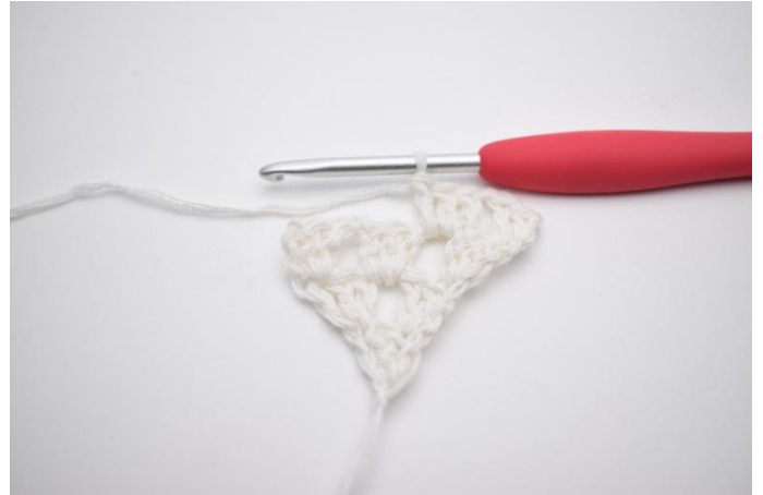
4. Lag 1 lm, og i lm-mellomrommet på forrige rad hekles 1 stv gruppe.