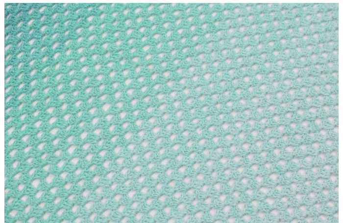
8. Slik gjentas det til garnet er brukt opp.