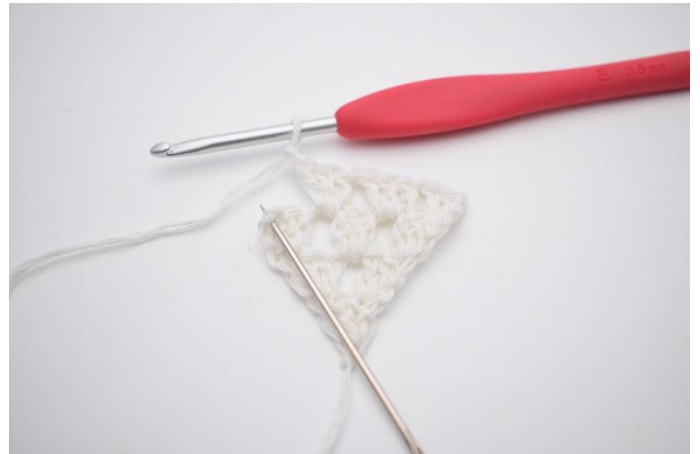
6. Lag 1 lm. Nå hekles det i siste m, som nålen her markerer.