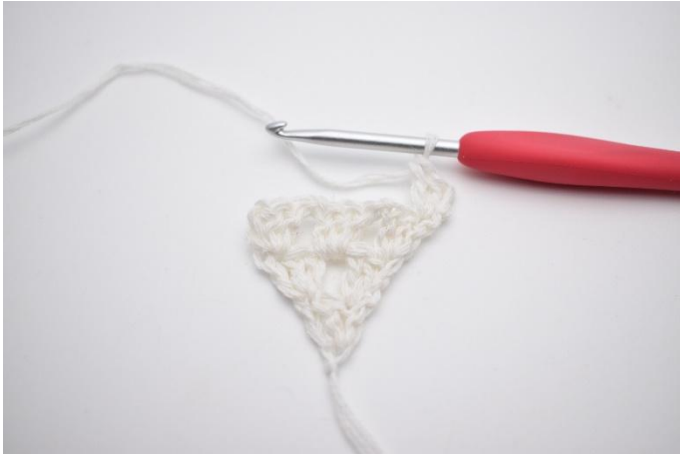
3. hekles 2 stv. Det er nå laget 1 stv gruppe.