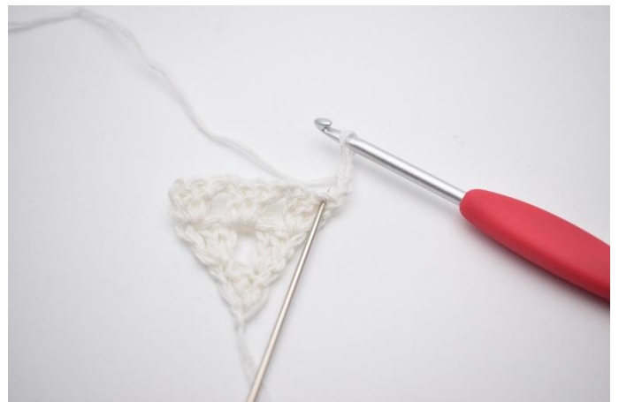
2. I første m, som nålen her markerer,