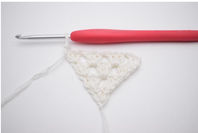
7. Hekle 1 stv gruppe.