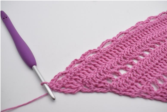
5. *Lag 5 lm, hopp over 3 m og hekle 1 fm i neste m*. Gjenta *til* raden ut.