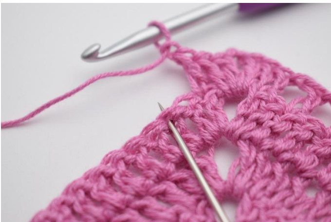
7. *Lag 1 lm, hopp over 1 m over, hekle 1 stv i neste m*.