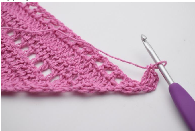
1. Snu arbeidet med 4 lm. Hekle 2 stv i første m.