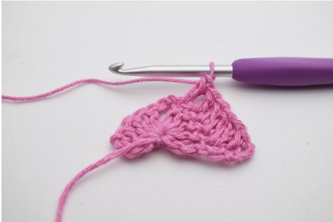
3. Hekle 1 stv i de neste 4 m.