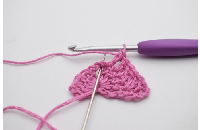
4. I lm-buen hekles 2 stv, 2 lm, 2 stv.