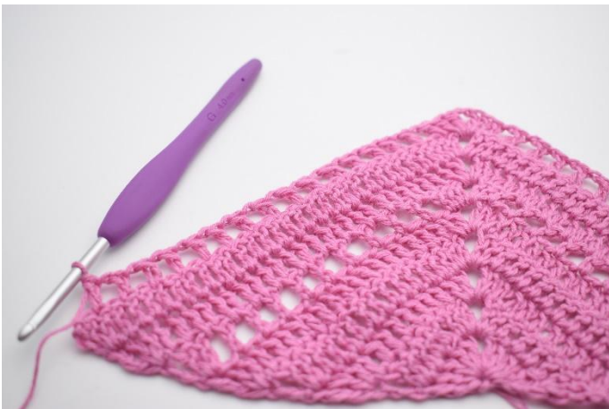
9. Gjenta *til* i alt 15 ganger.