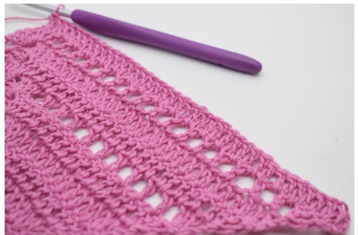
2. Hekle 1 stv i de neste 36 masker og lm-huller.