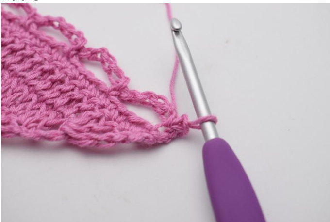
1. Snu med 1 lm. Hekle 1 fm i første m.