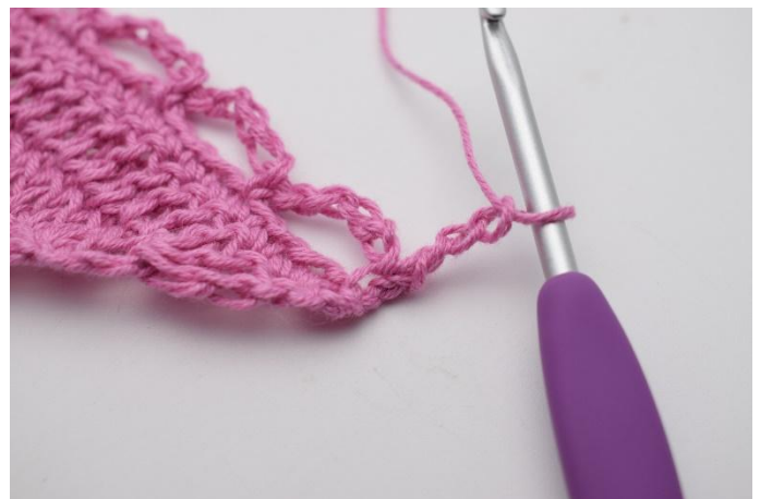
2. Lag 3 lm,