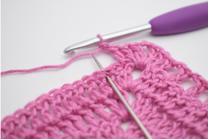
7. *Lag 1 lm, hopp over 1 m, hekle 1 stv i neste m*.