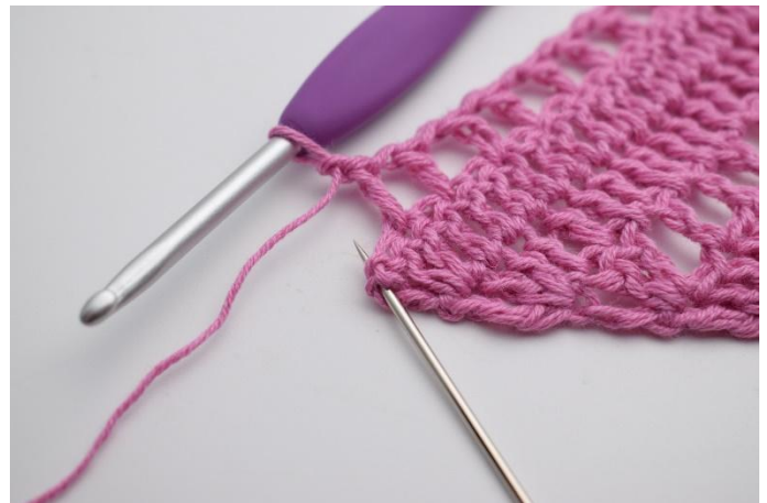
10. Lag 1 lm, hopp over 1 m, og hekle 2 stv og 1 dblst i siste stv.