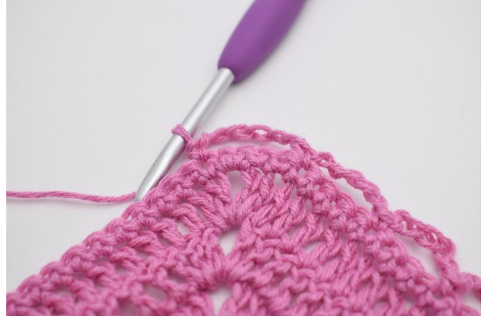
4. Gjenta *til* frem til spissen. I spissen lages 6 lm, hopp over 5 m, og hekle 1 fm i neste m.