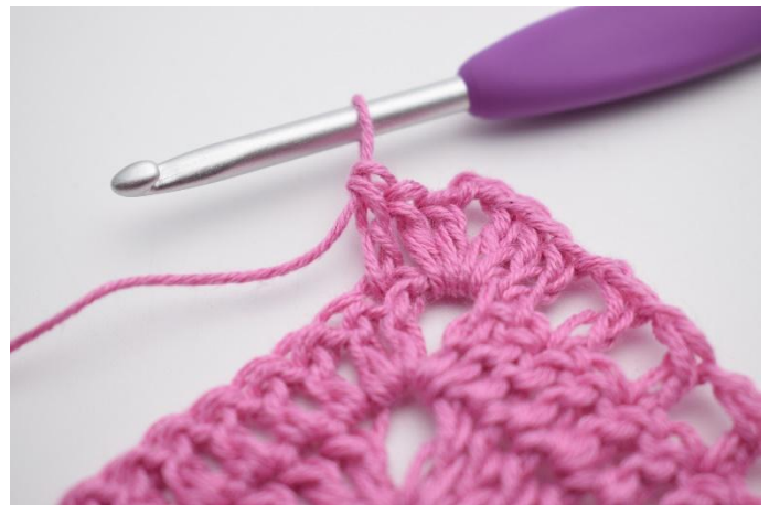
6. Hekle 1 stv i neste m.