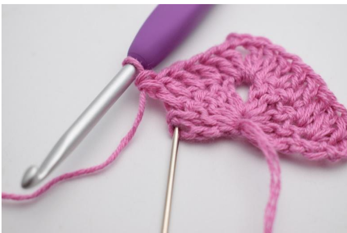
7. I siste m hekles 2 stv og 1 dblst.