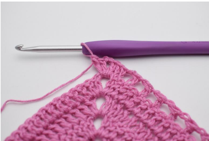
5. I lm-buen hekles 2 stv, 2 lm, 2 stv.