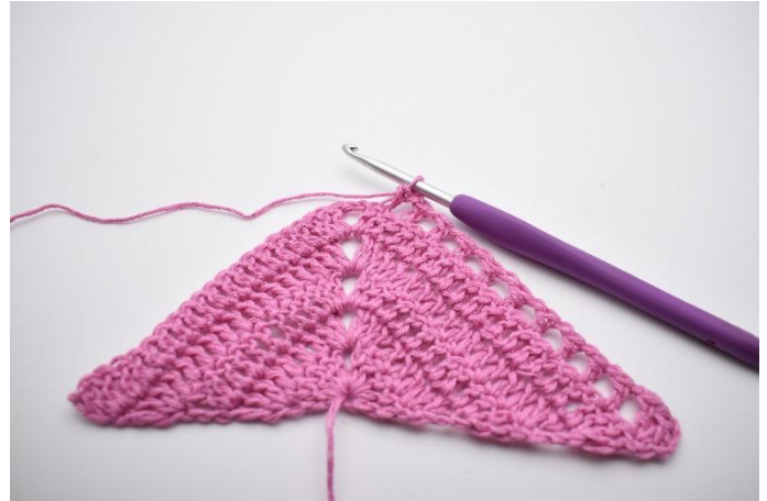
4. Gjenta *til* i alt 10 ganger.