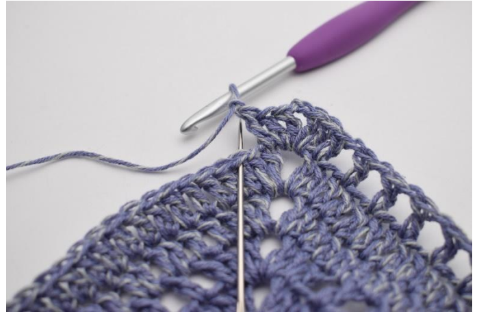
8. *Lag 1 lm, hopp over 1 m,