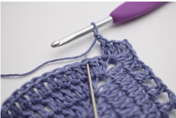
9. *Lag 1 lm, hopp over 1 m,