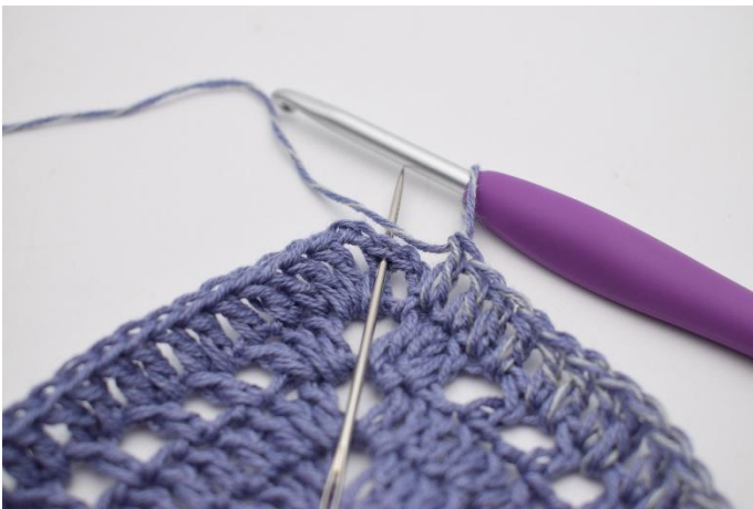
5. Hekle 1 stv i de siste 87 m og lm-huller. Avslutt med 1 km.