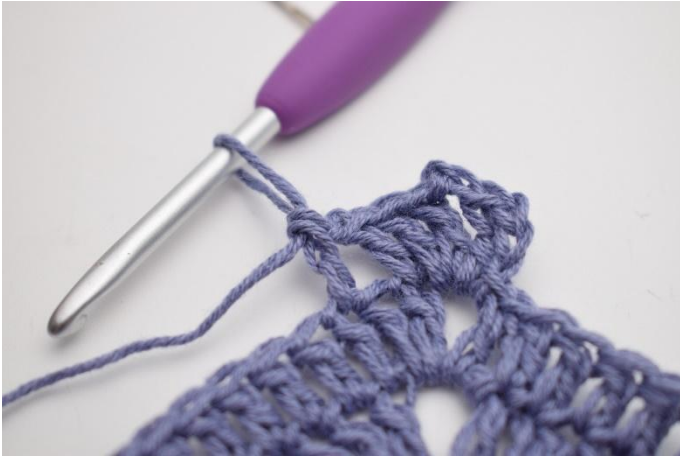
5. hekle 1 stv i neste m*.