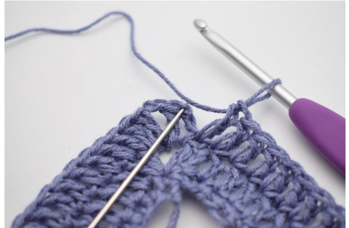
8. Avslutt med 1 km.