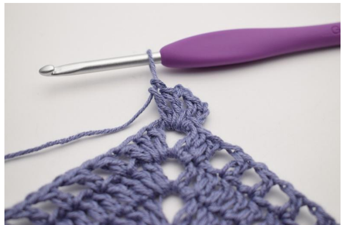
2. Lag 3 lm (som erstatter 1.stv). Hekle 1 stv, 2 lm, og 2 stv i lm-mellomrommet.