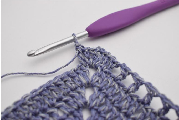
7. Lag 1 stv i først m.