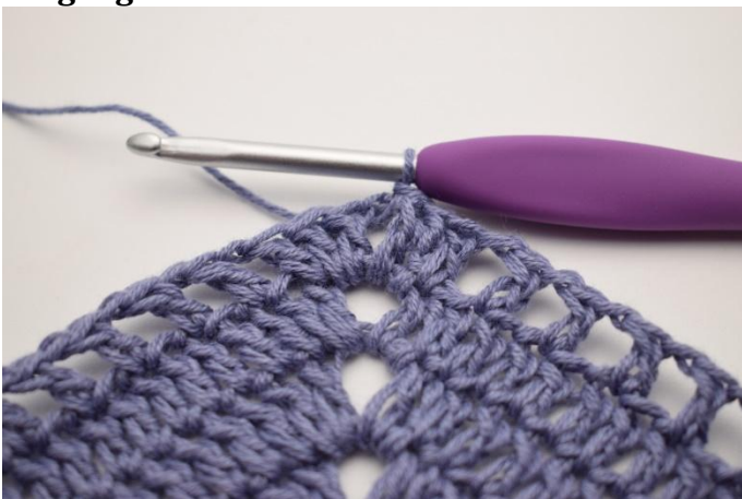
1. Lag km bort til lm-mellomrommet.