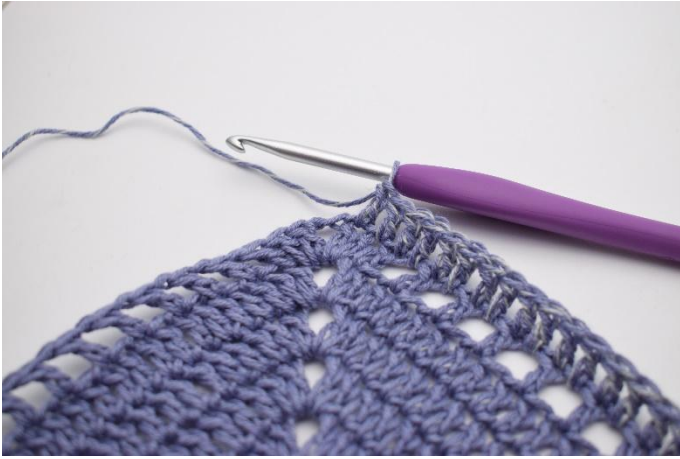
3. Hekle 1 stv i de neste 87 m og lm-huller.