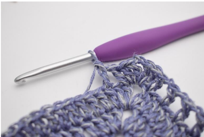
9. hekle 1 stv i neste m*.