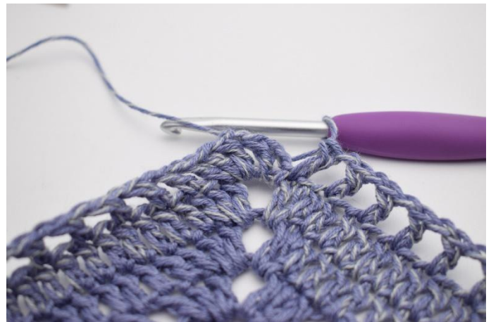
10. Gjenta *til* i alt 47 ganger.