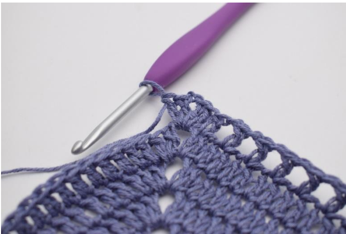
7. I lm-mellomrommet hekles *2 stv, 2 lm, 2 stv*.