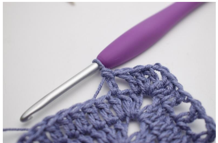
10. hekle 1 stv i neste m*.