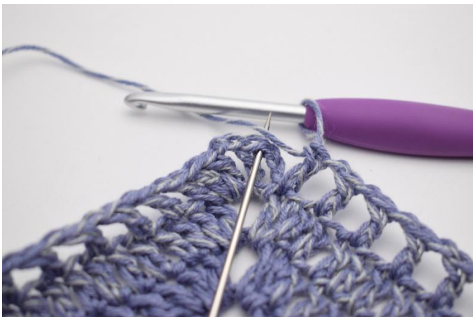
11. Avslutt med 1 km.