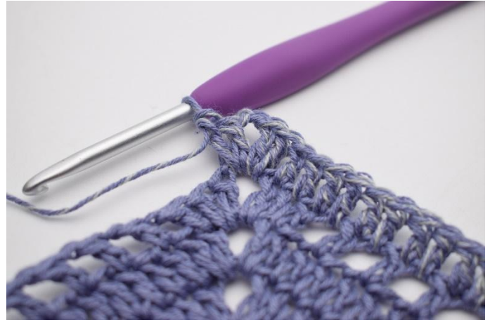
4. I lm-mellomrommet hekles *2 stv, 2 lm, 2 stv*.