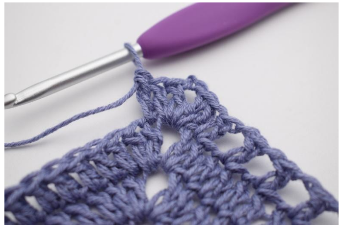
8. Lag 1 stv i først m.