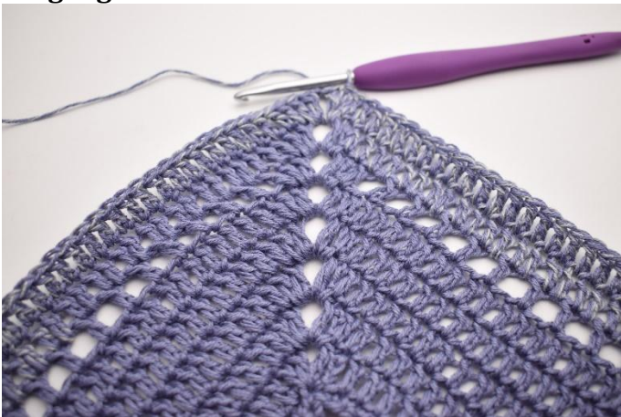
1. Lag km bort til lm-mellomrommet. Lag 3 lm (som erstatter 1.stv). Hekle 1 stv, 2 lm, og 2 stv i lm-mellomrommet. Hekle 1 stv i de neste 91 m. I lm-mellomrommet hekles *2 stv, 2 lm, 2 stv*. Hekle 1 stv i de siste 91 m. Avslutt med 1 km.