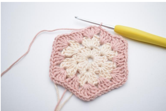
7. Gjenta *til* i alt 5 ganger. Avslutt med 1 km.