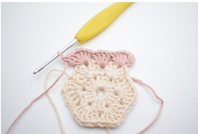
5. *Hekle 3 stv, 1 lm, 3 stv i neste lm-mellomrom,