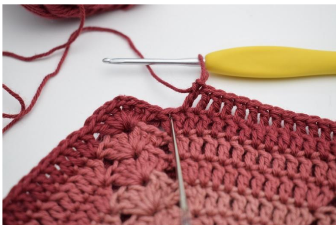
7. 2 stv i neste m.