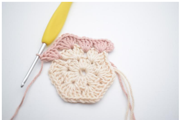
6. hekle 4 stv i det følgende mellomrom*.