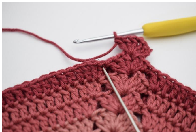
4. Hopp over 3 m,