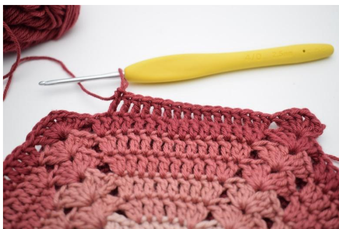
6. 1 stv i de neste 14 m,