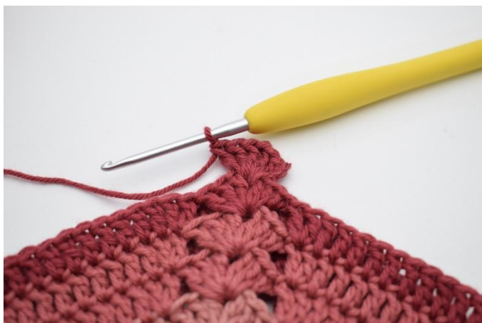
3. Lag 3 lm (som erstatter 1 stv). Hekle 2 stv, 1 lm, 3 stv i lm-mellomrommet