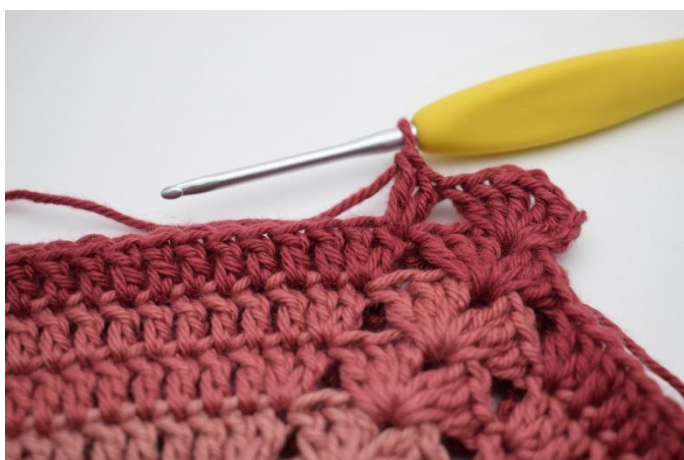
5. hekle 2 stv i neste m,