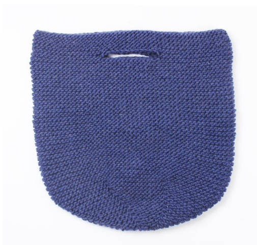
Kurv før vask

Fell av og fest ender. Vask i maskinen på 60 grader.