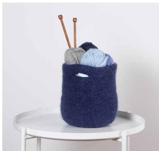
Kurv etter vask