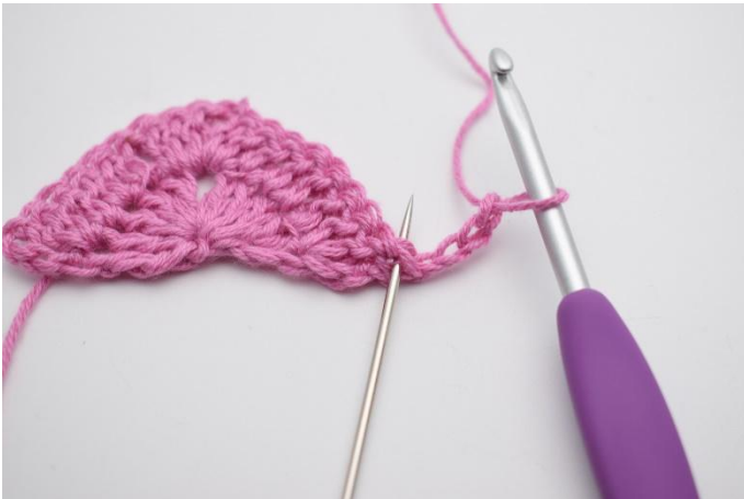
1. Snu arbeidet med 4 lm. Hekle 2 stv i første m. Nålen her markerer den første maske.