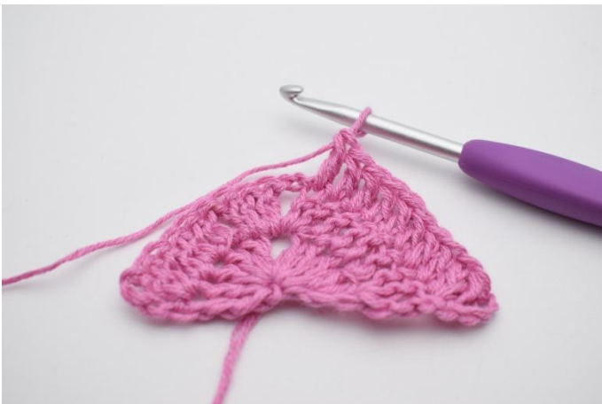
3. Hekle 1 stv i de neste 8 m.