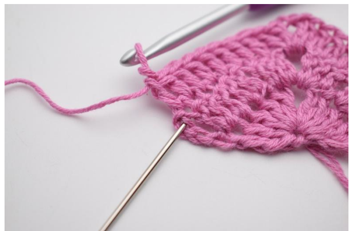
6. I siste m hekles 2 stv og 1 dblst.