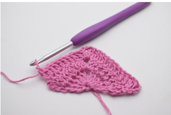
5. Hekle 1 stv i de neste 8 m.