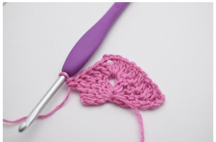
6. Hekle 1 stv i de neste 4 m.