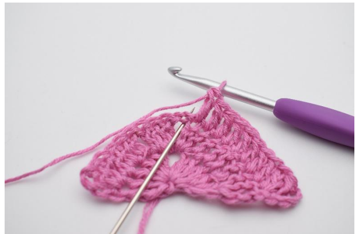
4. I lm-buen hekles 2 stv, 2 lm, 2 stv.