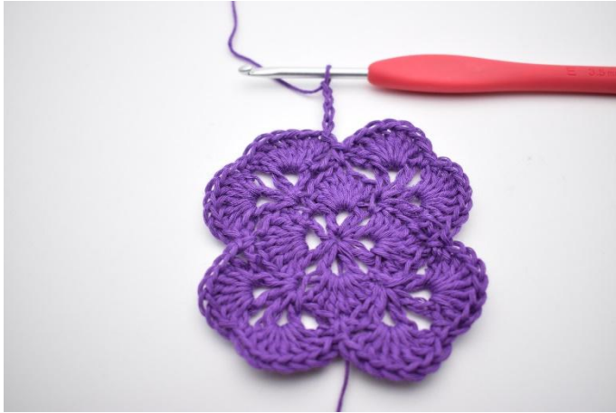
1. Lag 4 lm.