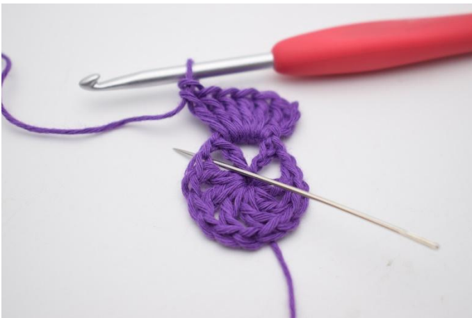
5. I neste lm-mellomrom hekles 1 fm.