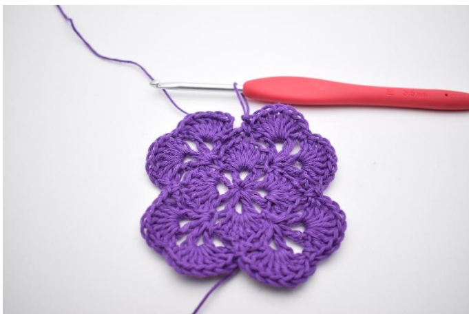
17. Gjenta dette omgangen rundt.