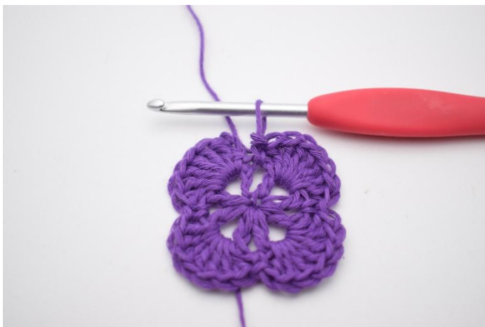
11. Gjenta omgangen rundt.