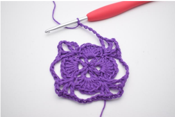
11. Gjenta omgangen rundt.