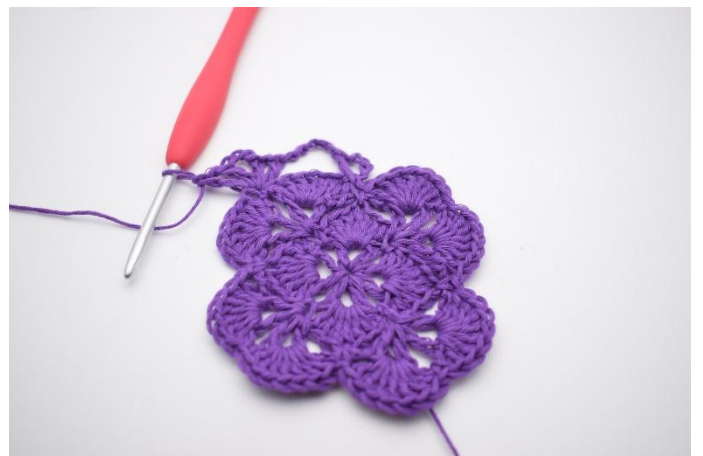
6. Slik. Det er nå dannet 2 vér med 3 lm imellom dem, og det er dannet et hjørne.