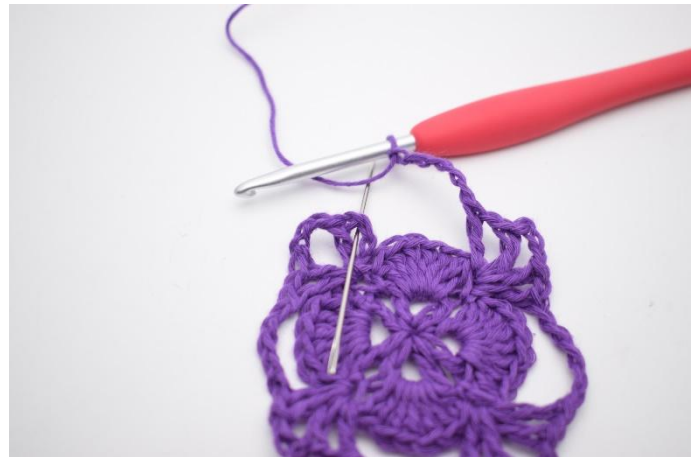
12. Avslutt med 1 km i lm-mellomrommet i den første v.