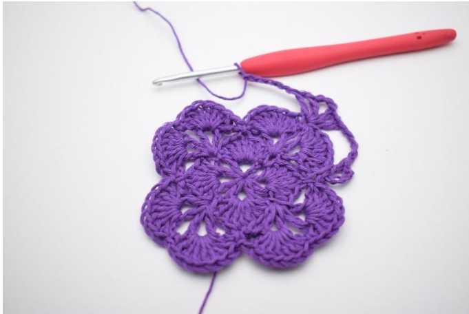
7. Lag 5 lm.