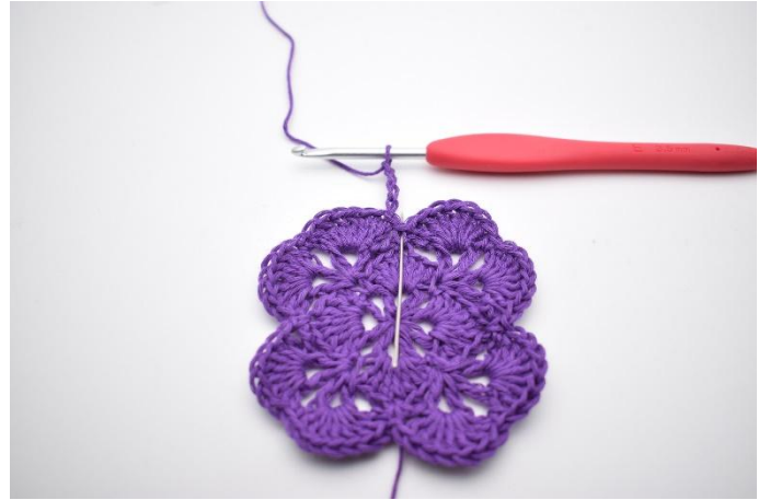
2. I fm ved siden av hekles 1 stv.