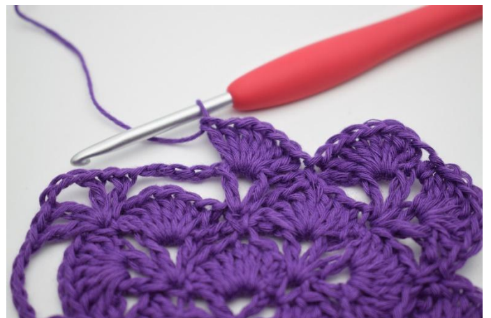
12. I neste v hekles det 7 stv.