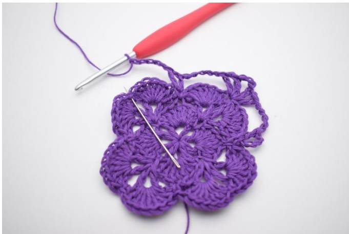
11. I neste fm hekles 1 stv, 1 lm, 1 stv, 3 lm, 1 stv, 1 lm og 1 stv.