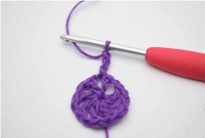
3. Lag 3 lm, hekle 6 stv ned i lm-mellomrommet.