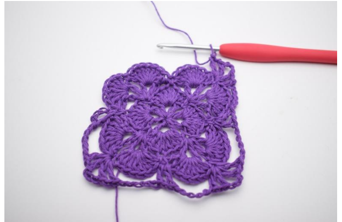
14. Lag 5 lm, i neste fm hekles 1 stv, 1 lm, 1 stv, 3 lm, 1 stv, 1 lm og 1 stv. Det er nå dannet 2 vér med 3 lm imellom dem, og det er dannet enda et hjørne.