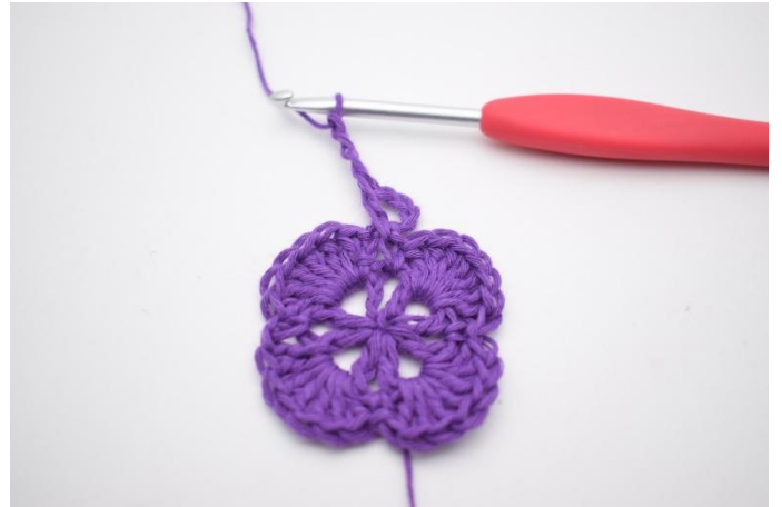
4. Lag 3 lm.