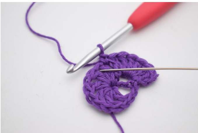
7. I neste lm-mellomrom hekles 7 stv.