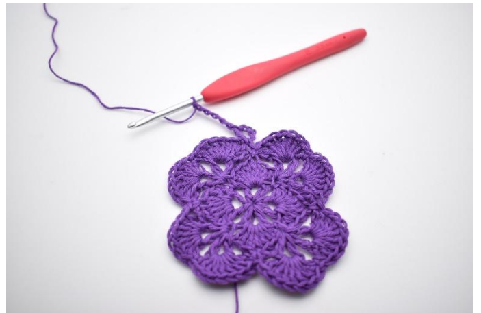
4. Lag 5 lm.