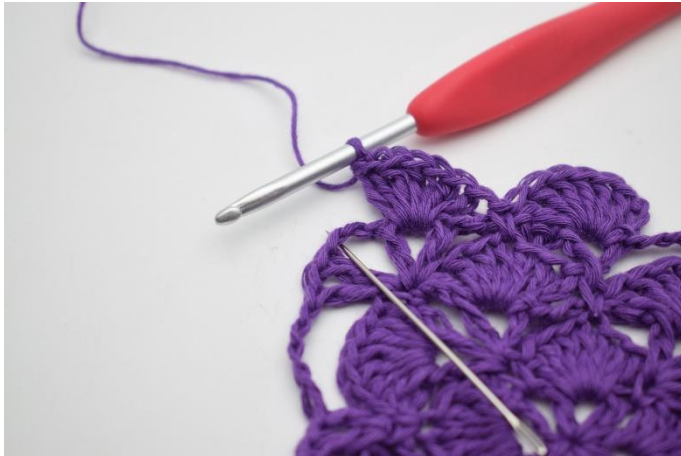
7. I lm-buen hekles 1 fm.