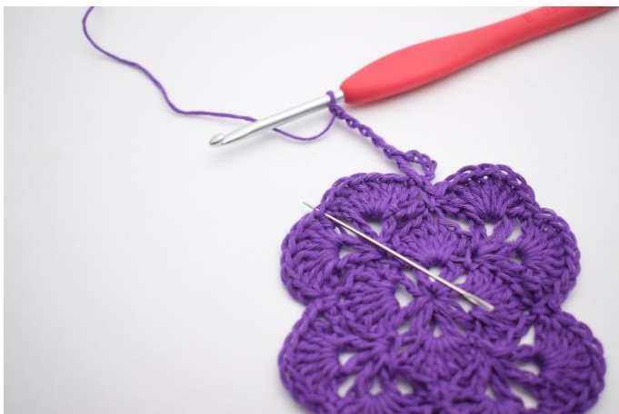
5. I neste fm hekles 1 stv, 1 lm, 1 stv, 3 lm, 1 stv, 1 lm og 1 stv.