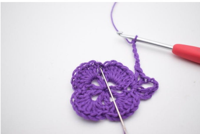
7. I neste fm hekles 1 stv, 1 lm, 1 stv, 3 lm, 1 stv, 1 lm og 1 stv