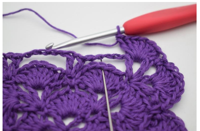
10. Den neste store lm-bue skal nå lenkes fast. Hekle 1 fm i den 4. stv i viften fra forrige omgang.