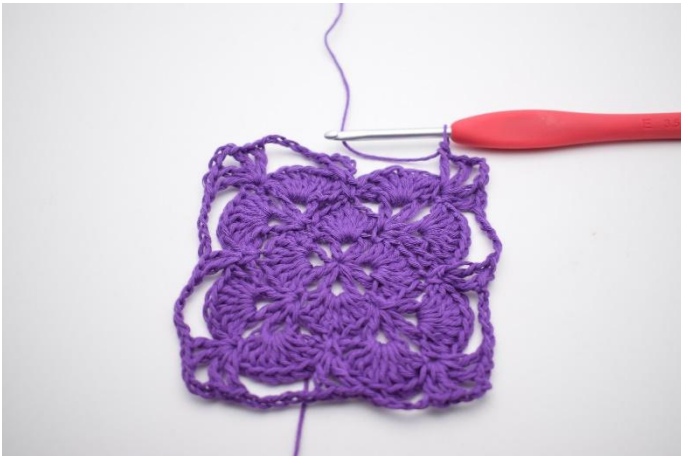
15. Gjenta dette omgangen rundt.