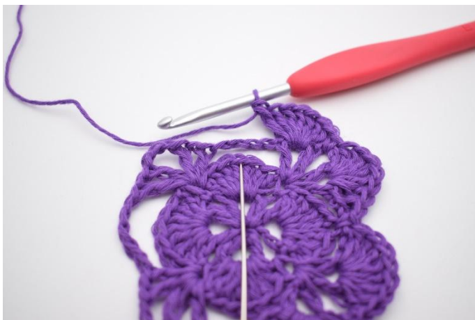
15. Nå skal den neste store lm-bue lenkes fast. Hekle 1 fm i den 4.stv i viften fra forrige omgang.