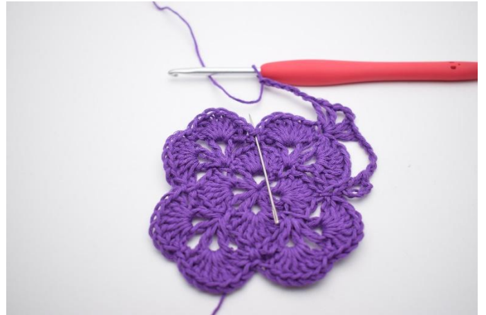
8. I neste fm hekles 1 stv, 1 lm og 1 stv.