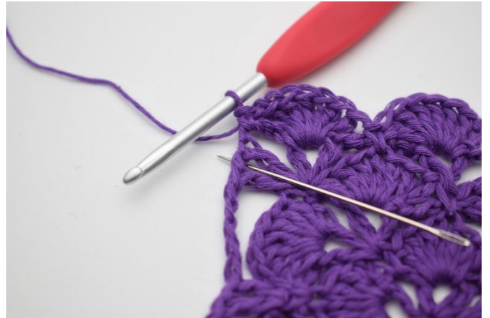
8. I neste v hekles det 7 stv.