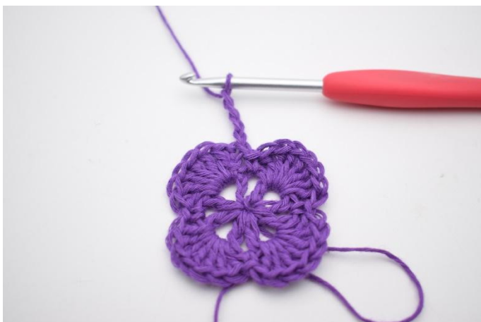
1. Lag 4 lm.