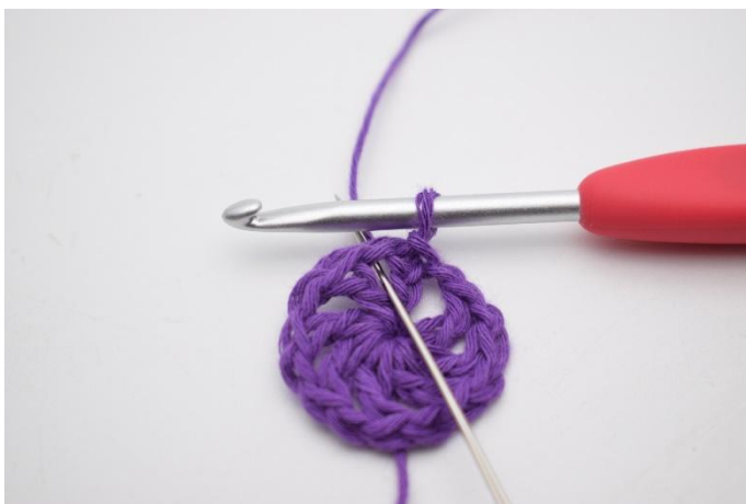
1. Lag 1 km bort i første lm-mellomrom.