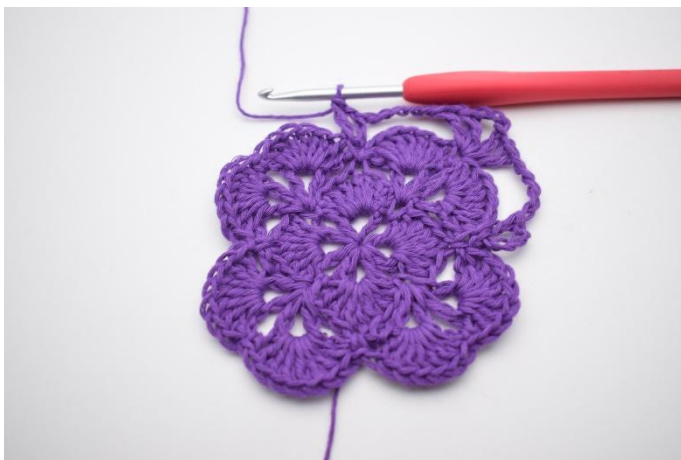
9. Det er nå dannet et v.