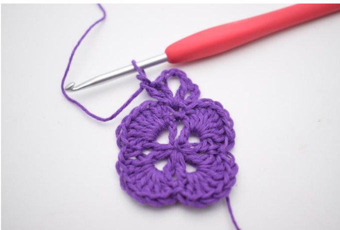
5. Hekle 1 stv, 1 lm og 1 stv ned i samme maske. Det er nå dannet enda en v med 3 lm imellom. Dette er et hjørne.