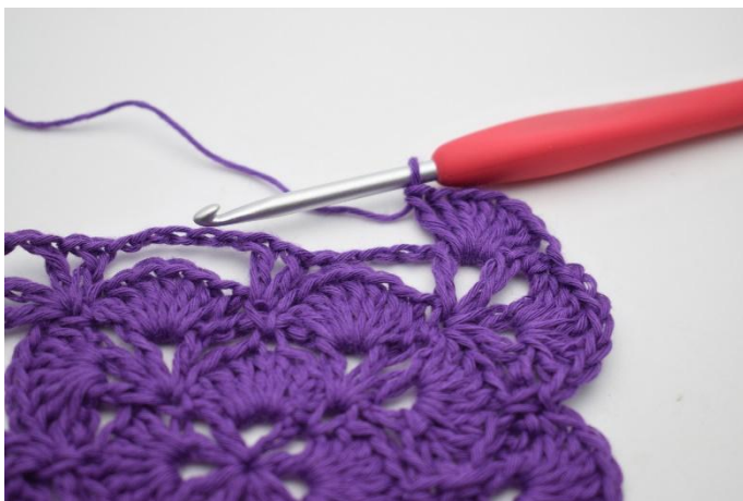
9. Slik. Det er nå heklet 2 vifter i det første hjørne.