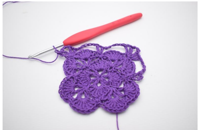
12. Slik. Det er nå dannet 2 vér med 3 lm imellom dem, og der er dannet enda et hjørne.