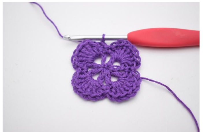
12. Avslutt med 1 km i den øverste av de 3 lm.