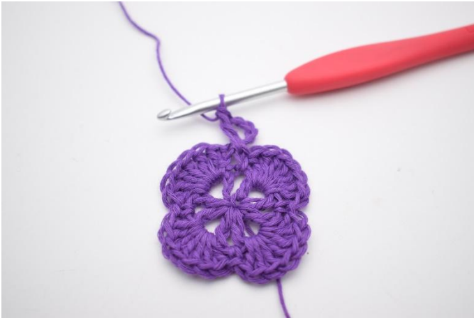
3. Slik. Det er nå dannet en v.