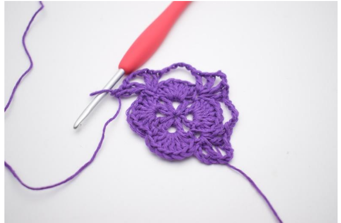
10. I neste fm hekles 1 stv, 1 lm, 1 stv, 3 lm, 1 stv, 1 lm og 1 stv. Det er nå dannet 2 vér med 3 lm imellom dem, og enda et hjørne er dannet.