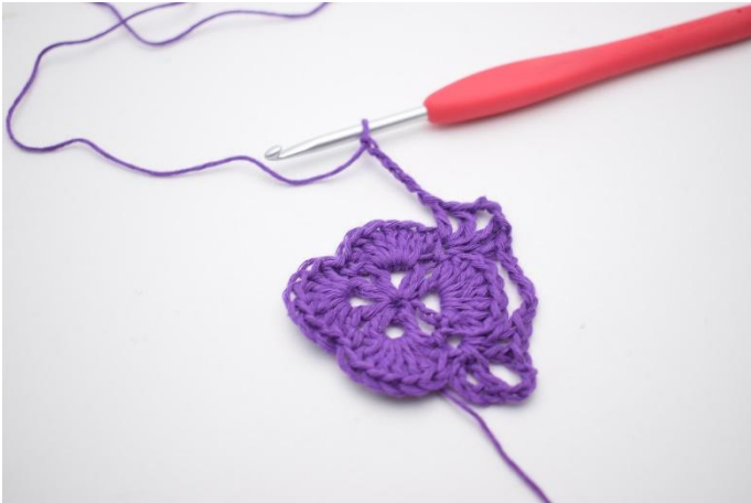
9. Lag 5 lm.