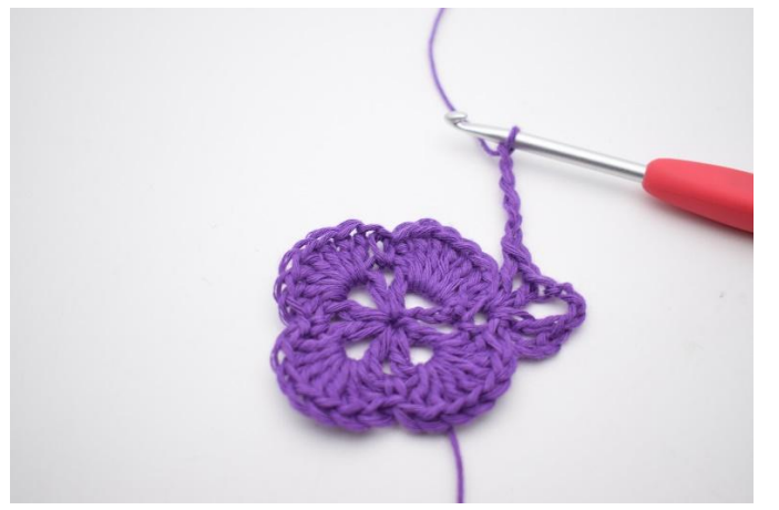
6. Lag 5 lm.