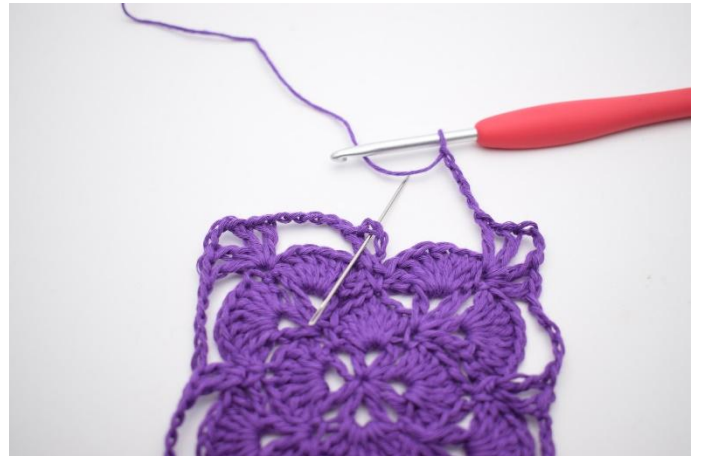
16. Lag 5 lm, og avslutt med 1 km i lm-mellomrommet i den første v.