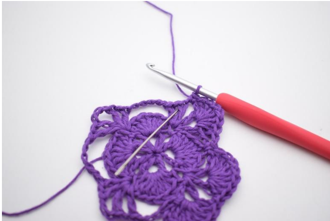
13. I neste v hekles det 7 stv.