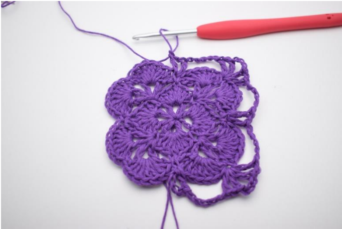
13. Lag 5 lm. I neste fm hekles 1 stv, 1 lm og 1 stv. Det er nå dannet enda en v.