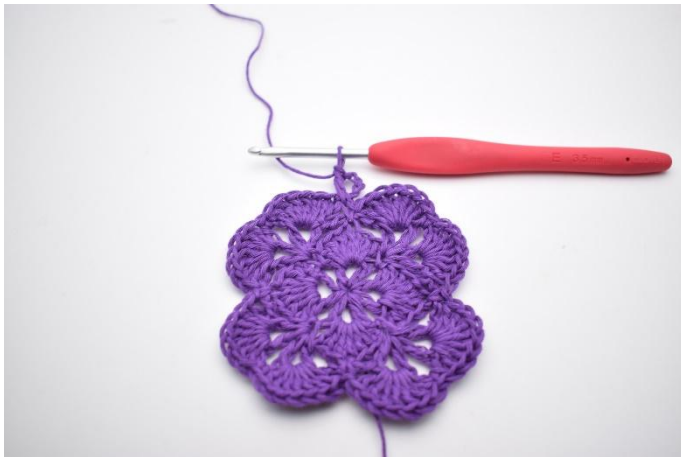
3. Det er nå dannet en v.