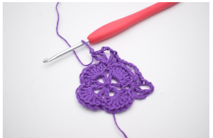
8. Slik. Det er nå dannet 2 vér med 3 lm imellom dem, og enda et hjørne er dannet.