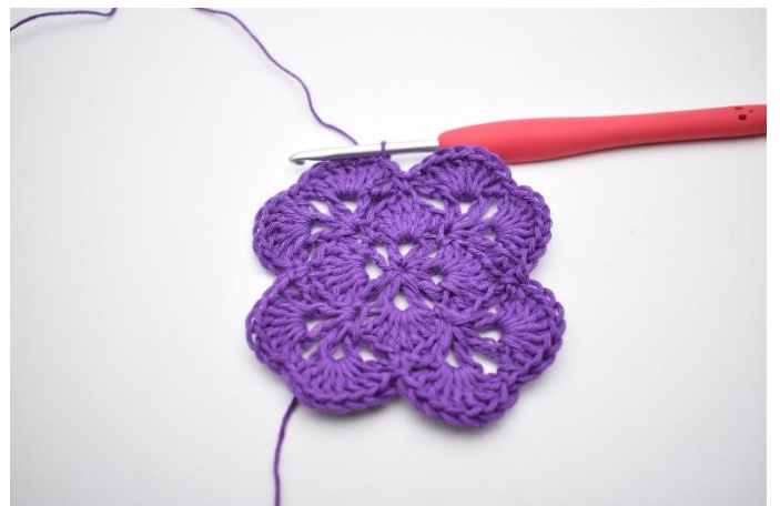
18. Avslutt med 1 km i den øverste av de 3 lm fra omgangens start.