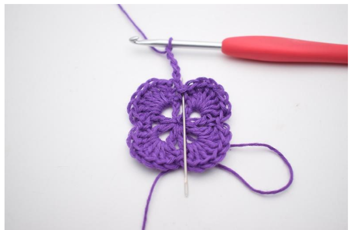
2. I fm ved siden av hekles 1 stv.