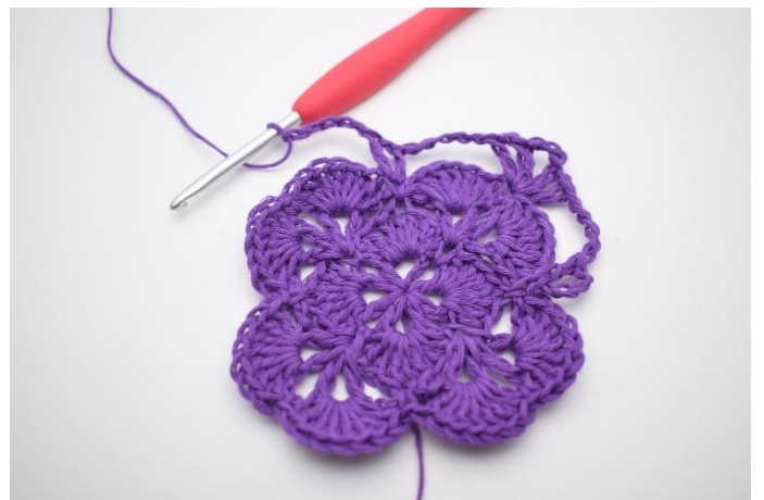
10. Lag 5 lm.