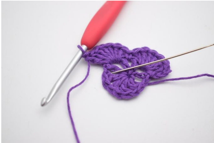
9. I neste lm-mellomrom hekles 1 fm.