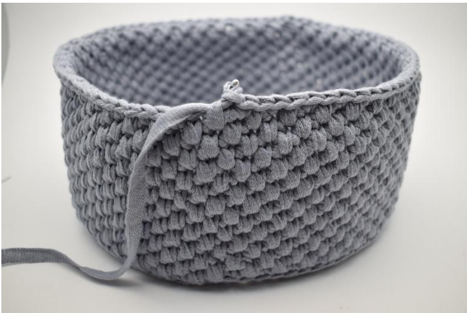
21. Gjenta disse radene som beskrevet i oppskriften.