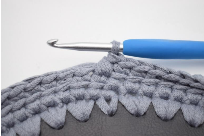
7. Nå hekles det skiftevis fm og lfm. Start med en fm.