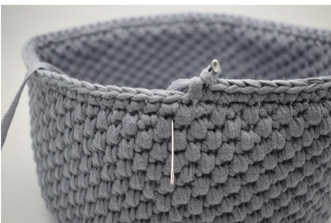
23. Hekle 1 omgang lfm. Nålen markerer hvor din lfm skal hekles.