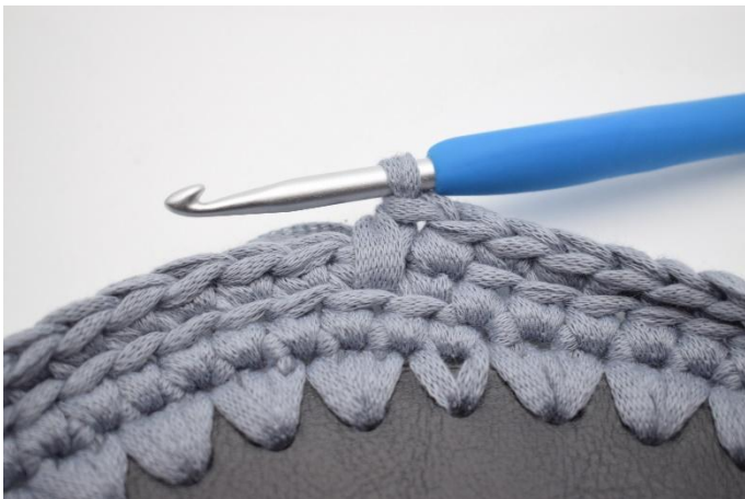
9. Slik. Det er nå heklet 1 fm og 1 lfm.