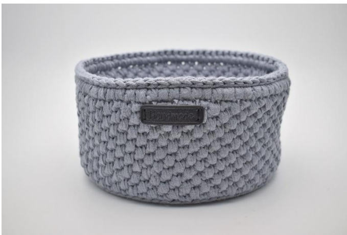
27. Sy "Handmade" merket på med nål og tråd.