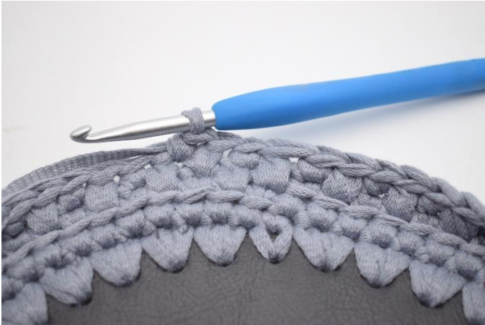
19. Hekle 1 fm i neste m.