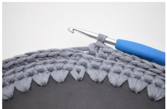
6. Gjenta omgangen rundt med fm i bml.