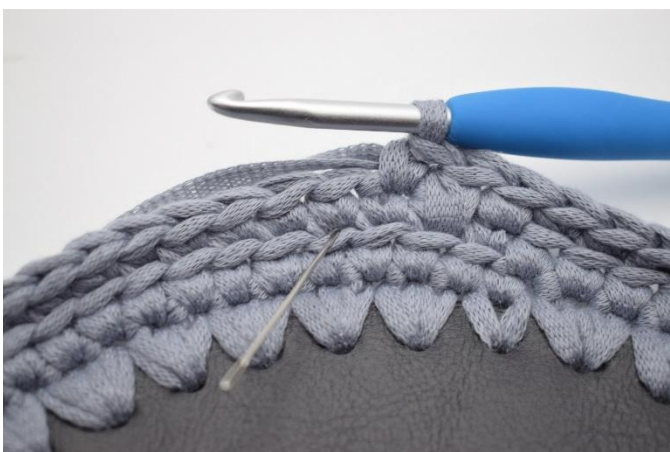
11. Hekle 1 lfm i neste m. Nålen markerer hvor din lfm skal hekles.