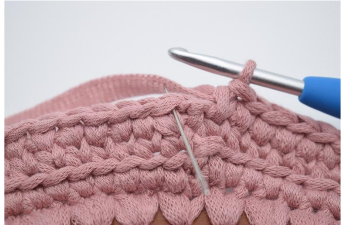
14. Avslutt med 1 km i første m fra omgangens begynnelse.