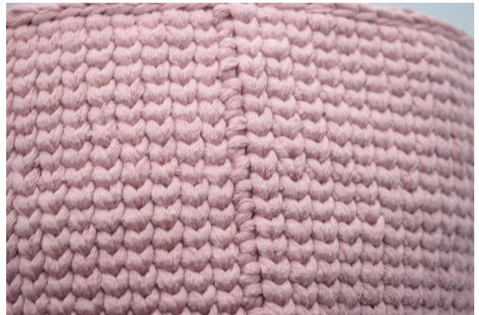
22. Gjenta som beskrevet i oppskriften. Avslutt med 1 omgang km. Ditt arbeid vil se slik ut.