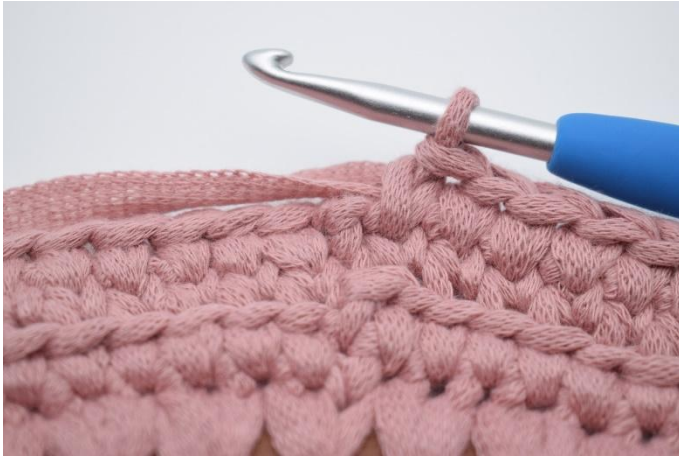
13. Hekle ks omgangen rundt.