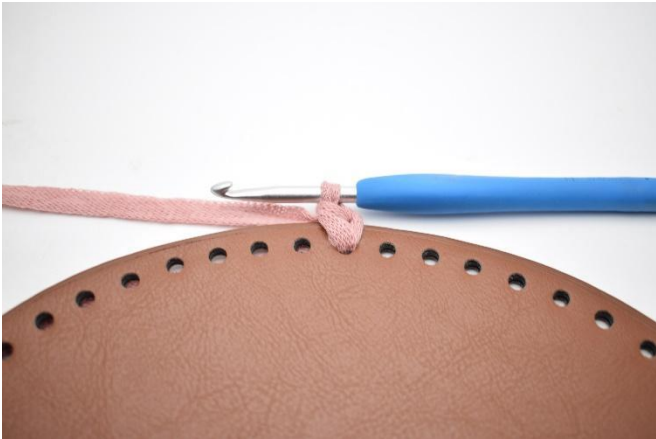
1. Hekle fm rundt i alle huller på bunnen som beskrevet i oppskriften.