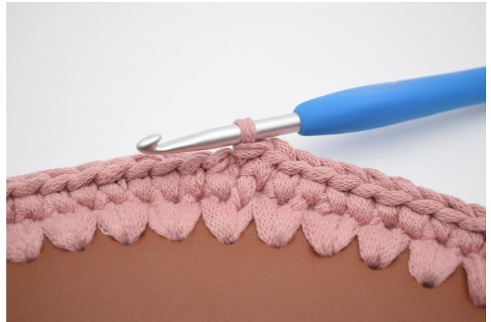
4. Avslutt omgangen med 1 km