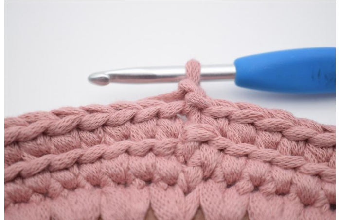
8. Lag 1 lm.