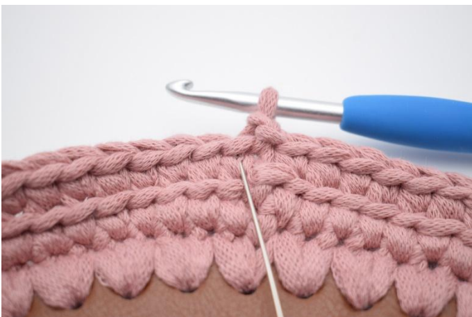
9. Nå skal det hekles ks. Ks er en alm. fm men som er heklet i v én i masken under. Hekle 1 fm i den første v. Nålen her markerer hvor din fm skal hekles.