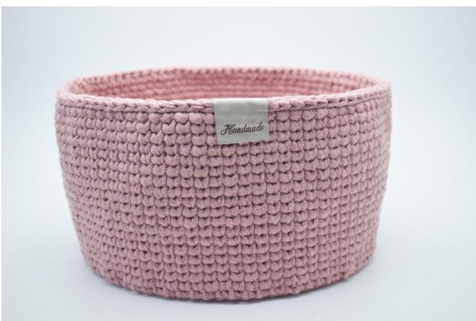
23. Sy eller lim evt. de fine "Handmade" merke fast. Merket er brettes ned over kanten på kurven.