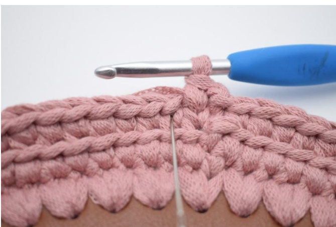
11. Neste fm hekles i vé n i den neste maske.