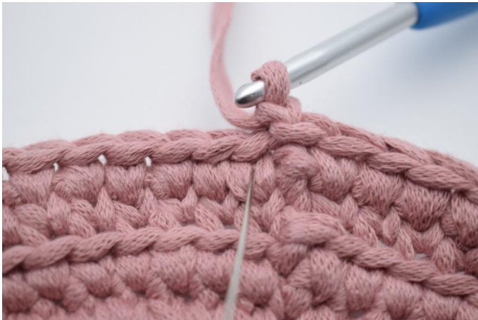
17. Hekle 1 fm ned i vé n på den første maske.