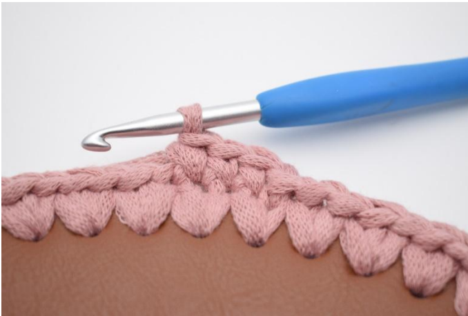
3. Lag 1 lm, og hekle 1 omgang fm.