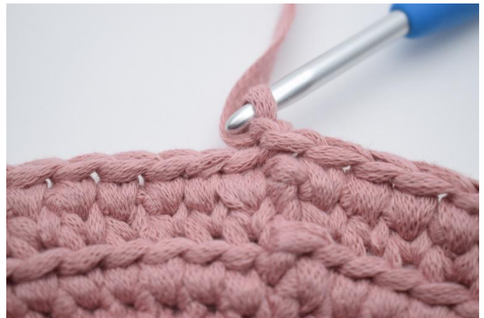
16. Lag 1 lm.