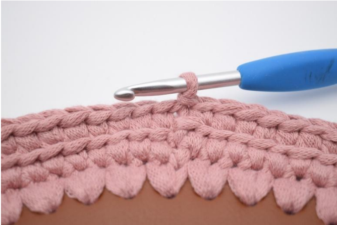
7. Gjenta omgangen rundt og avslutt med 1 lm.