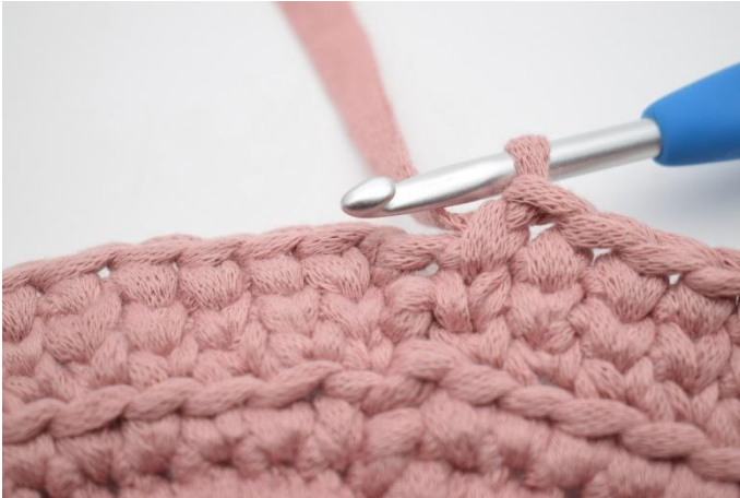
19. Gjenta omgangen rundt.