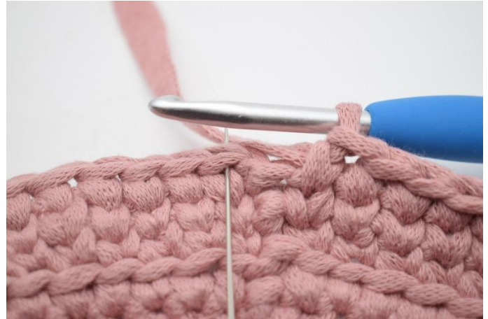
20. Avslutt med 1 km i den første maske fra omgangens start.