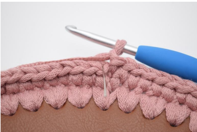
5. Lag 1 lm. Nå hekles det fm i bml. Nålen her markerer hvor din fm skal hekles.