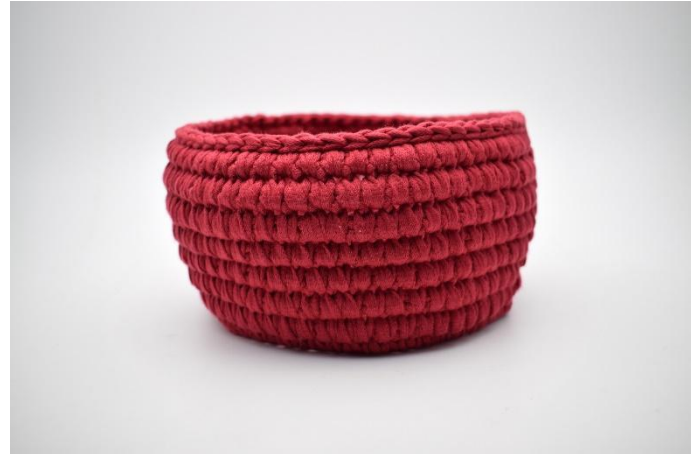
14. Gjenta omgangene som beskrevet i oppskriften. Avslutt med en omgang km.