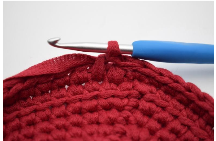
8. Slik. Det er nå heklet 2 lfm.