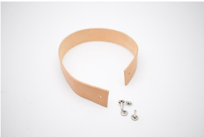
15. Klipp din lærreim til. Lag hull til naglene med hulltang.