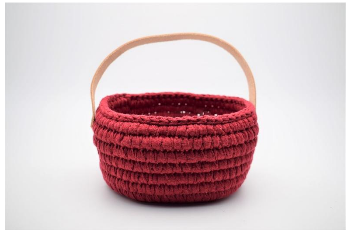
16. Sett hanken på kurven med naglene som bankes lett sammen med en hammer.