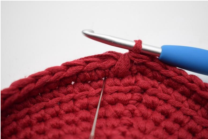
7. Neste lfm hekles på samme måte. Nålen her markerer at det igjen hekles i masken under den du normalt ville hekle neste maske i.