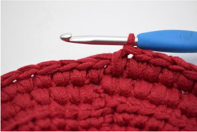
13. Gjenta lfm omgangen rundt.