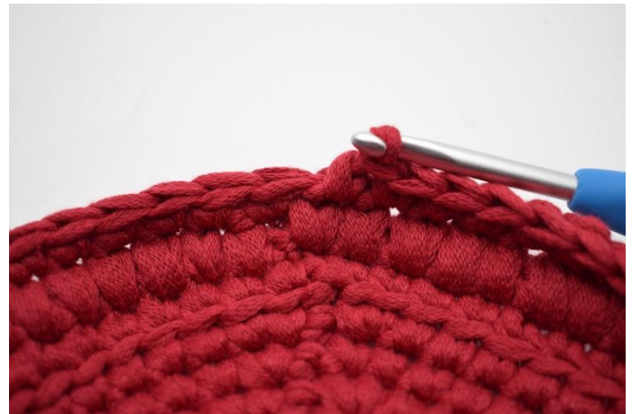
10. Neste omgang hekles fm.