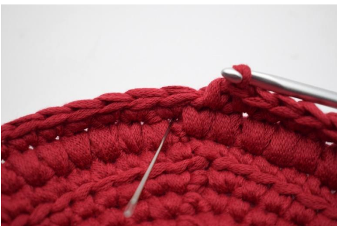
11. Nå gjentas en omgang lfm. Nålen her markerer hvor din første lfm skal hekles.