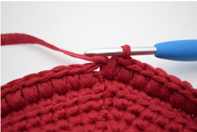
9. Gjenta lfm hele veien rundt.