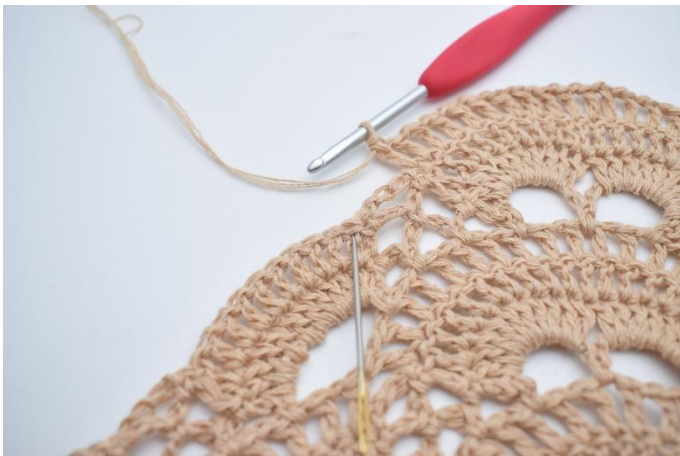
53. Hopp over den lille lm-buen, og hekle 1 stv i den første stv rundt den neste store lm-buen. Nålen markerer hvor din neste stv skal hekles.