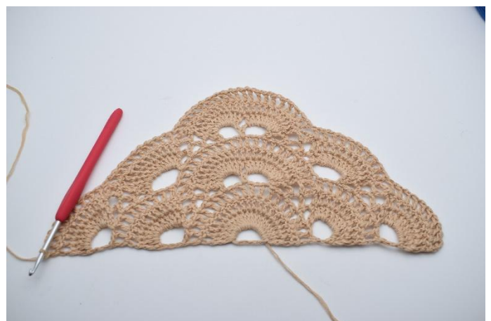
56. Hekle *1 lm, 1 stv* i alle stv rundt den siste store lm-buen. (=10 stv)