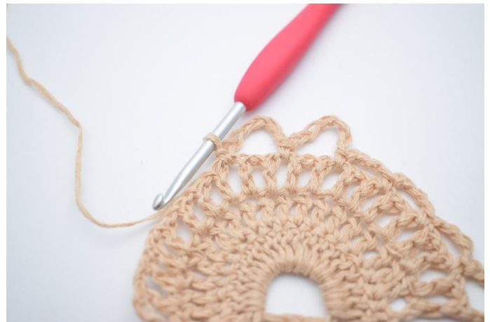
10. Lag 7 lm, hopp over 1 lm-mellomrom og hekle 1 fm i neste lm-mellomrom.