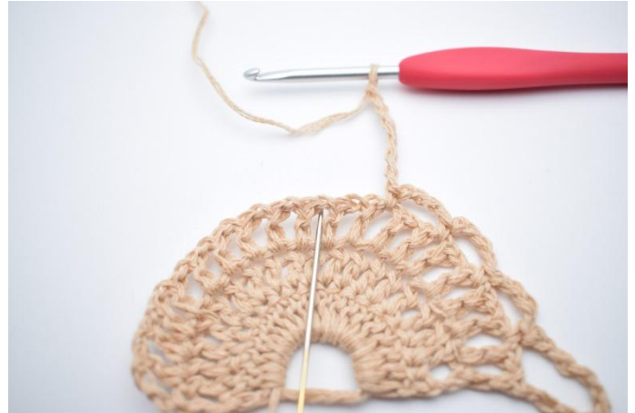
8. Lag 7 lm, Hopp over 1 lm-mellomrom og hekle 1 fm i neste lm-mellomrom.