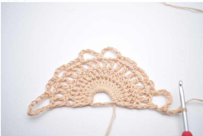
1. Snu ditt arbeid med 3 lm (som erstatter 1stv).