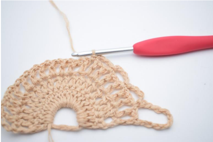
7. Gjenta 1 gang til slik at du har 3 små lm-buer.