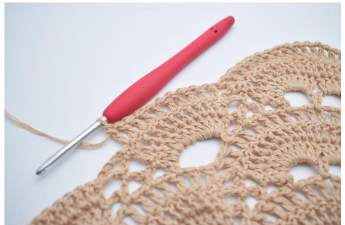
54. Hekle *1 lm, 1 stv* i alle stv rundt den store lm-buen. (=10 stv)