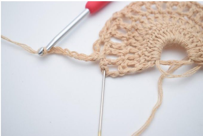
15. Hekle 1 stv i den siste m. Nålen markerer hvor du skal hekle din stv.