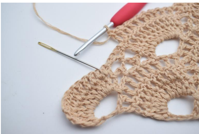
Hopp over den lille lm-buen, og hekle 1 stv i den første stv rundt den neste store lm-buen. Nålen markerer hvor din neste stv skal hekles.