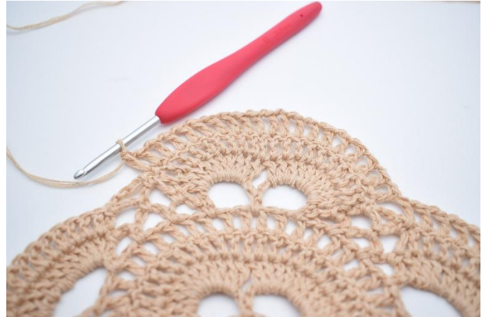
Hekle *1 lm, 1 stv* i alle maskene rundt de 2 store lm-buene. (=20 stv)