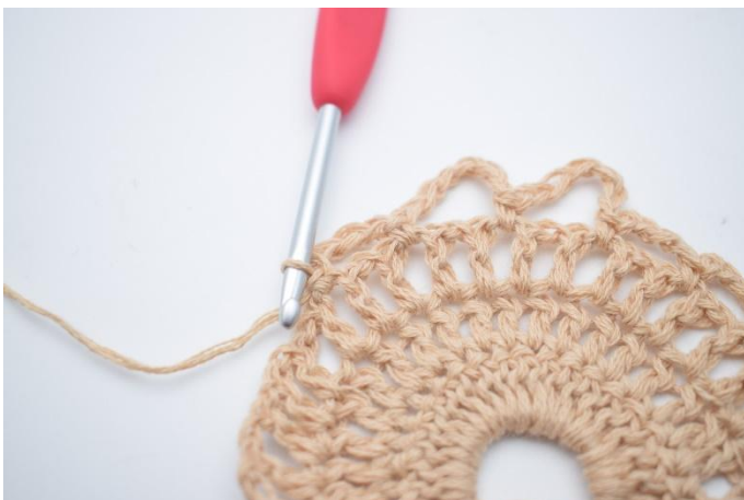
11. Lag 4 lm, hopp over 1 lm-mellomrom og hekle 1 fm i neste lm-mellomrom.