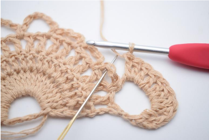
3. Hekle 1 fm i lm-buen ved siden av. Nålen markerer hvor du skal hekle din fm.