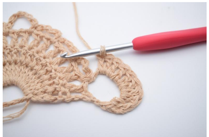
2. Hekle 9 stv i lm-buen (=10 stv).