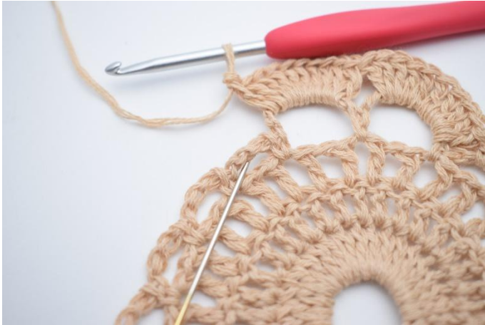
9. Lag 1 fm i lm-buen ved siden av. Nålen markerer hvor du skal hekle din fm.