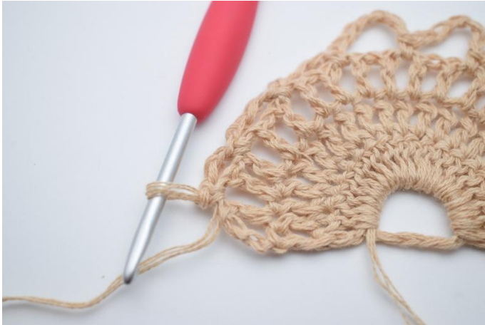
13. Gjenta 1 gang til slik at du har 3 små lm-buene med 4 lm.