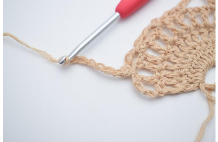
14. Lag 7 lm.