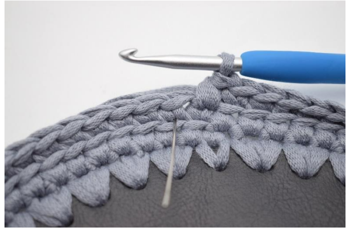
8. Hekle 1 lfm i neste m. Nålen her markerer hvor din lfm skal hekles.