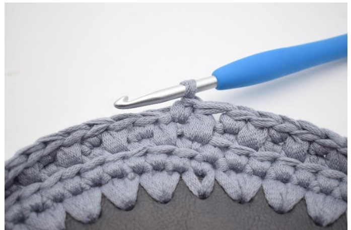
16. Hekle 1 fm i neste m.