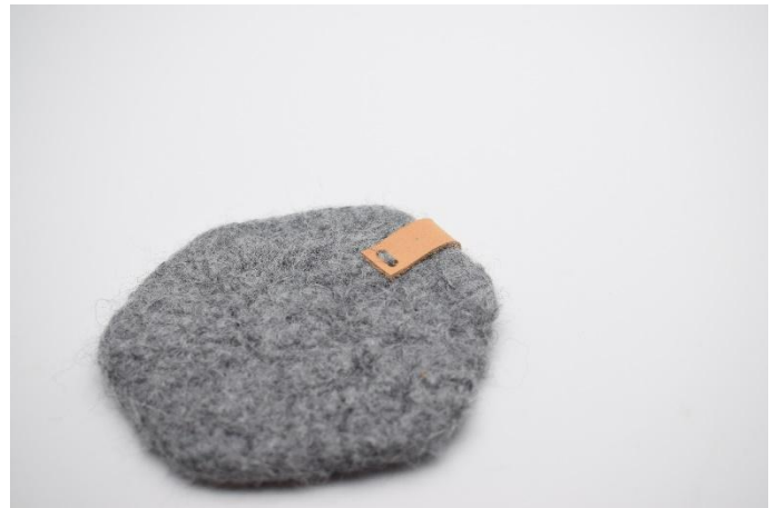
2. Sy den fast på kaffebrikken.