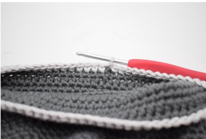
13. Skift til en kontrastfarge. Lag 1 lm og hekle fm omgangen rundt. Avslutt med 1 km. Klipp av garnet og fest ender.