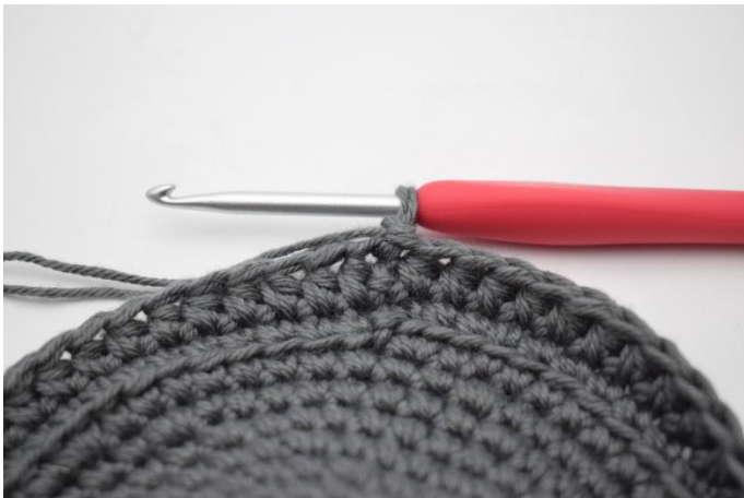
7. Lag 1 lm.