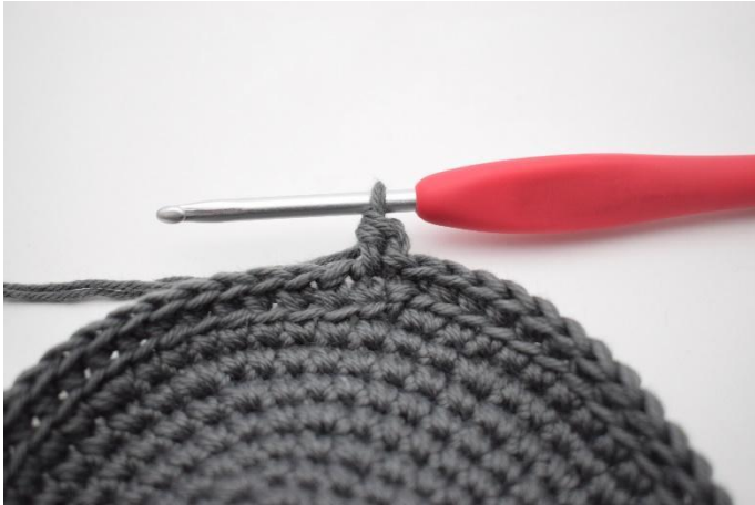
5. Hekle 1 hstv.