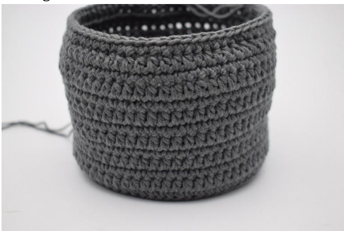
9. Gjenta disse 2 omganger som beskrevet i oppskriften.