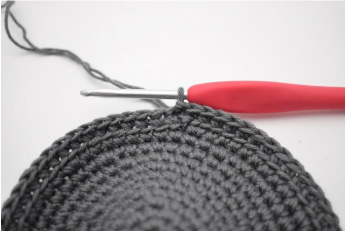
3. Hekle fm i bml omgangen rundt og avslutt med 1 m.