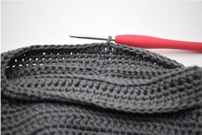
15. Lag 1 lm og hekle hstv omgangen rundt. Avslutt med 1 km.