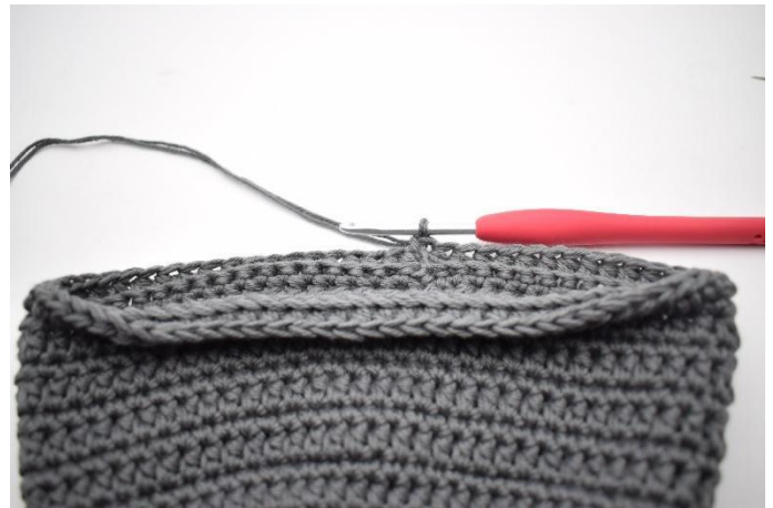
12. Avslutt med 1 km.