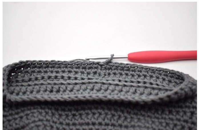
14. Lag 1 lm, og hekle fm omgangen rundt. Avslutt med 1 km.