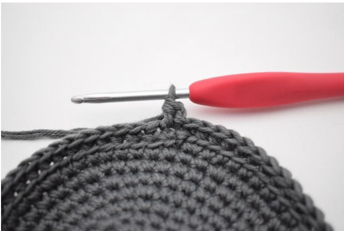
5. Hekle 1 hstv.