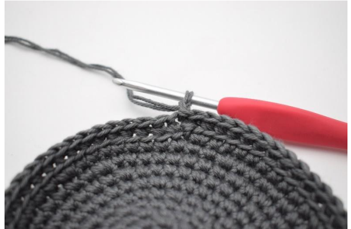
4. Lag 1 lm.