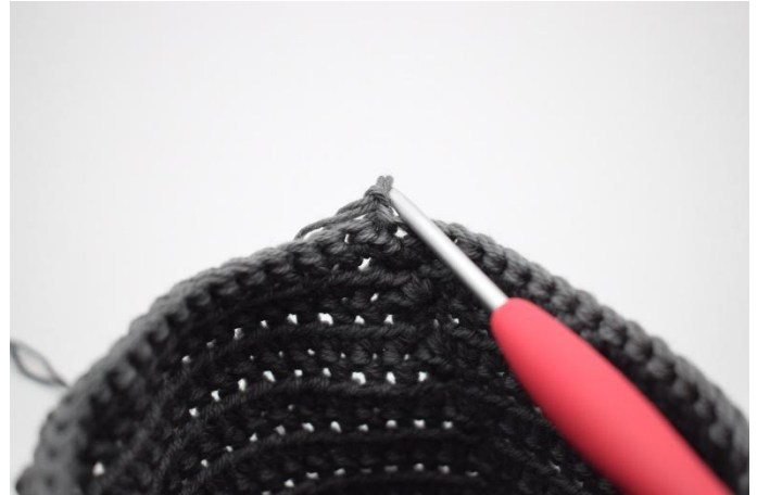
10. Snu/drei nå kurven, slik at du hekler innenfra kurven og ut.