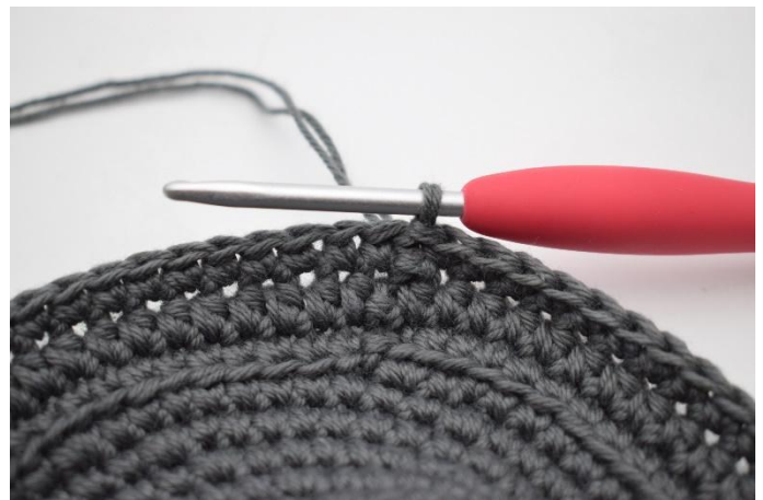
8. Hekle 1 omgang fm og avslutt med 1 km.