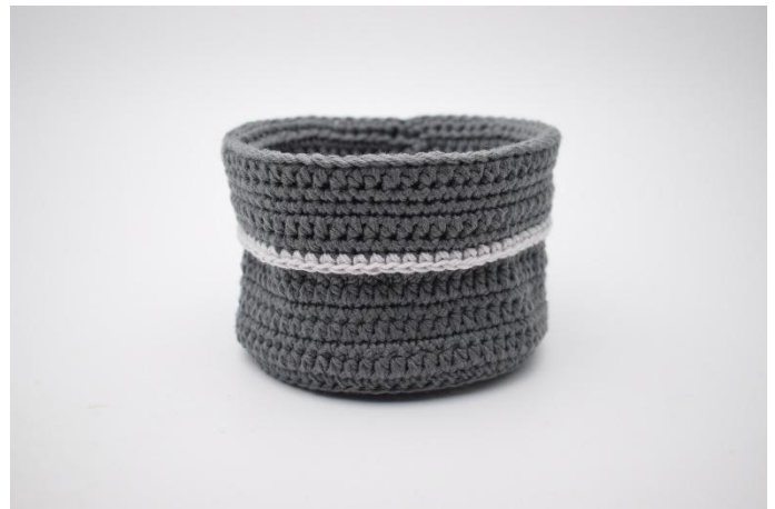
18. Fold nå kanten ned over kurven, og monter oppheng.