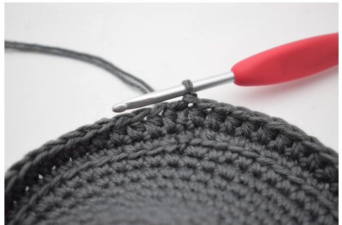
6. Hekle hstv omgangen rundt og avslutt med 1 km.