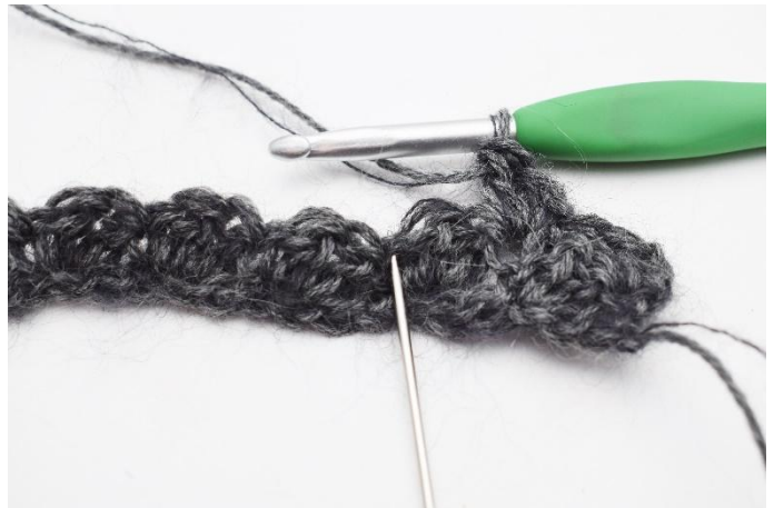
6. Hopp over 2 masker,