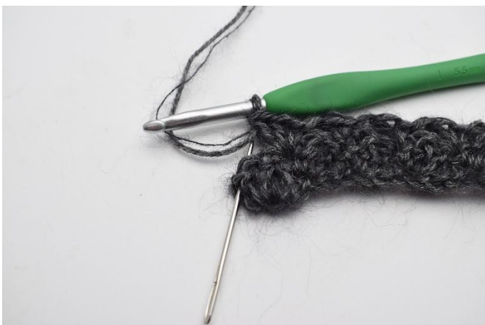
9. I snu-masken, (nålen her markerer din vendemaske fra forrige rad)