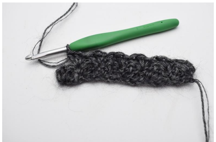
8. *Hopp over 2 masker over, hekle 1 fm, 2 stv i neste* Gjenta *til* raden ut.