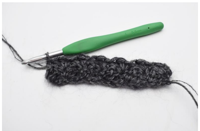
10. hekles det 1 fm.