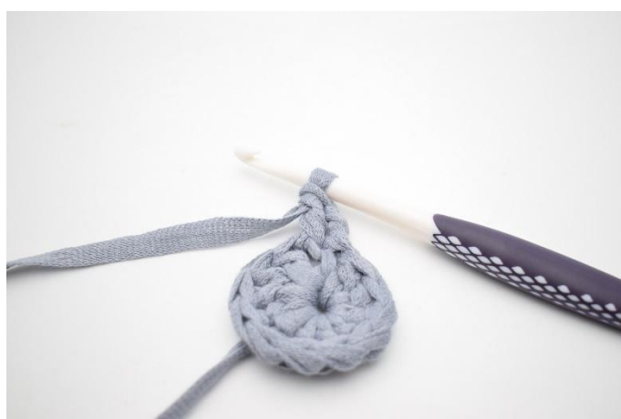
4. Hekle 1 stv i samme m.