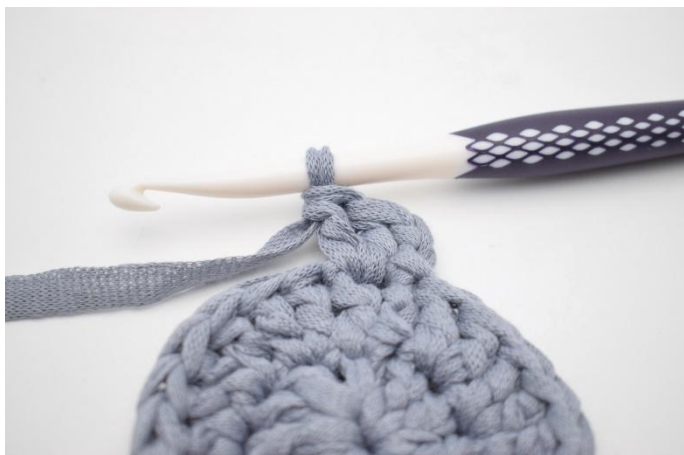
7. Hekle 2 stv i neste m.