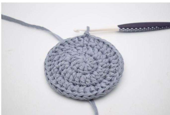
9. Gjenta *til* omgangen rundt, og avslutt med 1 km i første m. (=36)