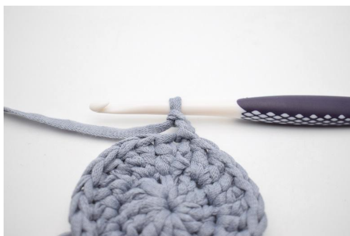
6. Lag 2 lm (som erstatter 1. stv).