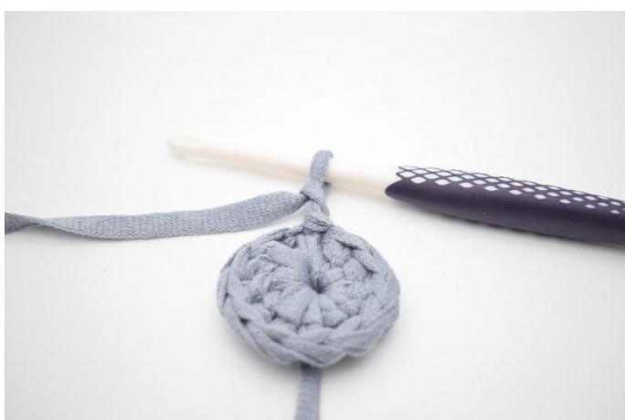
3. Lag 2 lm (erstattet 1.stv).