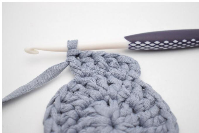
8. Hekle *1 stv, 2 stv i neste*.