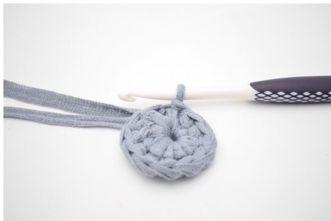
2. Hekle 11 stv ned i ringen, og avslutt med 1 km i første m. (=12)