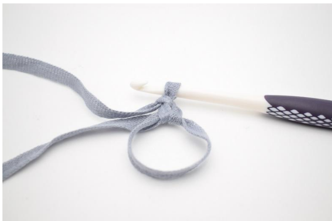
1. Lag en mr. Lag 3 lm (som erstatter 1. stv)