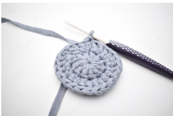
5. Hekle 2 stv i alle masker rundt. Avslutt med 1 km i første m. (=24)