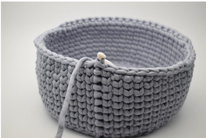
7. Hekle ks i de siste 10 m. Avslutt med 1 km.