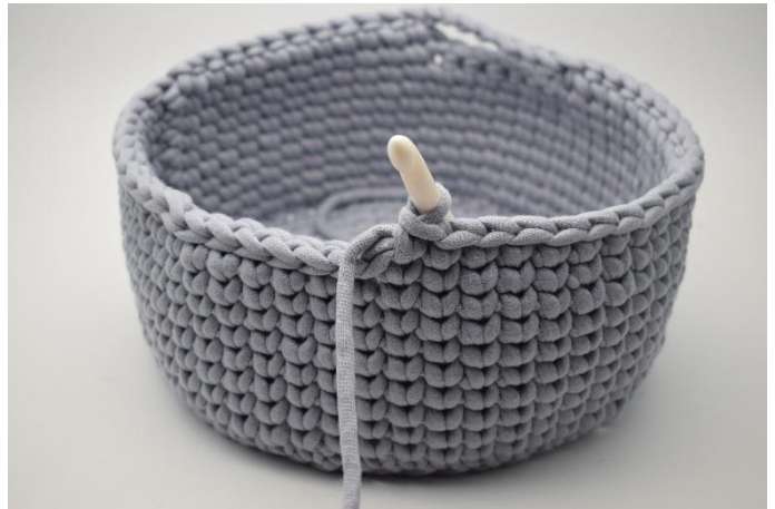
4. Hekle ks i de neste 21 m.