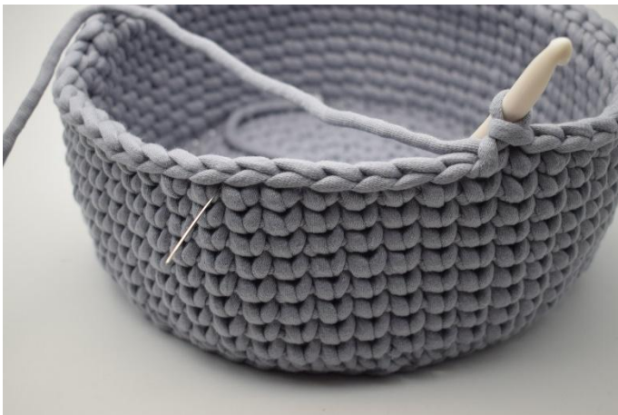
5. Hekle nå km hen over de neste 6 m hvor du normalt ville hekle ks. Det hekles i alt 7 km.