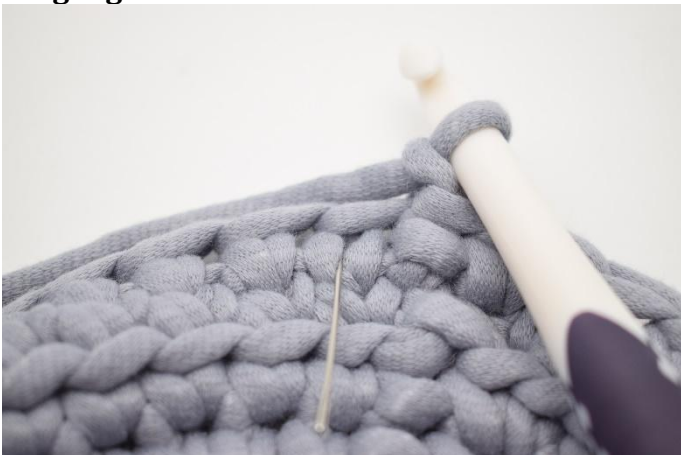
1. Lag 1 lm. Denne omgang hekles som omgang 8. Hekle 1 ks i neste m. Nålen markerer hvor din maske skal hekles.