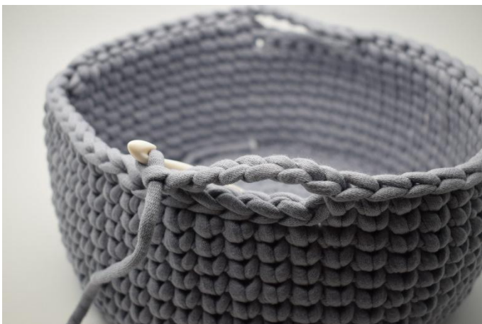
5. Lag 7 lm, Hopp over de 6 m det er heklet km i.