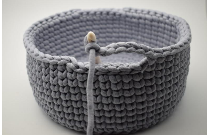
2. Lag 7 lm. Hopp over de 6 m det er heklet km i.