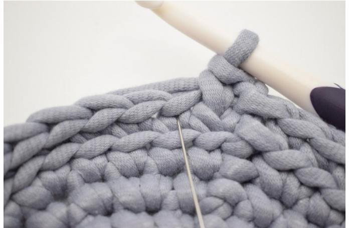
4. Hekle 1 ks i neste m. Nålen her markerer hvor din fm skal hekles for å bli til en ks.