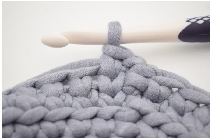
2. Slik. Det er nå heklet 1 ks.