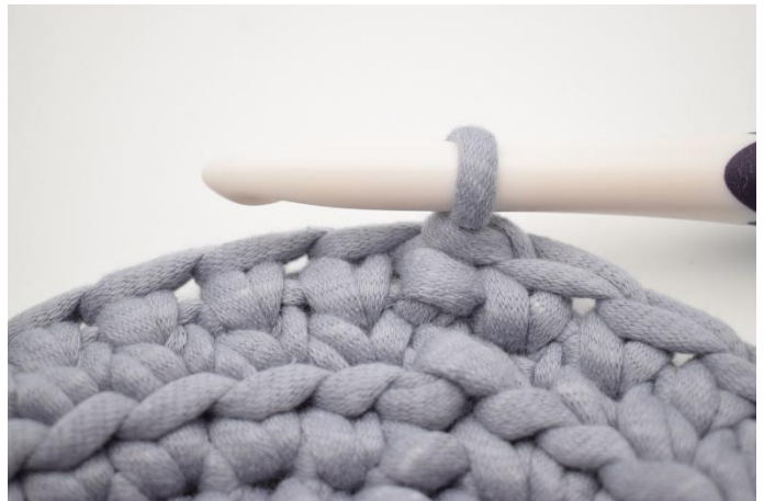
6. Gjenta med ks omgangen rundt og avslutt med 1 km.