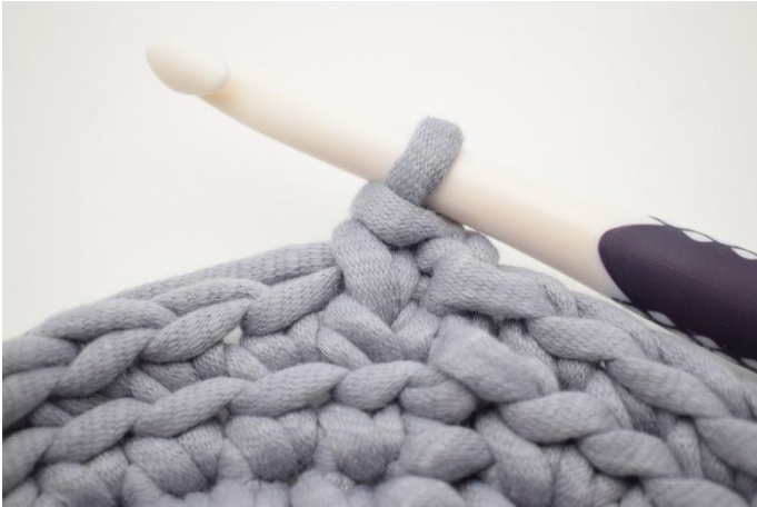
3. Slik. Det er nå heklet 1 ks.