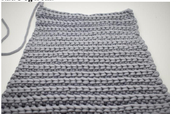
1. Gjenta rad 2 i alt 25 ganger. Klipp av tråden og fest ender. Hekle 1 stykke til lik til denne.