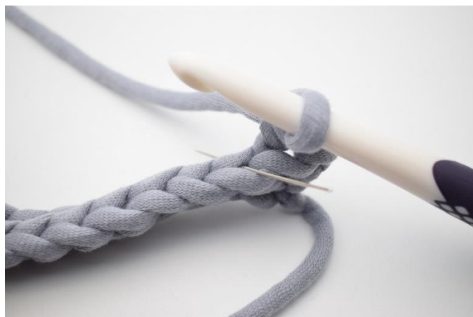
4. Hekle 1 fm i bml i neste m. Nålen her markerer den lenke din fm skal hekles i.