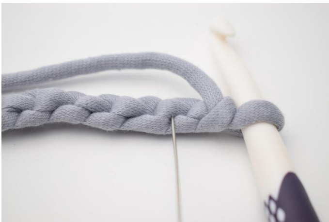
3. For å få en penere kant kan man med fordel hekle fm i de vannrette lenker. Nålen her markerer den lenke din første fm skal hekles i.