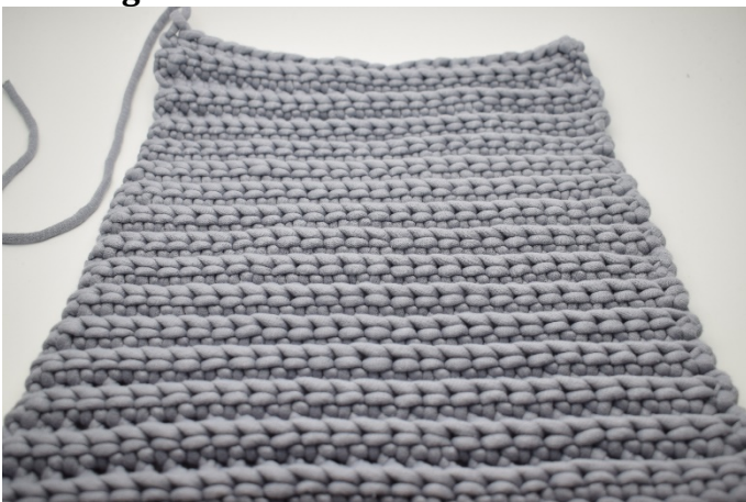
1. Gjenta rad 2 i alt 25 ganger. Klipp av tråden og fest ender. Hekle 1 stykke til lik til denne.