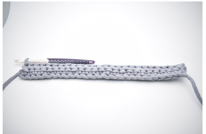
6. Gjenta raden ut.