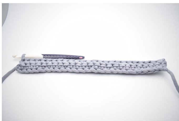
6. Gjenta raden ut.