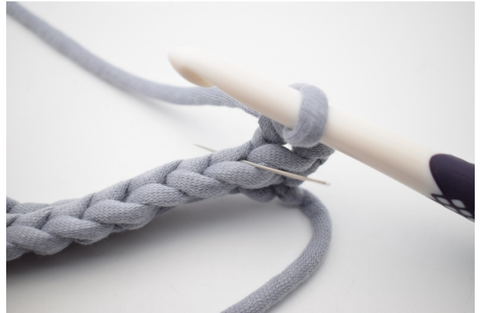
4. Hekle 1 fm i bml i neste m. Nålen her markerer den lenke din fm skal hekles i.