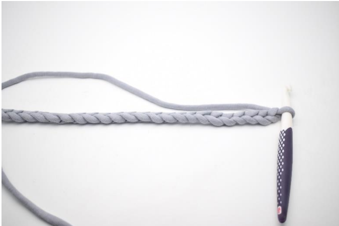
1. Lag dine lm.