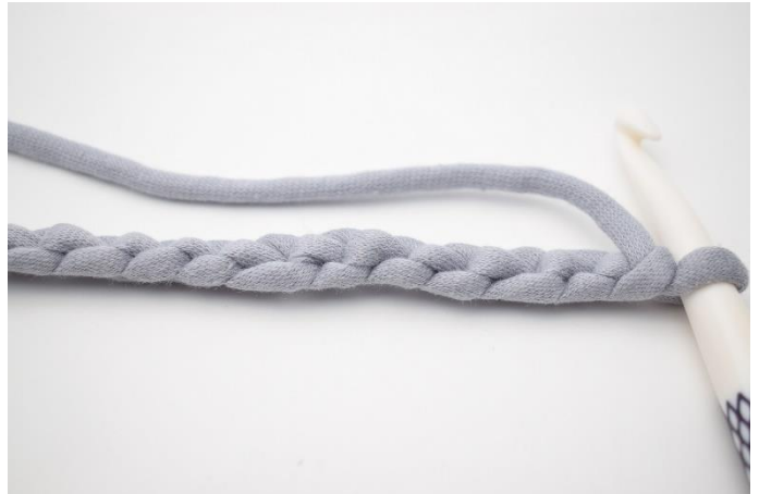
2. Drei din lm-rad slik "baksiden" vender oppover.